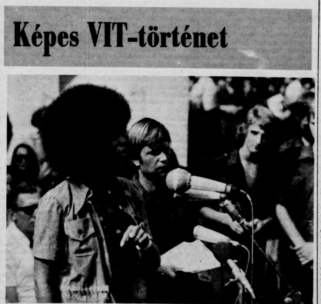
1973 — BERLIN. Másodszor gyűltek össze a világ ifjúságának képviselői az NDK fővárosában. A számos vendég közül is megkülönböztetett figyelem kísérte Angela Davisnek, a börtönből kiszabadult amerikai néger polgárjogi harcosnak, kommunista filozófusnak beszédeit