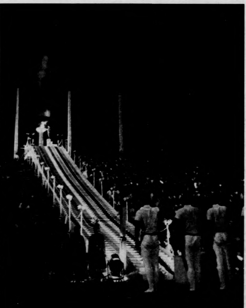
1968 — SZÓFIA. Ez a fesztivál elsősorban a vietnami néppel való szolidaritás jegyében zajlott le. A bolgár főváros plakátja ezt hirdette: „Egy vonatot Vietnammak!” Képviselet: meggyulad a VIT-láng a Levszki-stadionban