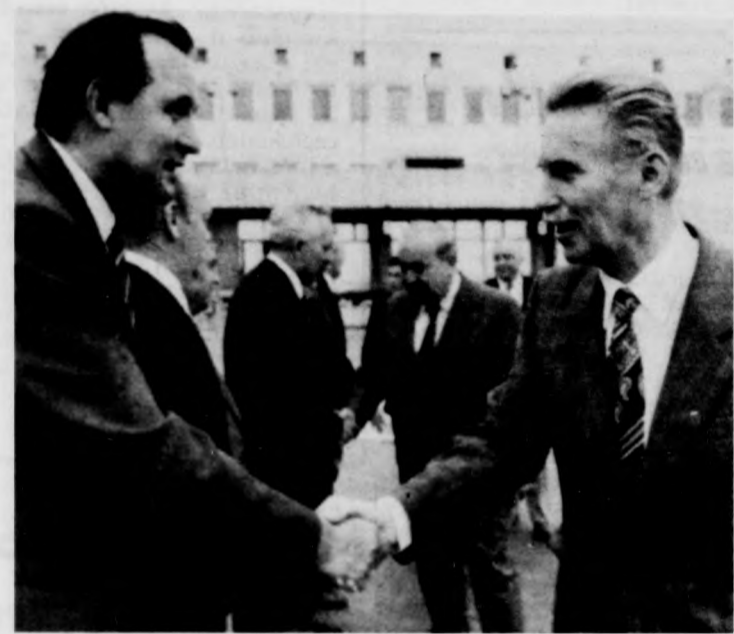
A küldöttség búcsúztatása a Ferihegyi repülőtéren

Lázár Györgynek, a minisztertanács elnökének vezetésével hétfőn Varsóba érkezett az a magyar küldöttség, amely részt vesz a KGST 40. ülészakáján. A delegáció tagja Havasi Ferenc, az MSZMP Központi Bizottságának titkára, Marjai József miniszterelnök-helyettes, hazánk állandó KGST-képviseleje, Faluvégi Lajos miniszterelnök-helyettes és Horn Gyula külügyminisztériumi államtitkár. Varsóban csatlakozott a küldöttséghez Szigeti István, hazánk állandó KGST-képviseleje helyettese.