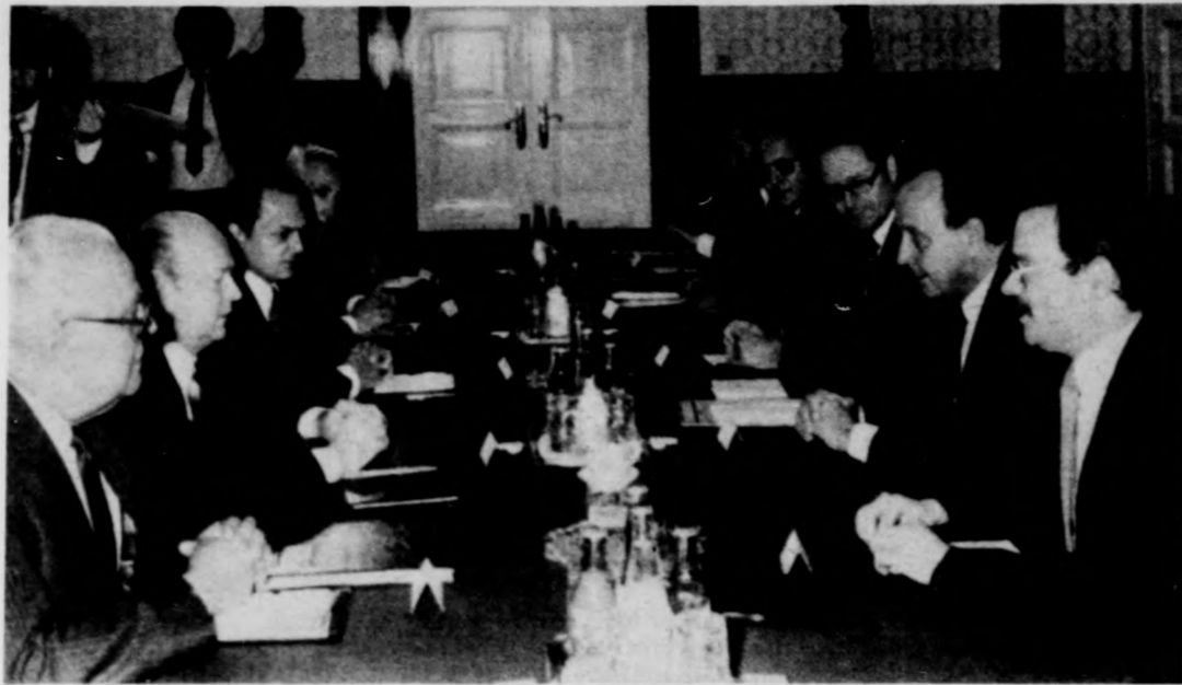
Megkezdődtek a magyar—NSZK külügyminiszeri tárgyalások. Balról a Várkonyi Péter vezette magyar, jobbról a Hans-Dietrich Genscher vezette nyugatnémet delegáció.