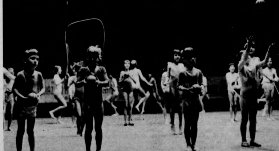
Az óvodás és kisdobos csoport