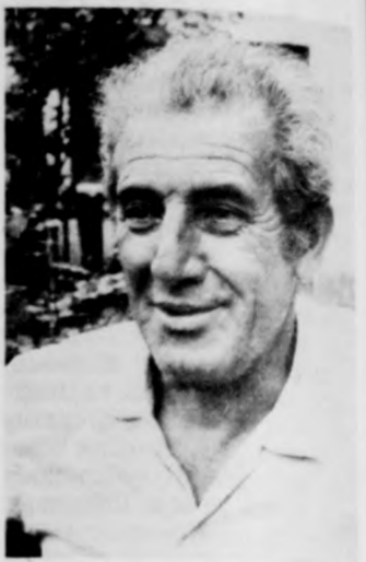
ragaszkodott ahhoz, hogy ő krumplit vitt.

— Lajos, baj van! Eltűnt a legszebb két malac! Hívom gyorsan az üzemigazgató-helyettest, mondom neki mi történt, de azt is, hogy szinte biztosra tudom, ki vitte el a malacokat. Na, behívjuk a fiút. Próbáltunk a lelkére beszélni, de csak