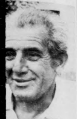
... ahhoz, hogy ő ... tud mutatni - azt a krump- ... mondja! - Ott a konyhában az ...

... siba ültünk a tár- ladjon-örrel, a te- vel, meg a fiúval - za a fejleményeket - zárva az ajtó- t, hogy az anyjánál- lics. Megkerestük a- nyen. A fiú kint- kérték: mennyi- vitt haza a fiú.