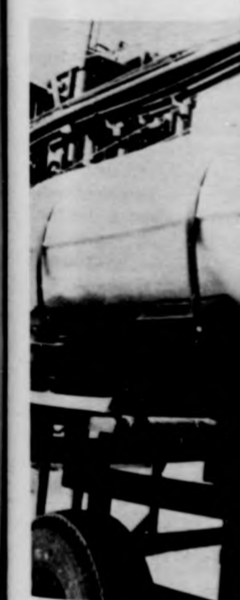
Ez a Globál permet

A hiányzó kapac gazdasági munkakö tagjainak munkáját sikerült pótolni, am százszázalékos bizo vállalt kötelezettség sére, mert vannak r dályozó tényezők is geiek ugyanis több kátrész kénytelene az általuk készített be, amelyek importóznak. Ez bizony megnehezítette már a munkájukat. Ezen nak kooperációs p is, akikkel előfordul nem teljesítik hatá szállításaikat. Egyletore tehát túl melés teljesítését ak tényezővel kell meg uk a MEZŐGÉP-ese