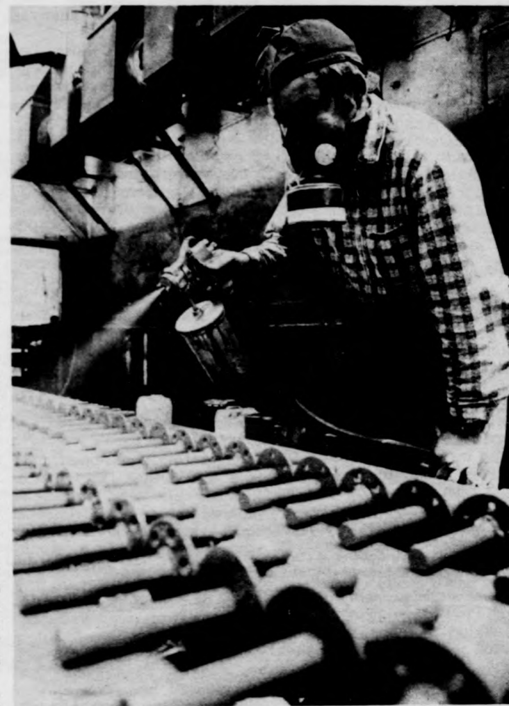
Az utolsó műveletek közé tartozik a festés