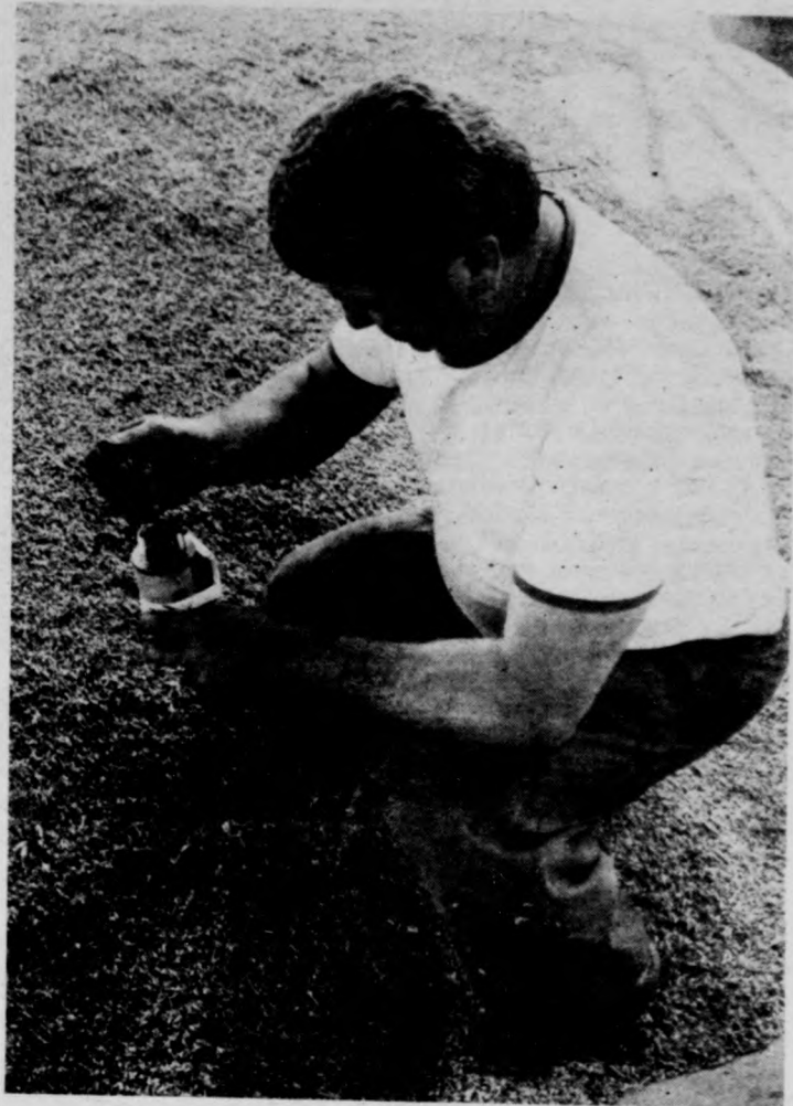
Mintát vesznek a nedvességtartalom-méréshez

Az OBT állásfoglalása végül hangsúlyozza: a békehónap sikeres akcióorozata véget ért, de folytatódnak a békéért való kiállítás és küzdelem hétköznapijai. A magyar békemozgalmak a jövőben is mindent meg kíván tenni a háború elhárításáért, a békés viszonyok térhódításáért, valamennyi békeszerető erő cselekvő egységéért, határainkon kívül és belül. (MTI)