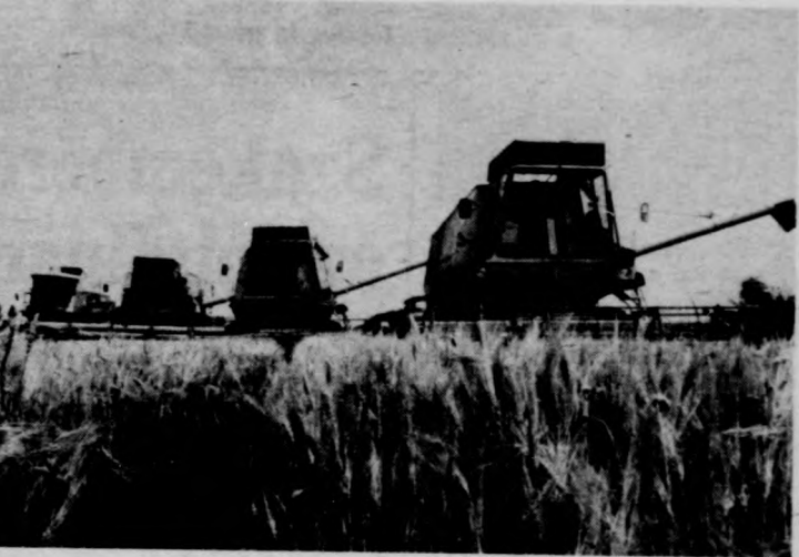
A kombájnok kihasználják minden perc jó időt