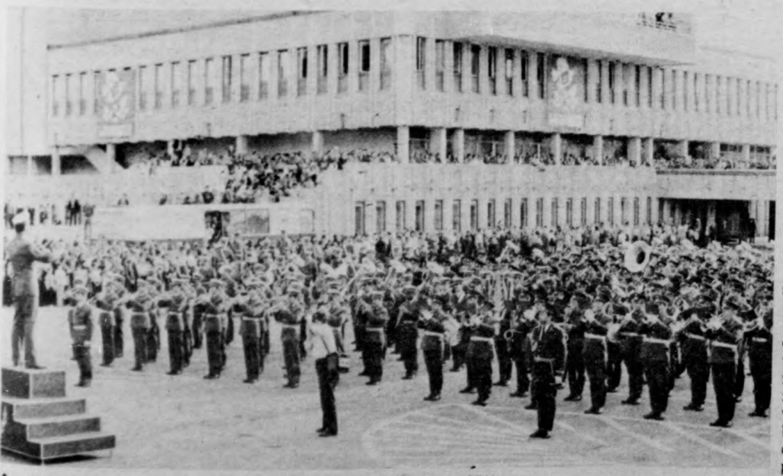
Az egyesített zenekar a Kőlcsey Művelődési Központ előtt

Ünnepi hangversennyel kezdődött vasárnap az V. debreceni katonazenekari fesztivál záróprogramja: a Kőlcsey parkban a Szovjet Hadsereg és Haditengerészeti Flotta Központi Zenekara adott koncertet. A fesztivál záróünnepélyének színhelye este nyolc órakor ismét a Lenin-szobor előtti tér volt, ahol ezúttal is több ezer érdeklődő szemlélte a résztvevő zenekarok bemutatóját.