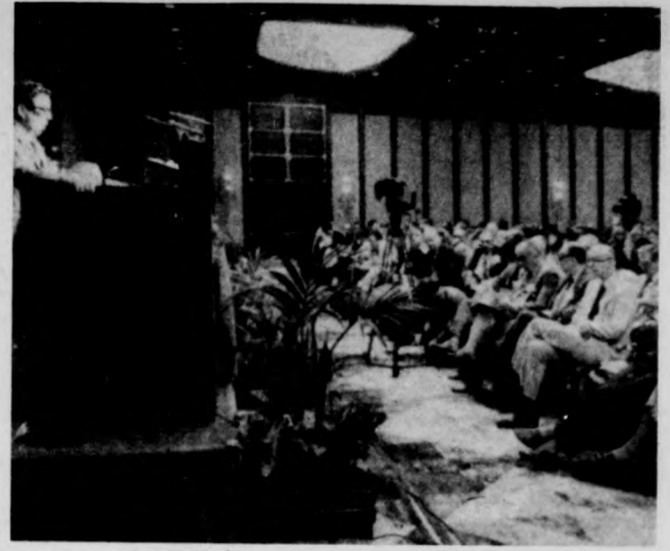
Csazov szovjet akadémikus beszél

A kelet-nyugati bizalom, illetve bizalmatlanság pszichológiai vonatkozásairól ta-