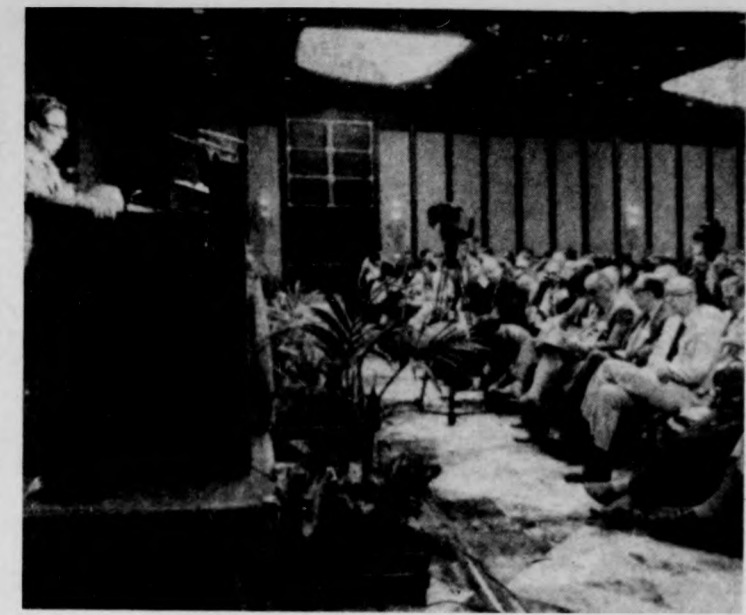
Csazov szovjet akadémikus beszél

Délután, a Magyar Tudományos Akadémia várbeli kongresszusi termében kezdődött meg a kongresszus fő témájának megvitatása az Atomfegyverek s atomháború: orvosi áttekintés címmel. Az ülésen nemzetközi szakteknikéket adtak tájékoztatást a fegyverkezési verseny orvosi vonatkozásairól, s beszámoltak arról, milyen szerepet játszanak a világ orvosi és nukleáris háború megelőzéséért folytatott küzdelemben. A felszólalók hangsúlyozták: az emberek közül sokan azzal magyarázzák a közömbösségüket, hogy az atomháború nem jelent közvetlen veszélyt, s legfeljebb az elkövetkező generáció számára válhat konkrét fenyegetéssé. Ezt tarthatatlan álláspont. Világosan kell látni, hogy mindannyian potenciális áldozatok vagyunk. Nagy szükség van tehát arra, hogy az emberek érzelmileg is