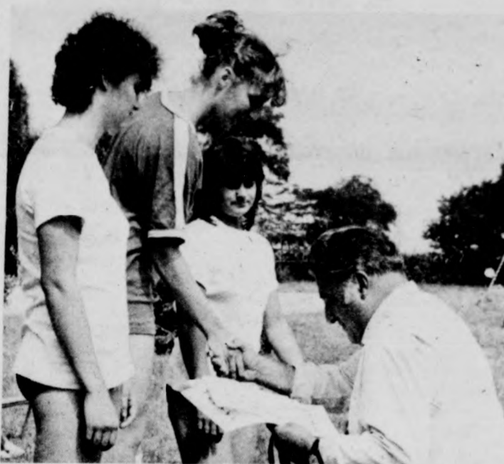
A női 100 méter díjkiosztása

Hajdúszoboszlón rendezték meg szombaton a Mezőgazdasági és Erdészeti Dolgozók Szakszervezete Hajdú-Bihar megyei Bizottságának megyei sportnapját. A mezőgazdasági szakmunkásképző intézet pályáin négy sportágban vetélkedtek a csapatok — gördülekeny rendezésben.