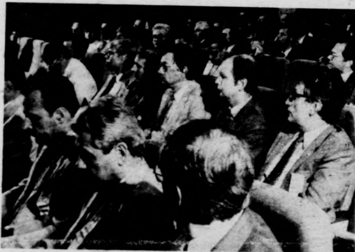
A konferencia résztvevői a tanácskozáson