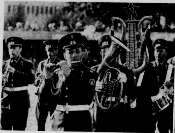
A szovjet együttes muzikusai