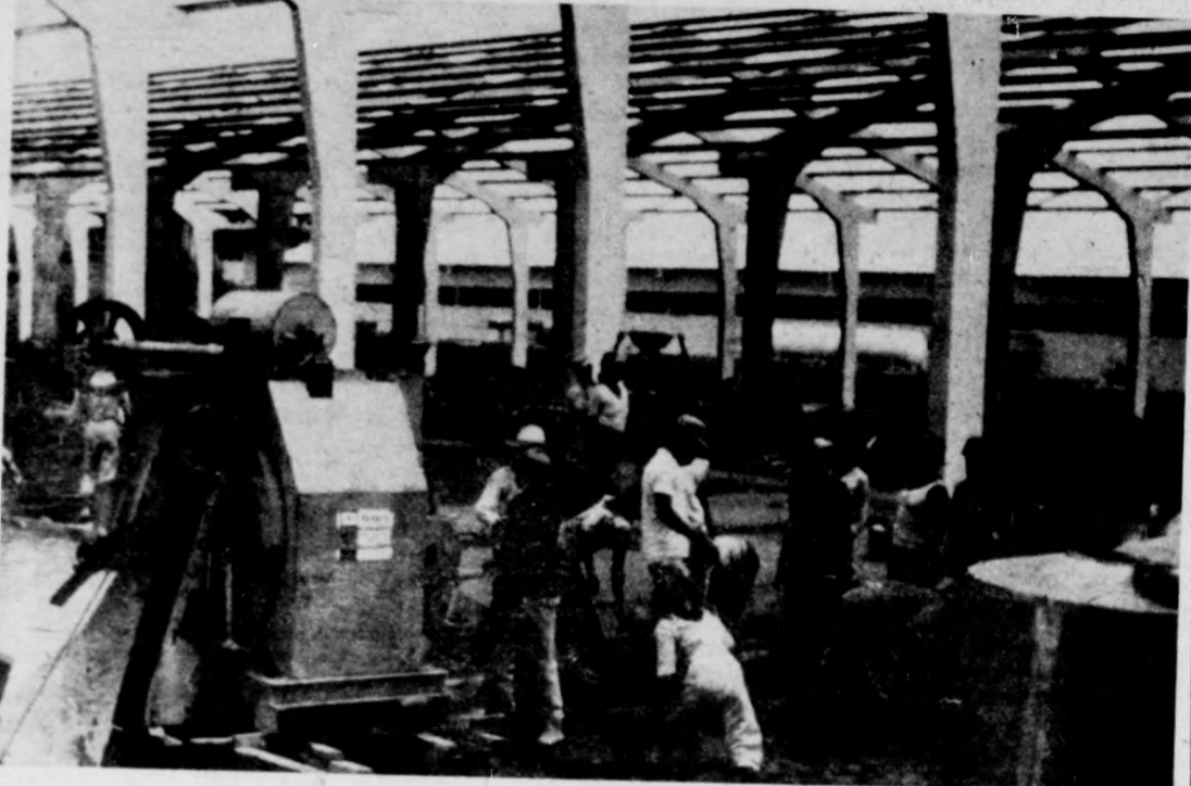
Szerelőmunka a csarnokban

szakemberek közreműködésével irányította. — 1984. május 24-én az üzemek közül elsőnek az üvegtechnikai műhely gépeit termelésre készen megindítottuk, néhány hét múlva a hőmérő-műhely és a hozzá csatlakozó egysége is készen álltak a termelésre. Jött a próbüzemelés és a betanítás. A betanításra városi szakembereket a PRODA cég adta, ez menedzselte a vállalkozást. Emlékszem, hogy amikor az első termé-