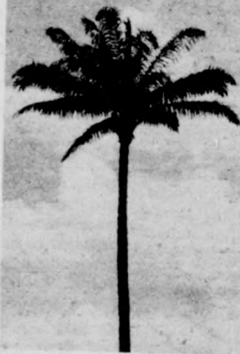
A jellegzetes afrikai növény: a pálma