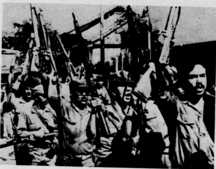
A sandinista hadsereg katonái kifejezik elszántságukat a forradalom védelmére

A Sandino tábornok nyomdokaiba lépő haladó managuai kormány háromfrontos — katonai, gazdasági, politikai — harcok kénytelen folytatni fennmaradásáért. Washington sokeresz ellenforradalmi hadsereget pénzelt, lát el fegyverrel, emellett a közvetlen beavatkozás lehető-