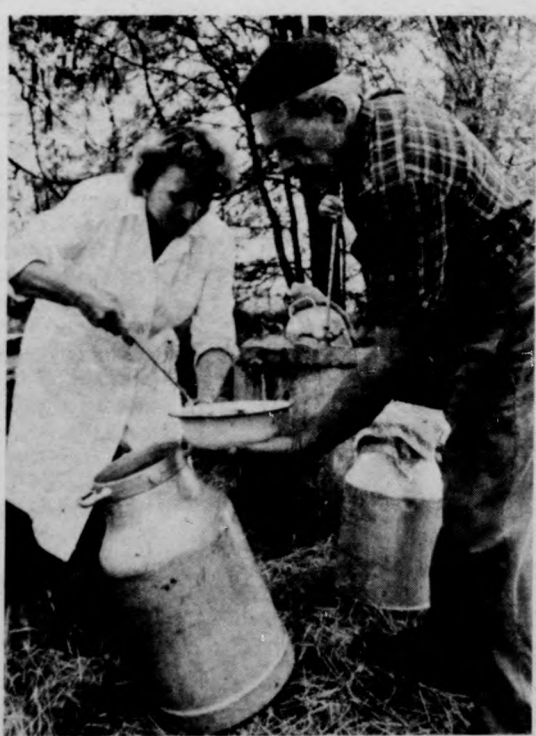
Megérkezett az ebéd