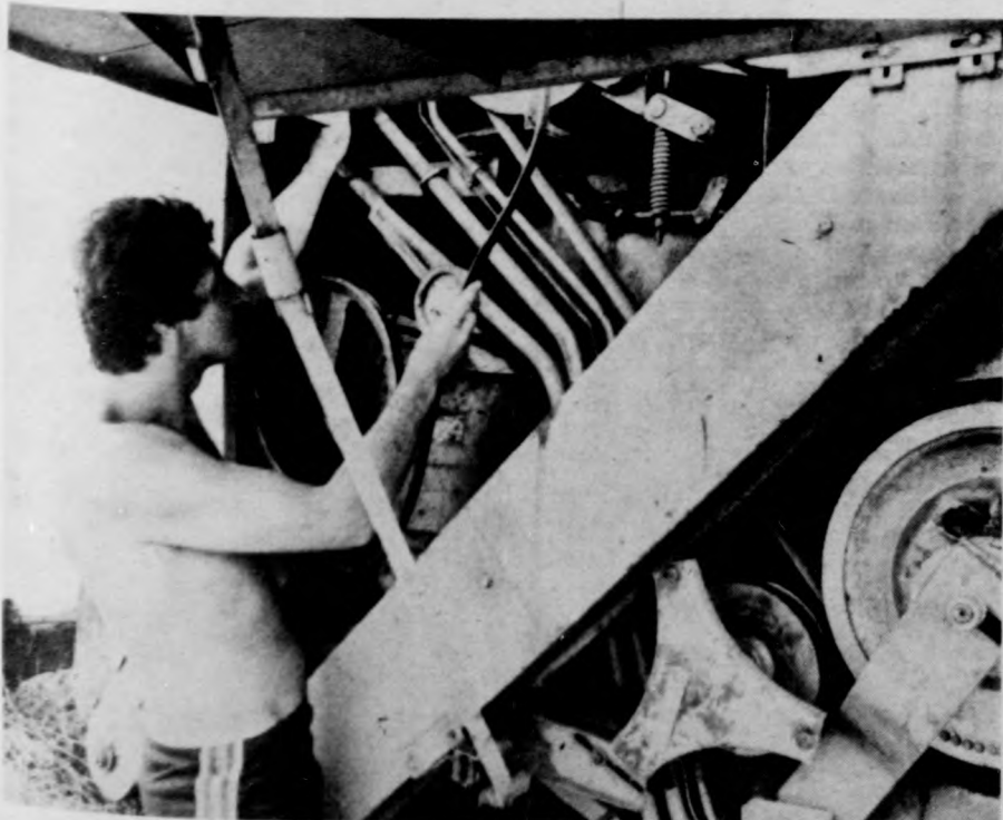
Baj van az ékszíjjal

A mostani meleg idő kedvez a megközelítően százezer hektárnyi cukorrépa fejlődésének, s amennyiben a továbbiakban esővel tarkított napos idő alakul ki, jó termést takaríthatnak be a gazdaságok. Az első cukorrépa-szállítványok várhatóan szeptember második felében érkeznek a gyárakba, amelyek a termelés fokozatos felfutásakor naponta összesen 40 ezer tonna cukorrépa-t dolgoznak fel. (MTI)