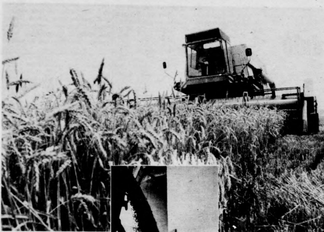
Aratás Berettyóújfalui határában, a Csárda-hátón