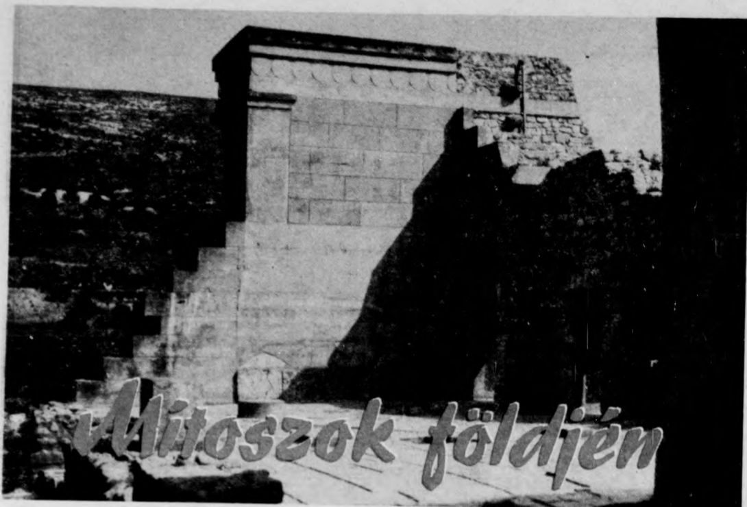
Részlet a palotából