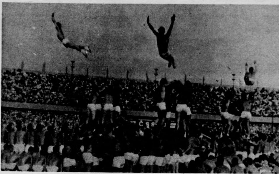
Katonák a strahovi stadion légtérében. A prágai spartakiád leglátványosabb gyakorlatát mutatták be