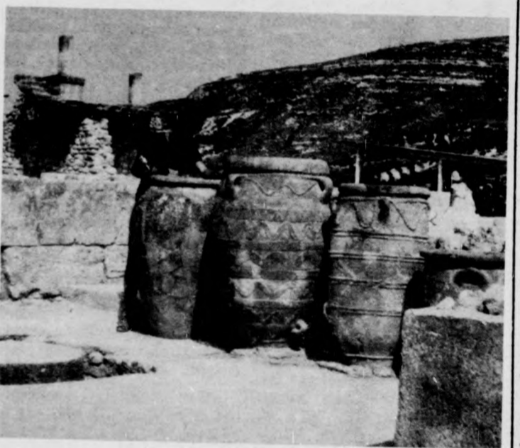
Ilyen nagyok a pithosok

Bármennyire is száz csodát nyújt Athén, egy görögországi utazás sava-borsa mégis a szigetjárás. Érzem én is, bár egyelőre nehezen tudom elképzelni, hogy ha lehet, még nagyobb csodák várnak ránk, ha nekivágunk a „borizú” tengernek. Pireuszba, Athén kikötővárosába érkezve megpillantjuk az elképesztően nagy, háromemeletes hajót, az Ariadné, mely egy éjszakán át otthunk lesz. A hajó valóságos úszó szálloda étteremmel, bárral, játéktérrel — igaz, nem nekünk. A mi helyünk a turistáké, egy folyosó emeletes ágyakkal, amit, úgy döntünk, nem veszünk igénybe áporodott, levegőtlen volta miatt. Inkább alszunk a fedélzeten. Hamar leszáll az éjszaka a tengeren, alszik is mindenki rajtam kívül. En képtelen vagyok lepihenni, ébren tart a türelmetlen várakozás izgalmá.