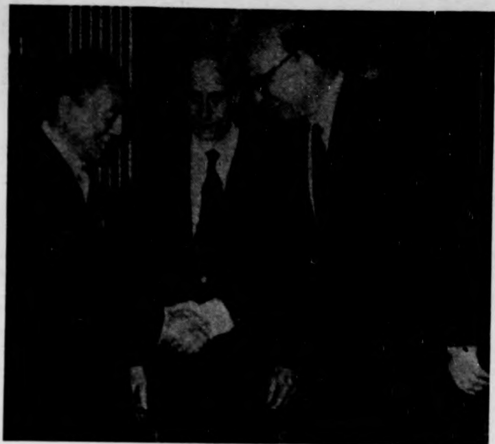
Nyugat-európai körútra során Rómában tárgyal Nakazono japán kormányfő. A képen a politikust Craxi olasz miniszterelnök üdvözi