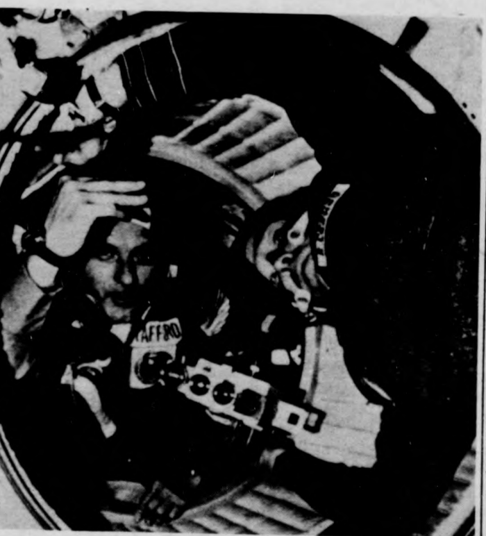
Stafford és Leonov parancsnokok az űrhajókat összekötő szilipkamrában

Tíz esztendeje, 1975. július 15-én két űrhajó fel szállásáról is beszámolhatunk a hírközlő szervek. A szovjet Szovjet—19 fedélzetén Alekszej Leonov és Valerij Kubaszov, míg az amerikai Apollo űrrakétában Thomas Stafford, Vance Brandt és Donald Slayton indultak el, hogy Földünkől több száz kilométerre űrhajóik összekapcsolásával létrehozzák az első — s a maga nemében, sajnos máig egyedülálló — nemzetközi űrállomást. A két különböző technika ezredmásodpercnyi összehangolásának eredményeként július 17-én a Szovjet—19 fedélzetén — 1 milliárd tv-néző előtt — Stafford és Leonov parancsnokok megejtették történelmi jelentőségű kozmikus kézfogásukat. Az együttesen végzett közös kísérletek fő feladata az volt, hogy kipróbálják a mentési lehetőségeket eltérő szerkezetű és nemzetiségű űrhajók között. De talán a konkrét feladatoknál is nagyobb volt az esemény po-