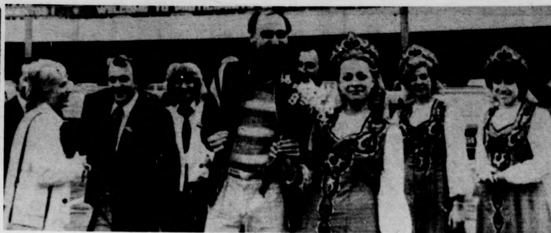
A XII. Világifjúsági és Diák Találkozóra érkezett magyar küldöttség néhány tagja Moszkvában, a seremetyeói repülőtéren.

A szabadtéri játékokon az idei nyáron összesen 14 előadást tartanak. A néptáncosok három előadása mellett háromszor kerül színre Mozart: A varázsfuvola című operája, hat alkalommal Kacsóh Pongrác—Victor Máté: János, a vitéz című popdallamjátéka, és kétszer a Szarvassá változott fiak című táncdráma a győri balettel és a Magyar Néphadrezeg művészegyüttesének közös produkciójaként.