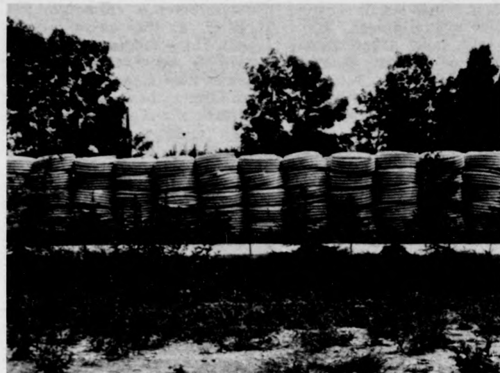
A térségi mellorációt nagymértékben megkönnyíti, hogy a TSZKER gyártja a drén-csőveket

műanyag csövek gyártása hat hónap alatt 100 millió forintot nagyságrendű volt, s ez is szerepet játszott abban, hogy a gazdasági tár-