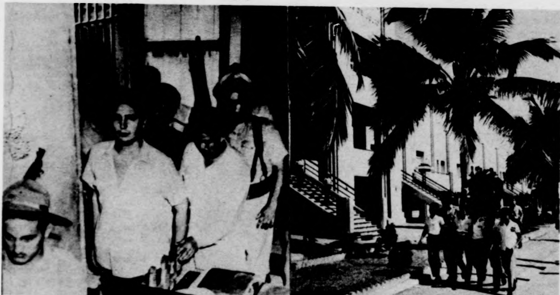
A sikertelen akció után bíróság elé vezetik a 26 éves Fidel Castrót (balról); az egykori lakotanyából kialakított iskola főépülete nap jainkban

Harminckét év, emberöltőnyi idő telt el azóta, hogy Fidel Castro Ruz fiatal ügyvéd vezetésével egy ifjakból álló fegyveres csoport megtámadta a gyűlölt Batista-rendszer jelképét, a Santiagó de Cuba-i Moncada lakotanyát. A maroknyi fiatal vállalkozása elbukott, de az akció következményeként a szigetországban felgyorsult a forradalmi erjedés folyamata. Pár évvel később a Granma nevű jacht fedélzetén — újból Fidel Castro vezetésével — fegyveresek szálltak partra, akik a nép támogatását élvezve győzelemre vitték José Martí szobrát.