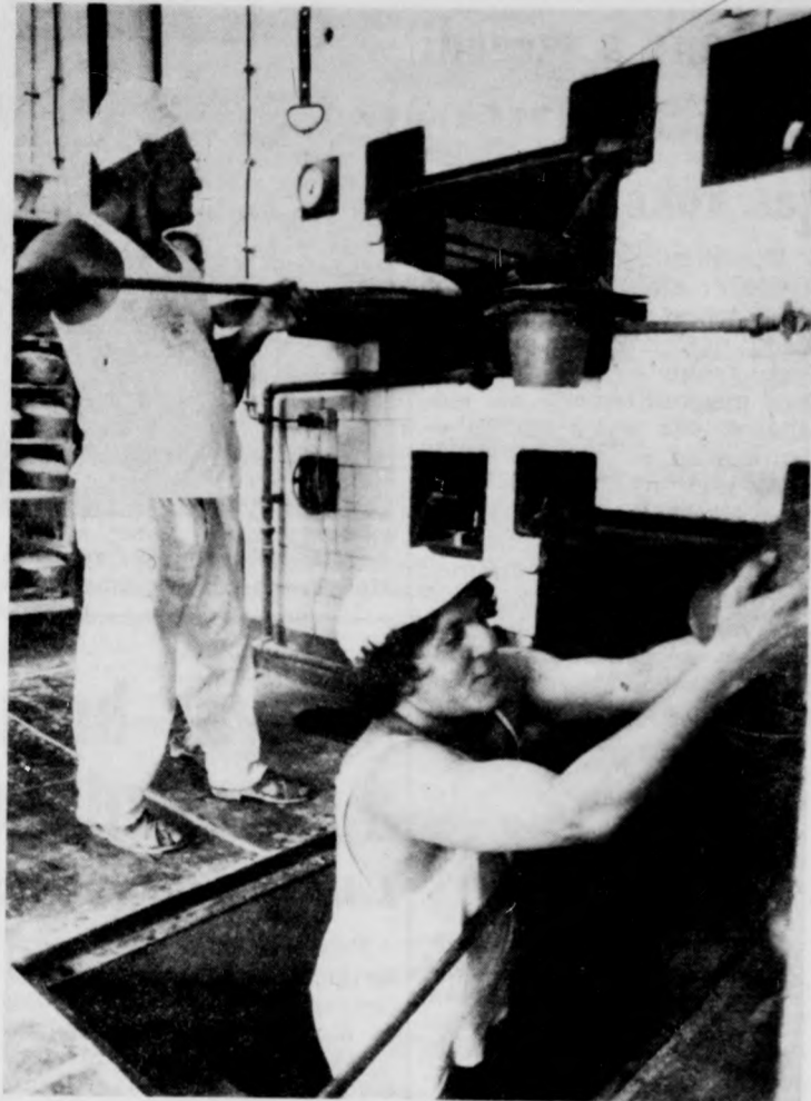
A kemence torkában — 50 fokos hőségben