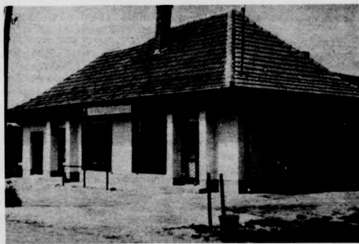
Megújult a körmődpusztai vegyesbolt

A szövetkezet viszonylag csekély mértékű forgalomnövekedésén belül a kiskereskedelmi üzletekben 3,58 százalékkal volt több a bevétel. A vendéglátó egységekben mindössze 1,55 százalékos volt a növekedés, míg az ipari tevékenység fejlődési útjére meghaladta a 18 százalékot. A forgalmi jelzőszámok mutatják, hogy ezen a téren a Komádi és Vidéke