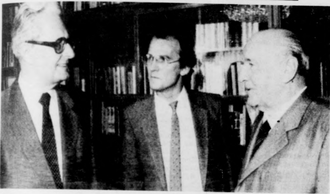
Kádár János, az MSZMP főtitkára fogadta Hans-Jochen Vogel, a Német Szociáldemokrata Párt (SPD) elnökhelyettesét, a párt parlamenti csoportjának elnökét