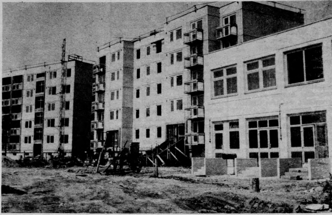
Képink a hajdúszoboszlói Szamely lakótelepen épülő házairól készült. A Hajdú megyei Állami Építőipari Vállalat 478 lakást épít itt, 178-át még ebben az évben át fogják adni