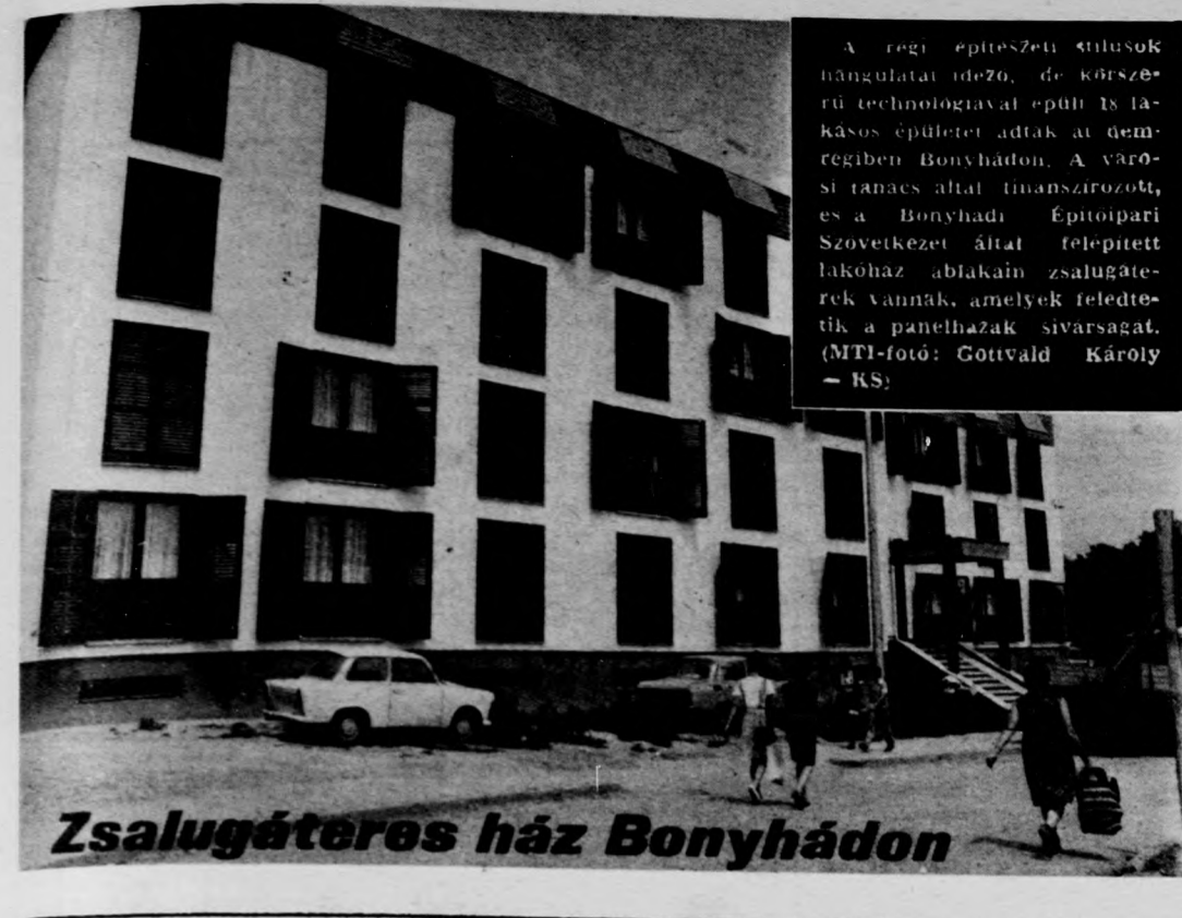
Zsalugáteres ház Bonyhádon

A bíróság ak közve- állítak. Am, indoklásá- zvetett bi- ha a vád- tanú nincs knak zárt otniuk, e csak olyan ők figye- z kétség z elvnek lta a Fő- zonyítéko- tta, hogy ások, ame- ttat a te- yékén lát- hatók. A n például ódott; ar- ú, aki a a temető- ádlottat, a em ismer- róság két- nak azt a hit a Mag- házkuta- nadragban bbiekben ésszakér- lott ruhá- rme, alatt armazó ta- ardványt, ak óság fel- az ügyész ügyben a hoz majd T)