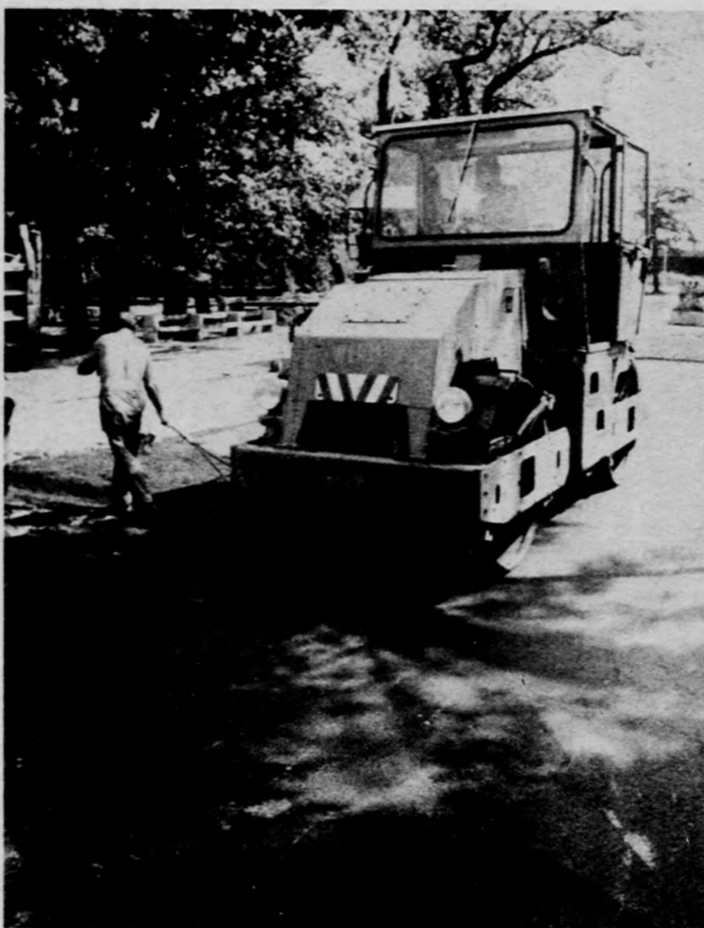
Aszfaltozzák a teret.

J elentős költséggel — ötmillió forint értékű munkával — korszerűsítette a debreceni Nagyerdő strand mögötti részét a Városgazdálkodási Vállalat. A legnagyobb nehézségeket a tó medrének megtisztítása jelentette, hiszen több mint ötezer köbméter iszapot kellett eltávolítani belőle. Újabb partműveket is építettek a helyenkénti medermélyítések mellett. Korszerű kandelaberek világítják meg az új sétányokat, melyeket a TITÁSZ dolgozói szereltek fel, új padok várják a pihenni vágyókat.