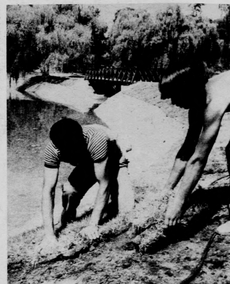
Gyepetglákkal burkolják a tópartot