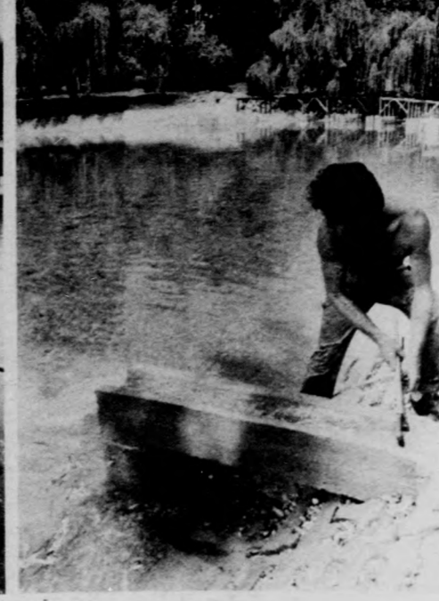
Ömlik a víz a tómederbe

J elentős költséggel — ötmillió forint értékű munkával — korszerűsítette a debreceni Nagyerdő strand mögötti részét a Városgazdálkodási Vállalat. A legnagyobb nehézségeket a tó medrének megtisztítása jelentette, hiszen több mint ötezer köbméter iszapot kellett eltávolítani belőle. Újabb partműveket is építettek a helyenkénti medermélyítések mellett. Korszerű kandelaberek világítják meg az új sétányokat, melyeket a TITÁSZ dolgozói szereltek fel, új padok várják a pihenni vágyókat.