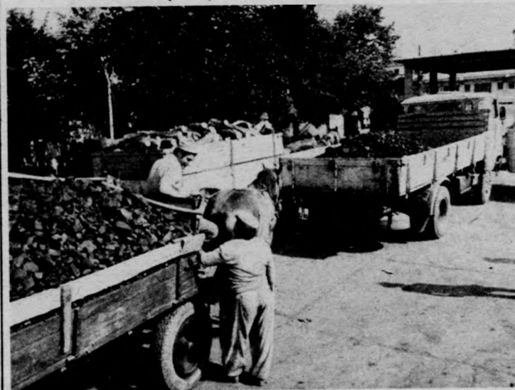
A szerencséseknek jutott az 5400 mázsanyi szerdai szénkészletből, a kevésbé szerencsések viszont sóvárogva néztek a Monostorpályi úti TÜZÉP-telepről kihajító fuvarosokat