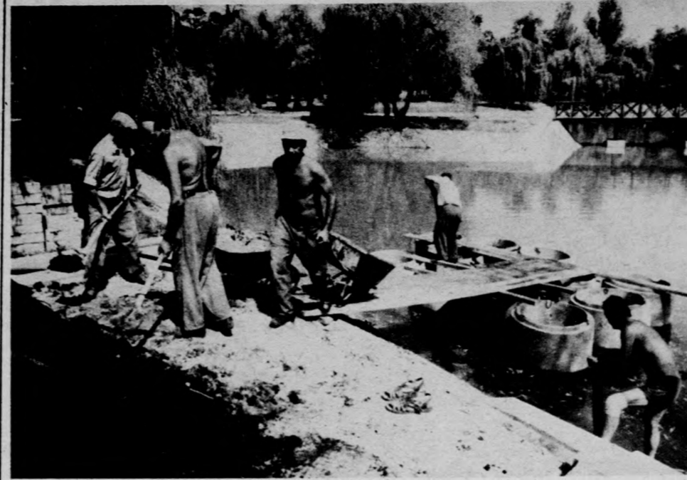
A beton kútgyűrűbe tavrózsák kerülnek