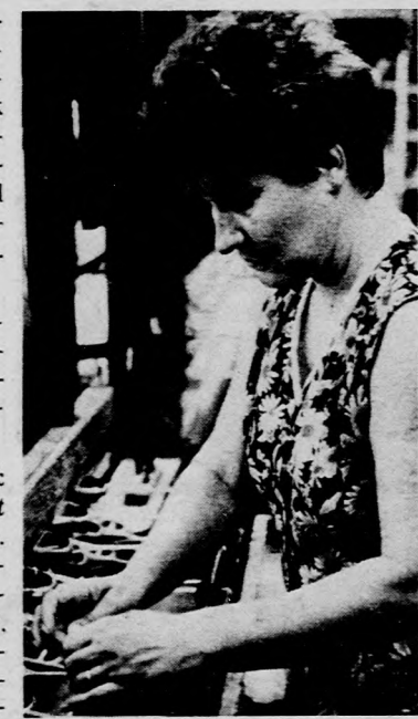
S minthogy egyváltalunk vagyunk, a gondolkodásunk is hasonló, ennyi év után meglehetősen összekovácsolódtunk.

— Hozzám hasonló „veteránok” a tagjai — nevet Juhász —, bár néhány fiatal is tartozik köztünk. Szerencsénk, hogy egy területen dolgozunk, így tudunk a másikkal segíteni, akár a munkában, akár az üzemben ki-