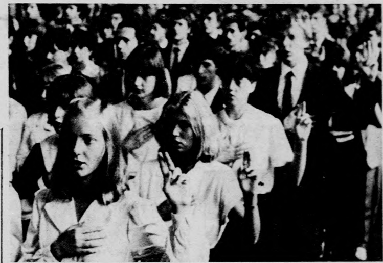
Az elsőövesek eskütétele