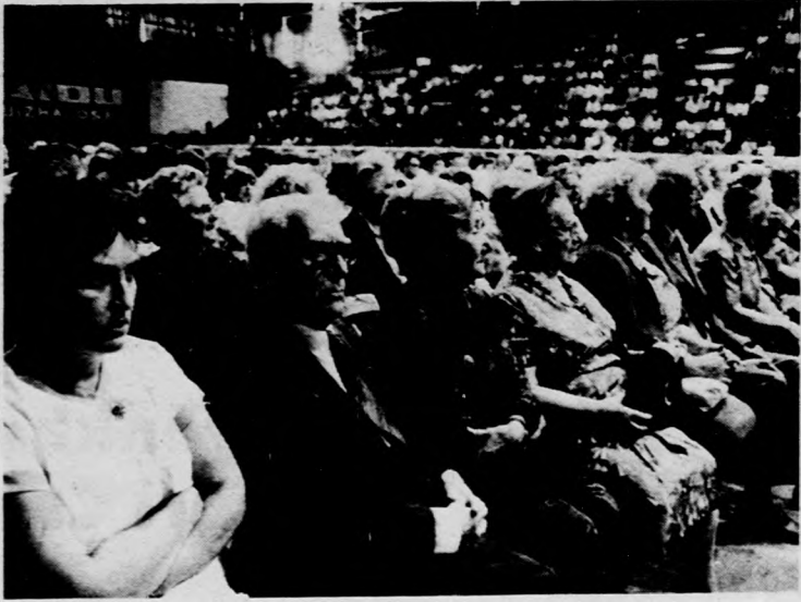
Az 50-60, sőt 70 évvel ezelőtt diplomázott tanítók az ünnepségen