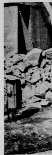
A polgári védő