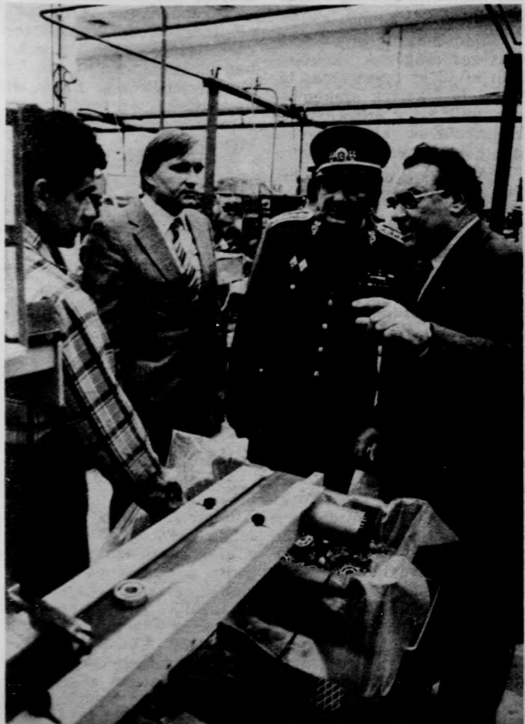
(Folytatás a 2. oldalon)