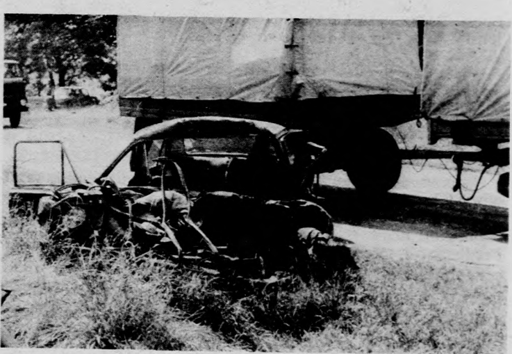
Hátborzongató látvány. A megyénkben történt balesetek közül a legtöbb tragédiát a figyelmetlenség (például a helytelen előzés, sávváltás és a kereszteződésekben való haladás), valamint az agresszív vezetési stílus okozza. „Rázós” napok az utakon a kedd és a péntek. Hétféteken legveszélyesebbek a nem hivatásos vezetők

Huszonhárom pályán. Komá-Keckemét tár-Debrecenbe. E