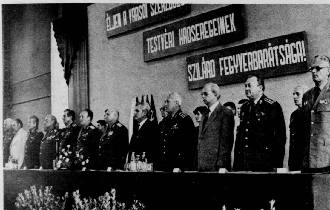
Nagygyűlés a Kossuth laktanyában — az elnökség a Himnuszt hallgatja