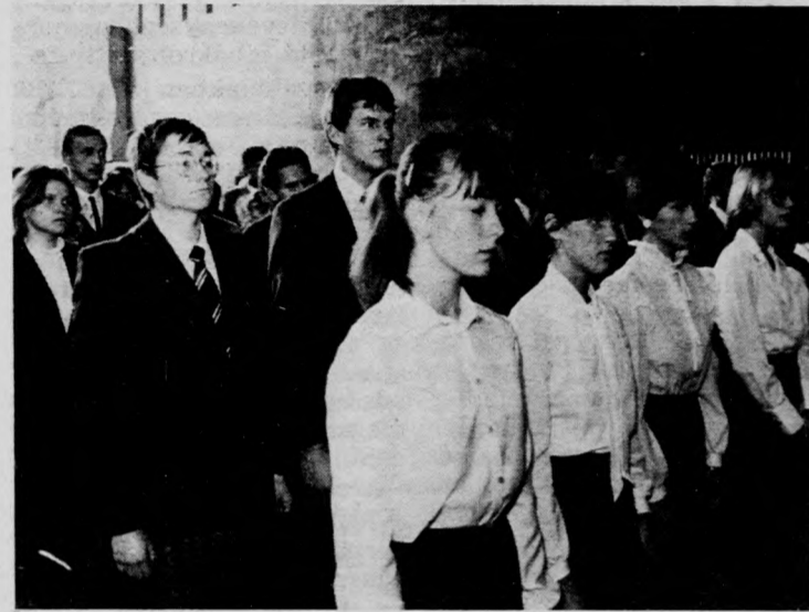
106 elsőéves tette le az esküt

Dr. Szász Gábor tanévnyitói beszédében megemlékezett a debreceni agrár felsőoktatás tradíciójáról, hangsúlyozta, hogy a föld szeretete, minőségének megőrzése mindig meghatározó szerepet játszott és játszik a képzésben. Az agrármérnöki munka megköveteli az alkotó-kreatív készséget, helyzet-felismerést, a megfelelő konstrukciót a különböző gazdasági helyzetben. Ebből adódóan az agrár felsőoktatás fejlesztése, az intézményhálozat korszerűsítése a legfontosabb feladatok egyike. Megnyugtató, hogy az Országos Terhivatal 1990-re az eddigi országos mezőgazdasági beiskolázási létszámot 1600-ról 1900-ra emeli fel. Ez biztosítja a mezőgazdaság számára a megfelelő mennyiségű és képzettségű értelmiségi réteget. Ezt követően az egyetem rektora szövege az agrár felsőoktatás koncepcionális és irányítási terveinek kidolgozásáról. A Debreceni Agrártudományi Egyetem a