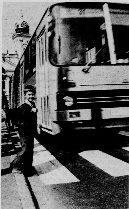
Fotóriporterünk a figyelmetlenség egy pillanatát kapta lencséjére. Ügyeljünk jobban gyermekeink önállóságára!

Gyermekeinkről van szó. Ezekben a napokban ismét benépesítik az óvodákat, iskolákat. De frissek még bennük az ünnepek, vidám, játékos hónapok, a szünidő emlékei. Ezért a szorgos, fegyelmezett hétköznapiokra áttérni nem könnyű feladat. Nekünk, felnőtteknek kell segítenünk, mert a baleseti veszélyhelyzetek ilyenkor — tanév kezdetén — még fokozottabbak. Sokan úgy vélik, hogy a gyermekek helyes közlekedésre nevelését az oktatási intézményeknek kell megoldaniuk. Ez csak részben igaz. Elsősorban a család szerepét kell hangsúlyoznunk. Ezen belül is legfontosabb: a szülő mutasson példát! Ami türelmet és megfelelő közlekedési kulturáltságot feltételez. Igen fontos, hogy a szülői példamutatás legyen erősebb, meggyőzőbb a gyermekét folyamatosan erő nemkívánatos közlekedési hatásokkal!