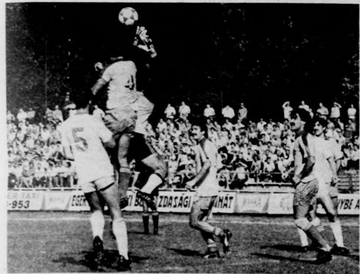
Munkában a tatabányai kapus

Szász a 62., Mohácsi a 83. percben. Szóletárny: 4:2 (3:1) a DMVSC javára.