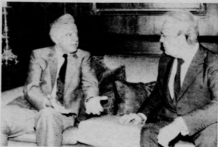
Az ENSZ 40. közgyűlése alkalmából New Yorkban tartózkodó Sevardnadze szovjet külügyminiszter találkozott a képen jobbról látható Perez de Cuellar ENSZ-főtitkárral