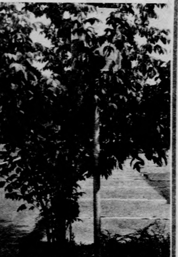
„BUJÓCSKA”. A fenti KRESZ-tábla a debreceni Ceglédi utca és Méliusz tér sarkán látható — illetve nem látható.

zonyítani, hogy a szerződést módosították, márpedig erre csak közös megegyezéssel van lehetőség. Tehát az eredeti szerződésben foglalt mennyiséget köteles volt átvenni. Szakértő meghallgatásával tisztázni kell, hogy az ÁFÉSZ az egyes hónapokra ütemezett tojásmennyiséggel rendelkezett-e. Ennek elbírálására, hogy az ÁFÉSZ-nél történt tojásmennyiségi változást a vállalat magatartása okozta-e, meg kell állapítani, hogy az ÁFÉSZ mikor, mennyi tojást vásárolt, azokat mikor kellett volna átadni, vagyis felvásárlási kötelezettségét összhangba hozni a szállítási kötelezettségével. Természetesen tisztázni kell azt is, hogy az ÁFÉSZ milyen tárolókapacitással rendelkezik, a felvásárláshoz hány nap szükséges, és a tojások — a tárolási körülményeket figyelembe véve — minőségüket meddig tudják megőrizni. Csak ezek ismeretében lehet állást foglalni, hogy a vállalat a mezőgazdasági termékértékesítési szerződést megszegte-e, és az emiatt keletkezett kárt köteles-e megtéríteni.