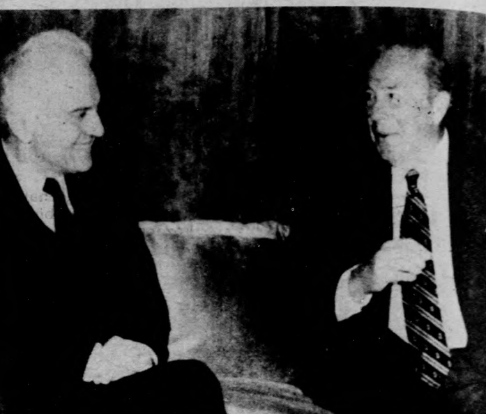
Szovjet-amerikai külügyminiszteri találkozó New Yorkban. A képen (balról) Eduard Sevardnadze és (jobbról) George Shultz

New Yorkban találkozót tartott Eduard Sevardnadze, az SZKP KB Politikai Bizottságának tagja, szovjet és George Shultz amerikai külügyminiszter. A találkozó a szovjet-amerikai kapcsolatokat, elsősorban a biztonságot érintő kérdéseket vitatták meg. A szóban forgó kérdéseket Mihail Gorbacsov, az SZKP KB főtitkára és Ronald Reagan amerikai elnök novemberre kitűzött találkozásának előkészítése szempontjából tekintették át.