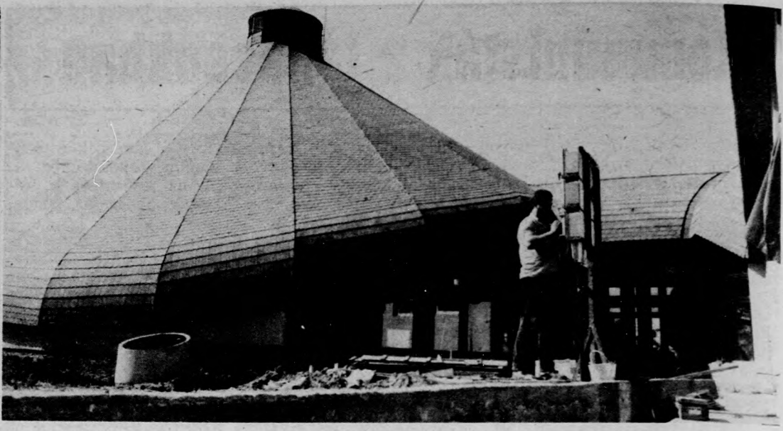
Termálfürdővel gazdagodik a Velencei-tó környéke. A Fejér megyei Tanács Építőipari Vállalat építi a 200 személyes fürdőt, melyet a későbbiekben még bővíteni is lehet. A hatvanmilliósi építkezéssel ebben a hónapban végeznek, majd a belső szakiipari munkák befejezése után birtokba vehetik a fürdőzők az új létesítményt