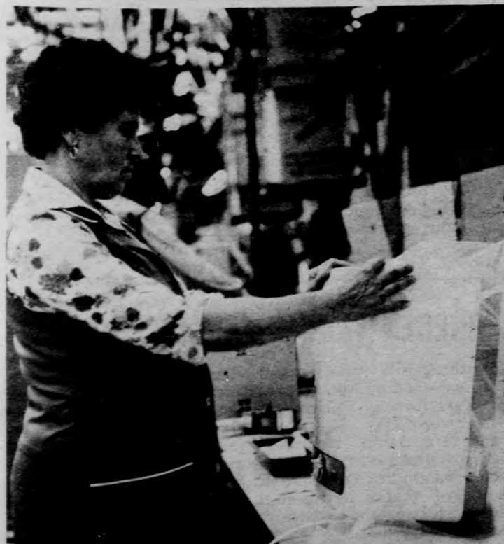
A kis hőtartalmú vízmelegítőik közül a csap alatt és a csap felett is elhelyezhető készülékeket egyaránt bemutatják a vásáron (Fotó: Kószeghy György)

Az iparművek az év negyedik negyedében állítják a növelt hőleadású konvektorlemezekkel ellátott lapradiátor gyártására. A műszaki újítás eredménye, hogy egysoros lapradiátoroknál 13-14 százalékos, kétsoros radiátoroknál 16-18 százalékos a fajlagos hőleadás növekedése, változatlan méret mellett.