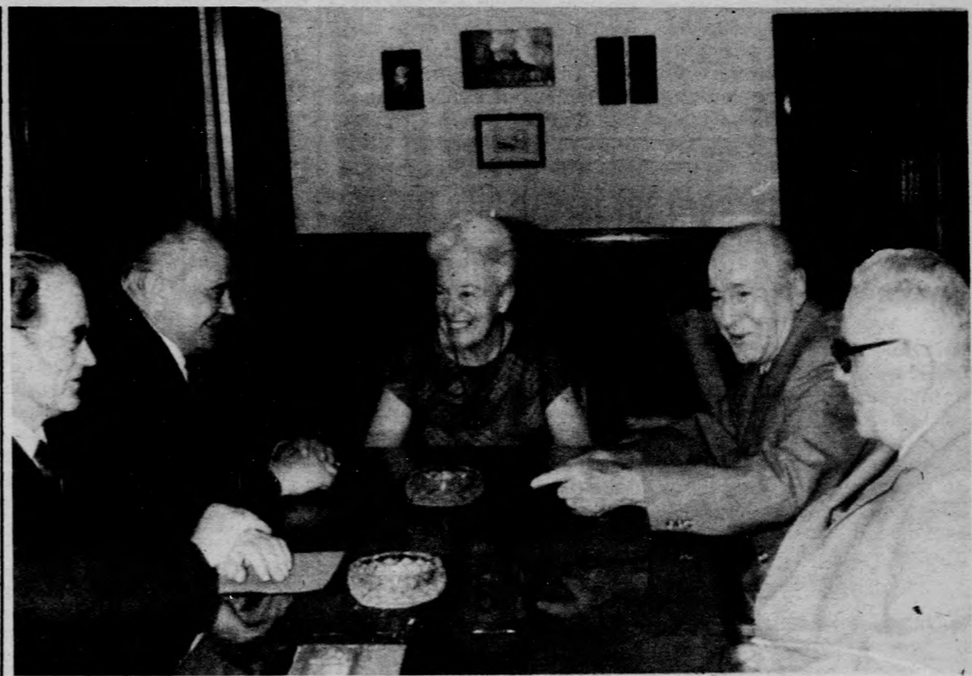
Kádár János fogadta Viktor Nyikonovot. A képen a találkozó résztvevői