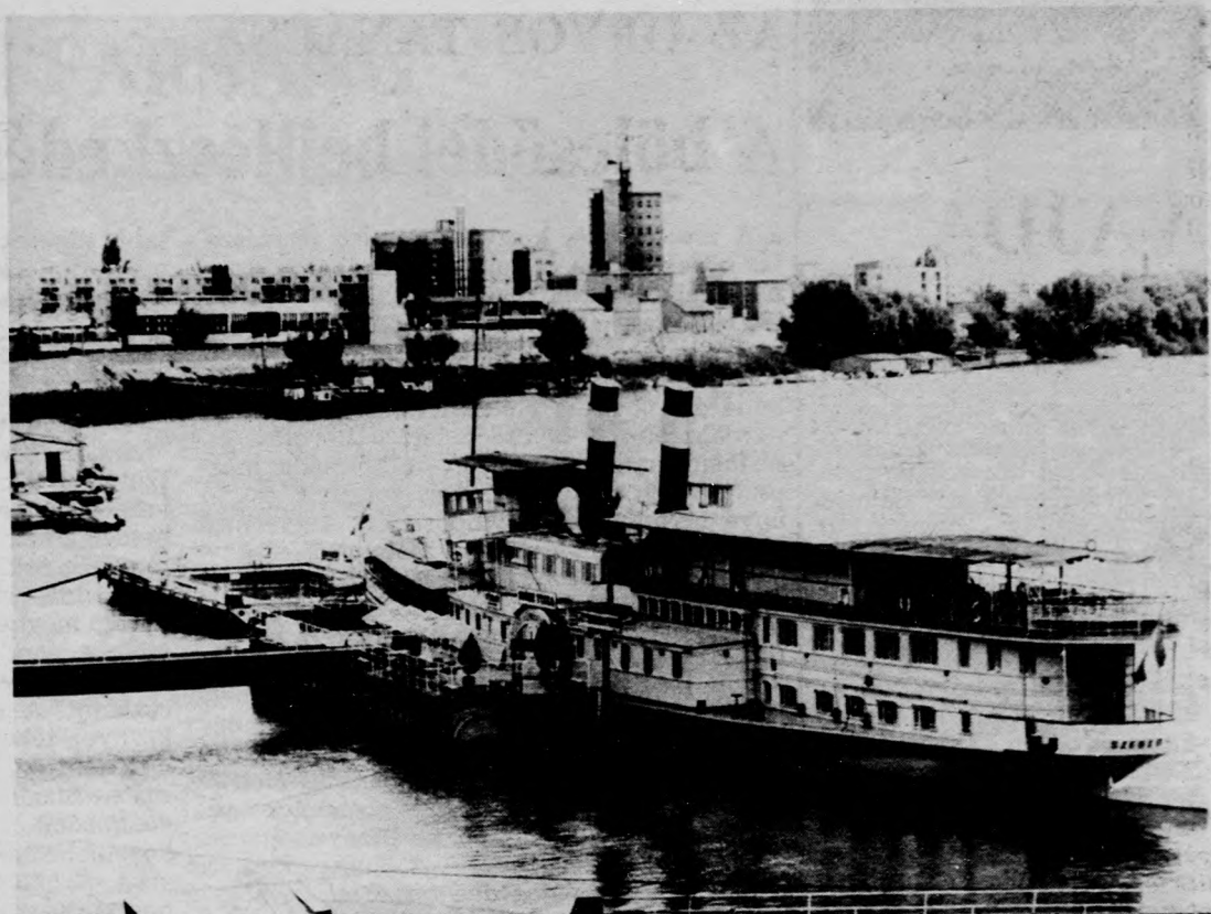
A Szegegnél már tekintélyesen kiszélesedő Tiszát láthatjuk, hátán a vendéglátásra berendezkedett Szőke Tisza hajóval (KS)

26. Kapcabetyár: Hitvány, megbízhatatlan, csak a nála gyengébbekkel erőszakoskodó, gáztatáinak következményeit