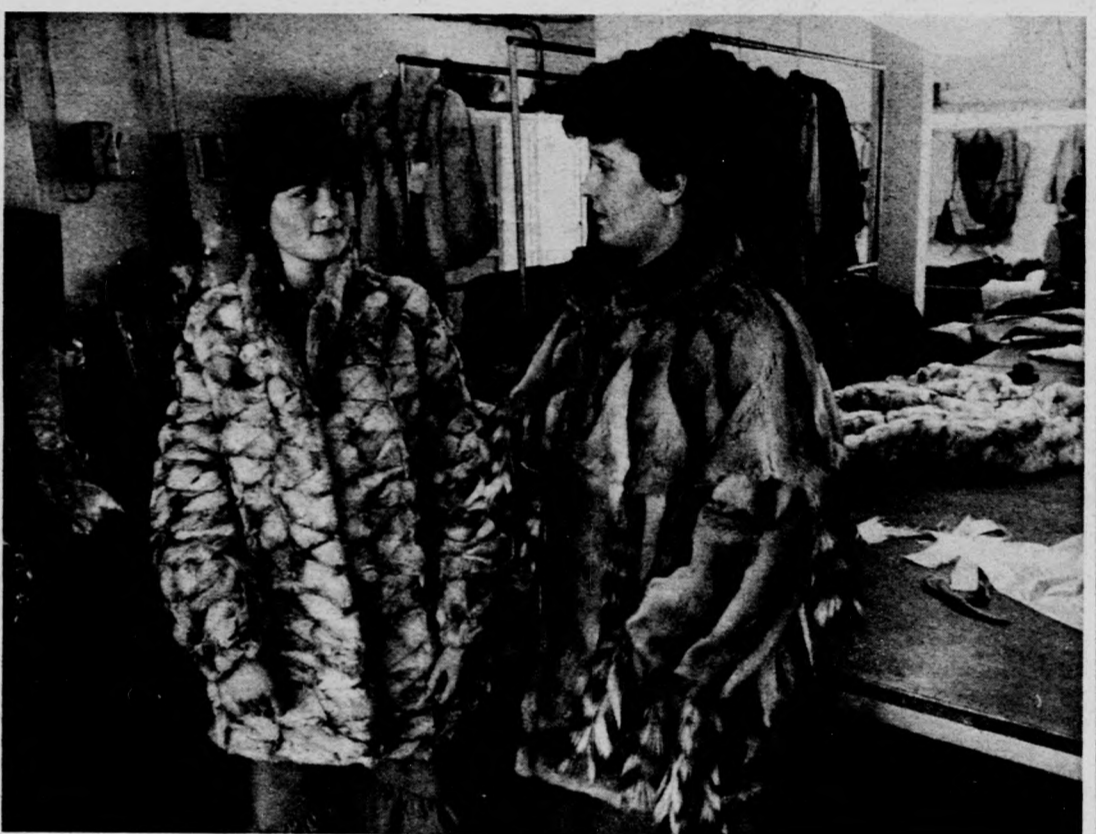
A zömében nőket foglalkoztató Minőségi Szűcs és Bőr Ruházati Kft. apci telepén készült ruhákat angol, francia, belga és holland hölgyek is viselik. Az elmúlt évben száztizmillió forint értékű árut állítottak

A fokozatos beszoktatással elérhetjük, hogy a gyermek könnyebben viseli el az átállás okozta megterhelést, és nem alakulnak ki a fejlődést hátráltató súlyosabb tünetek.