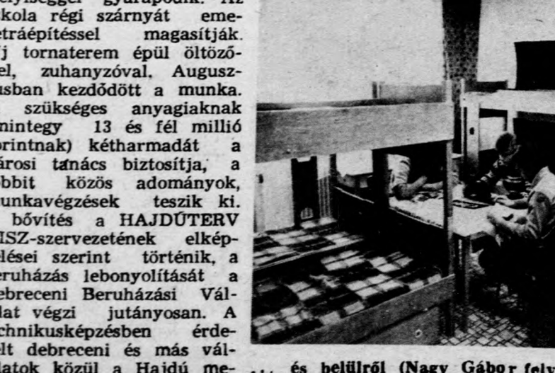
... és belülről

tejjepi tanulók kollégiumának épületét is, itt számára. A gyerekek több negyvenégy gyerek lakik. Korszerűsítették a fűtési-dalmi munkában a futópálya építésén, ok rostálták a salakot. Nagyobb gondot fordítanak majd a futópályára is, felboronálják fűmaggal kevert termőföldet terítnek rá, majd pezet területén levő műgolyókat elmozdítják, majd a hely — ahol a szakközépiskola diákjai gyarapítják ismereteiket — két és fél millió forint ráfordítással, szintén megújult, bővült, korszerűsödött. A Balasházy János Szakközépiskola pincejében zetek és a Kossuth lakta-három helyiségből álló klubot képeztek ki a diákok számára. A gyerekek több száz órát dolgoztak társadalmi munkában a futópálya építésén, ok rostálták a salakot. Nagyobb gondot fordítanak majd a futópályára is, felboronálják fűmaggal kevert termőföldet terítnek rá, majd pezet területén levő műgolyókat elmozdítják, majd a hely — ahol a szakközépiskola diákjai gyarapítják ismereteiket — két és fél millió forint ráfordítással, szintén megújult, bővült, korszerűsödött. A Balasházy János Szakközépiskola pincejében zetek és a Kossuth lakta-három helyiségből álló klub-