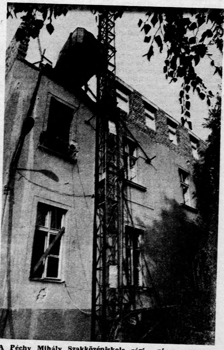
A Péchy Mihály Szakközépiskola régi szárnya magadódik

Az Irinyi János Szakközépiskola sütőipari tanulóinak diakothonát szeptemberben adták át, huszonnégy diák lakik itt. A Hajdú-Bihar megyei Sütőipari Vállalat újította fel az épületet 4,6 millió forint ráfordítással, ebből az összegből 1,6 millió forintot a Mezőgazdasági és Élelmiszerügyi Minisztérium biztosított. Azelőtt áldatlan körülmények között éltek itt a diákok. Felújították a