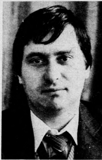
csak lehetőséget kell számára adni és igényt támasztani vele szemben.

— Látsz lehetőséget a gondok enyhítésére? — Elsősorban az kellene, hogy valamennyi munkahelyi vezető napi feladatai közül sorolja az ifjúságpolitikát. A fiatal mindent megtesz boldogulása érdekében,