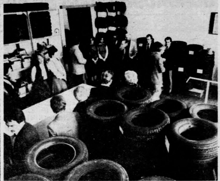
Több mint háromezer gumilabroncs van a raktárakban