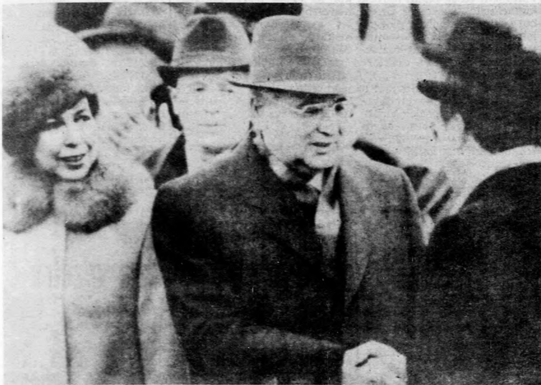
Mihail Gorbacsov Genfben. A képen: Kurt Furgler svájci elnök (háttal) köszönti a szovjet vezetőt és feleségét a svájci repülőtéren

A márkabolt 6 millió forint értékű készlettel nyitott. A TAURUS Gumiipari Vállalat vállalta, hogy az általa gyártott és forgalmazott termékekből rendszeresen ellátja az egységet. Így személygépkocsi-abroncsok, tömlők, műszaki gumiarúk, munkavédelmi kesztyűk és ragasztók teszik ki az árukészletet. Az elkezelések szerint jövőre 50 millió forintos forgalmat szeretnének lebonyolítani az üzletben.