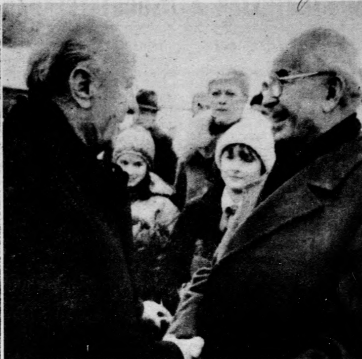
A csehszlovák vezetés meghívására Prágába érkezett Kádár János. Az MSZMP főtítkárat Gustáv Husák fogadta