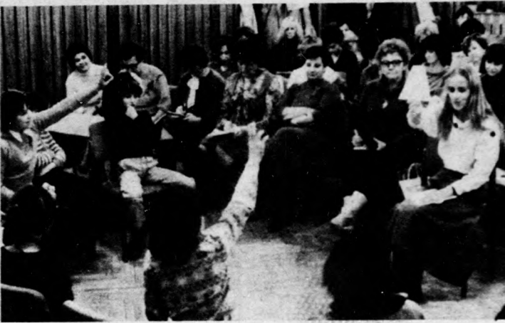
A Népművelési Intézet és a Kőlcsey Művelődési Központ november 20-21-22-én országos bábpedagógiai műhelyt rendez Debrecenben.

Művelődési és Alkotóházban november 22-24. között országos népi textilműves konferenciát rendeznek.