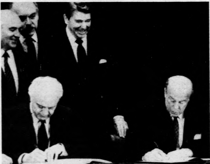
Befejeződött a szovjet-amerikai csúcstalálkozó. Eduard Sevardnadze szovjet, illetve George Shultz amerikai külügyminiszter együttműködési dokumentumot írt alá

— Öröndetes, hogy a Szovjetunió és az Egyesült Államok megállapodott abban: nem hagyják el Genfét záróokmány aláírása nélkül — mondotta többek között. — Biztosítani szeretném önöket, hogy támogatásunk és az az óhajunk, hogy elősegítsük az önk nemes munkáját, mindig el fogja kísérni önöket egymással való találkozóik, tárgyalásaik és munkájuk során — hangsú-