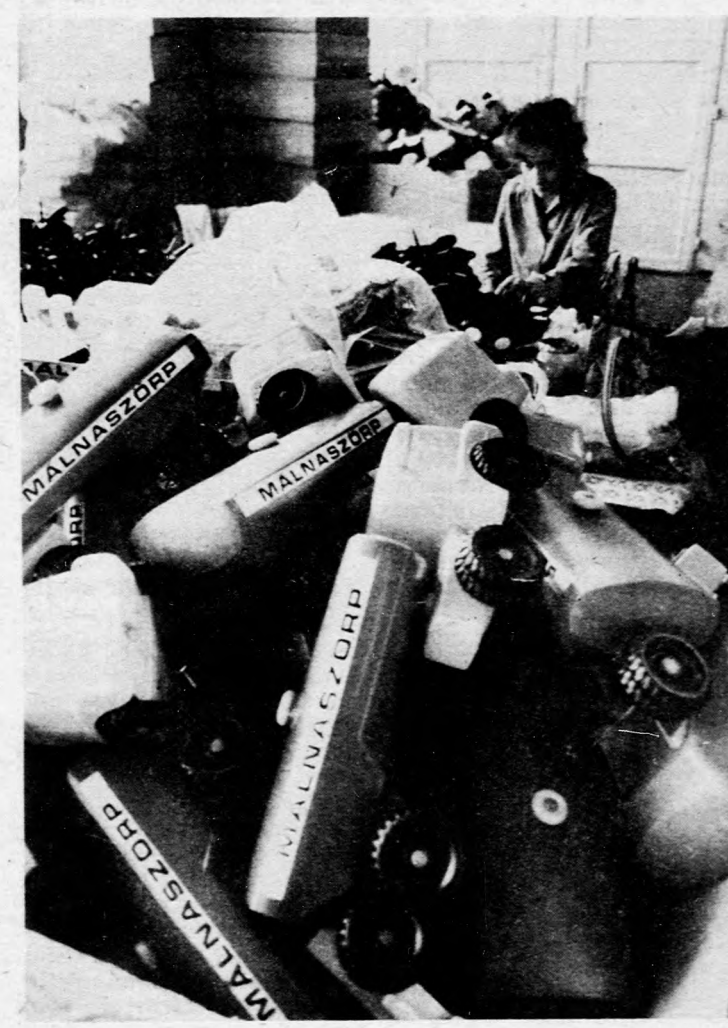
Játékokból egyre kevesebbet rendelnek

Hogy a nehéz helyzet megváltoztassák, a szakemberek igyekeztek a termék szerkezeten módosítani: a