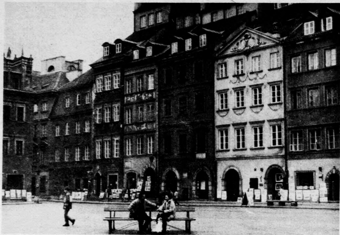
A varsói óváros tőtere