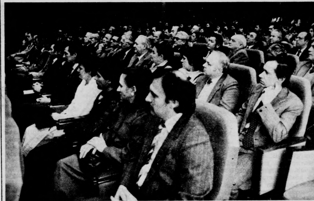
Az ankét résztvevői

Gyermek- és ifjúságvédelemről, napjaink egyik legégetőbb gondjairól esett szó az anketon, amelyre február 20-án került sor a Debreceni Akadémiai Bizottság székházában. Rendezői egyebek között arra vállalkoztak, hogy bemutassák a pedagógiával való együttműködés lehetőségeit a városban. A rendezés célja az országos Pedagógiai Intézet Gyermek- és ifjúságvédelem című elméleti és módszertani kiadványát. Különös tekintettel 1985/1-es számra, amely a több mint nyolcvan éves megyei Gyermek- és Ifjúságvédelmi Intézetet mutatja be, valamint a Hajdú-Biharban folyó családgondozási kísérlet tapasztalatait foglalja össze.