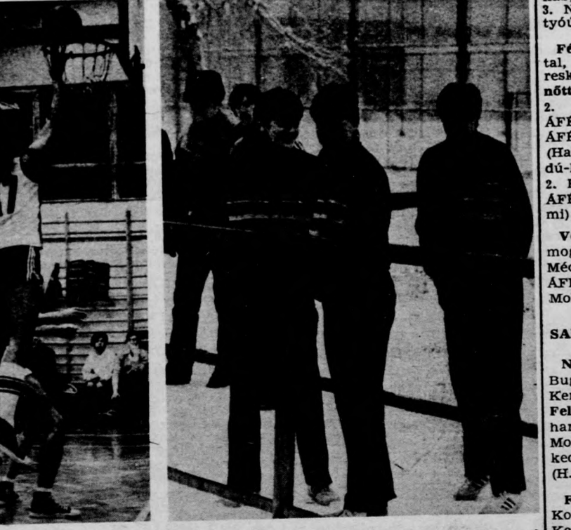
A Nyomatató utcai tornateremben végig izgalmas, érdekes küzdelemben nyertek a szomszéd vár kosarasai (Nyiregyházi Tanárképző—DUSE 82:79)