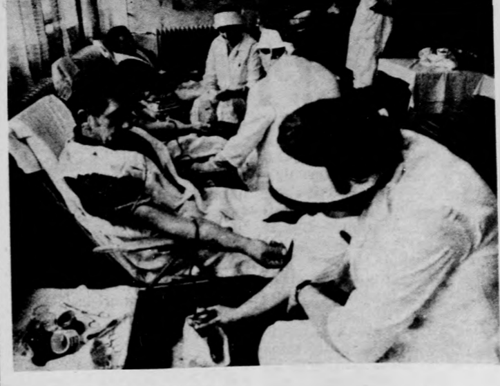
107 véradó 42 liter vért adott

a) A Magyarországon általában elfogadott bérletelési rendszerben igazi néző van, de egyetlen igazi közönség sincs. Igazi néző az, aki a tizenháromezer bérlet között megismeri a színházunkat, a jelenlévő, valamint az, aki a pénztárnál jegyet vált, vagy a tikárságon ingyen belépet kap. A bérletelési gyakorlata úgy alakult, hogy esteről estére viszonylag homogén összetételű közönség ül a nézőtéren (például vegyesek, egyetemisták, gimnaziumi tanulók, termelőszövetkezeti nyugdíjasok stb.). Mi úgy gondoljuk, a premier közönsége egyike az ilyen, valamilyen szempontból homogén rételekből álló közönségeknek. Specifikuma az, hogy tagjai többnyire megkülönböztetett társadalmi és gazdasági helyzetűek, s ezért megkülönböztetett társadalmi és gazdasági helyzetűek, s ezért megkülönböztetett társadalmi és gazdasági helyzetűek, s ezért megkülönböztetett társadalmi és gazdasági helyzetűek.