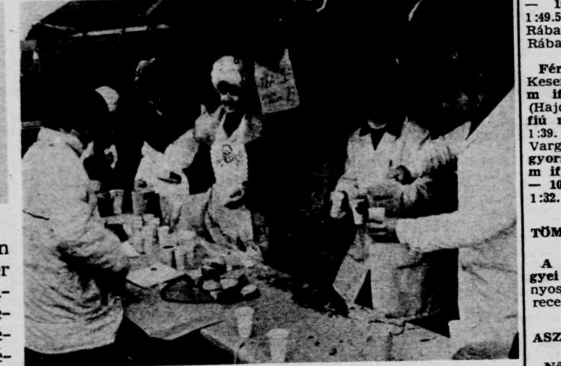
A szombati jégkarnevalon jölesett a résztvevőknek a melegen forró tea és a zsíros kenyér

Az elmúlt hét végén Nagy Gábor fotóriporter járta végig a sportpályákat, -csarnokokat Debrecenben. Több helyen készített felvételt, különféle sportágakban földkeket örökített meg a filmkockákon.