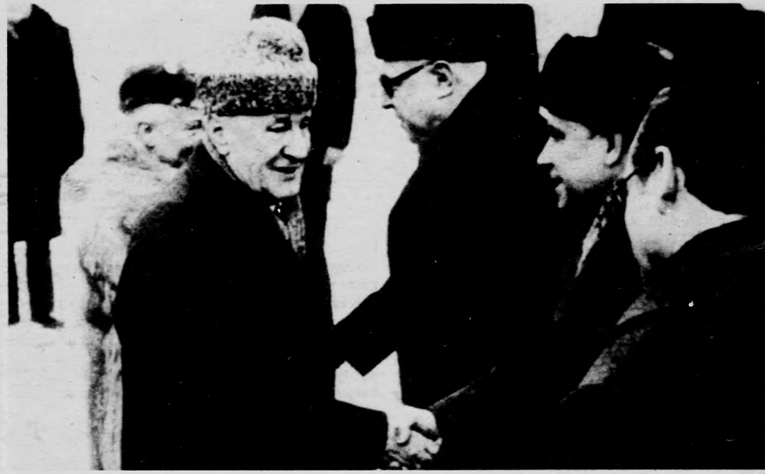
Kádár Jánost köszönti Borisz Scserbina, középen Viktor Csebrikov

A küldöttség búcsúztatására a Ferihegyi repülőtéren megjelent Németh Károly, az MSZMP főtitkár-helyettese, Havasi Ferenc, a Központi Bizottság titkára, Ovári Miklós, a Központi Bizottság titkára, Maróthy László, a Minisztertanács elnökhelyettese, a Politikai Bizottság tagjai; Berecz János, Horváth István, Pál Lénárd, a Központi Bizottság titkárjai, Kamara János belügy- és Várkonyi Péter külügyminiszter, a KB tag-