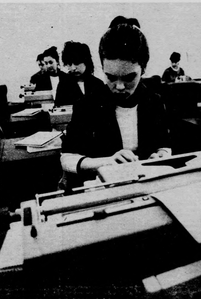
A gépteremben megkezdték a villanyfridgek elhelyezését, néhányan már ezen gyakorolnak

A rekonstrukció munkái tovább tartottak a tervezettnél. Ennek elsősorban az az oka, hogy nemcsak az eredetileg tervezett födémcsérelt és a közfalak átépítését végezték el, hanem korszerűsítették a fűtést, világítást. Az épületben ma már központi fűtés van, az udvaron elhelyezett gázkazán biztosítja az energiát. Kicsérítették a villanyvezetékét, és így lehetővé vált, hogy a gépteremben villanyfridgeket helyezzenek el és azon tanuljanak a diákok. Bővült az udvar és még kialakítanak egy csoportos foglalkozásra alkalmas kis termet is az udvaron. A munkákra 4 millió 100 ezer