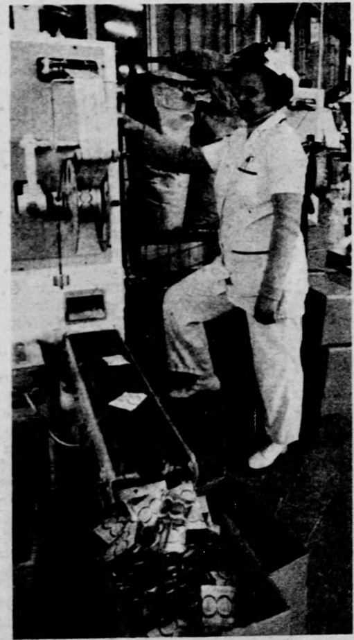
A presszóknban is közkedvelt a kis csomagolású tejpor