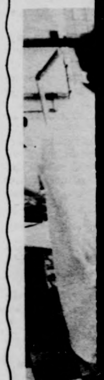
Vaj — 1

Régen v jó harmin felépült és tett Beret dettporgyár, tak rá nem