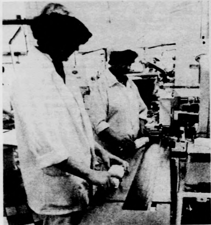
Vaj — 10 dekagrammos csomagolásban

Régen volt már az — emberek, hanem mások jó harminc éve —, hogy is. Úgy is emlegették akfeléül és dolgozni kez- kor ezt az üzemet: Kő- detti Berettyóújfaluban a zép-Európa legkorszerűbb tejgyárát. Büszkéek vol- tejfeldolgozó üzemek. tak rá nemcsak az ott élő Pedig akkor még csak