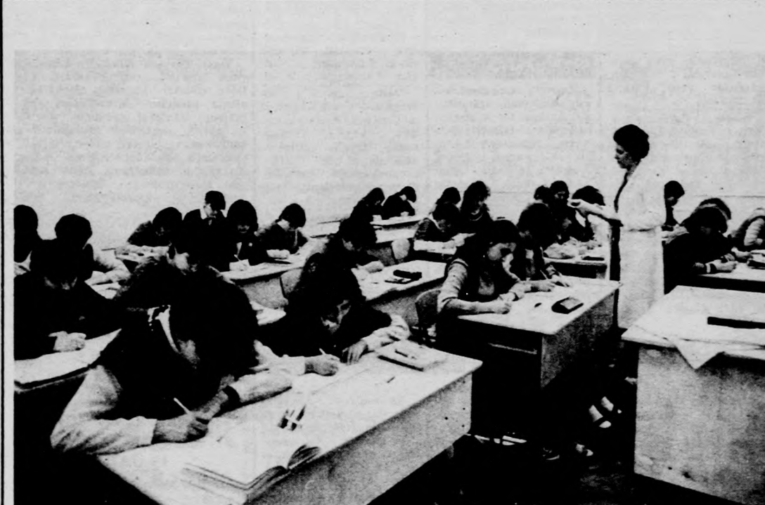
Gyorsírásra az iskola egyik felújított szép és tágas tantermében