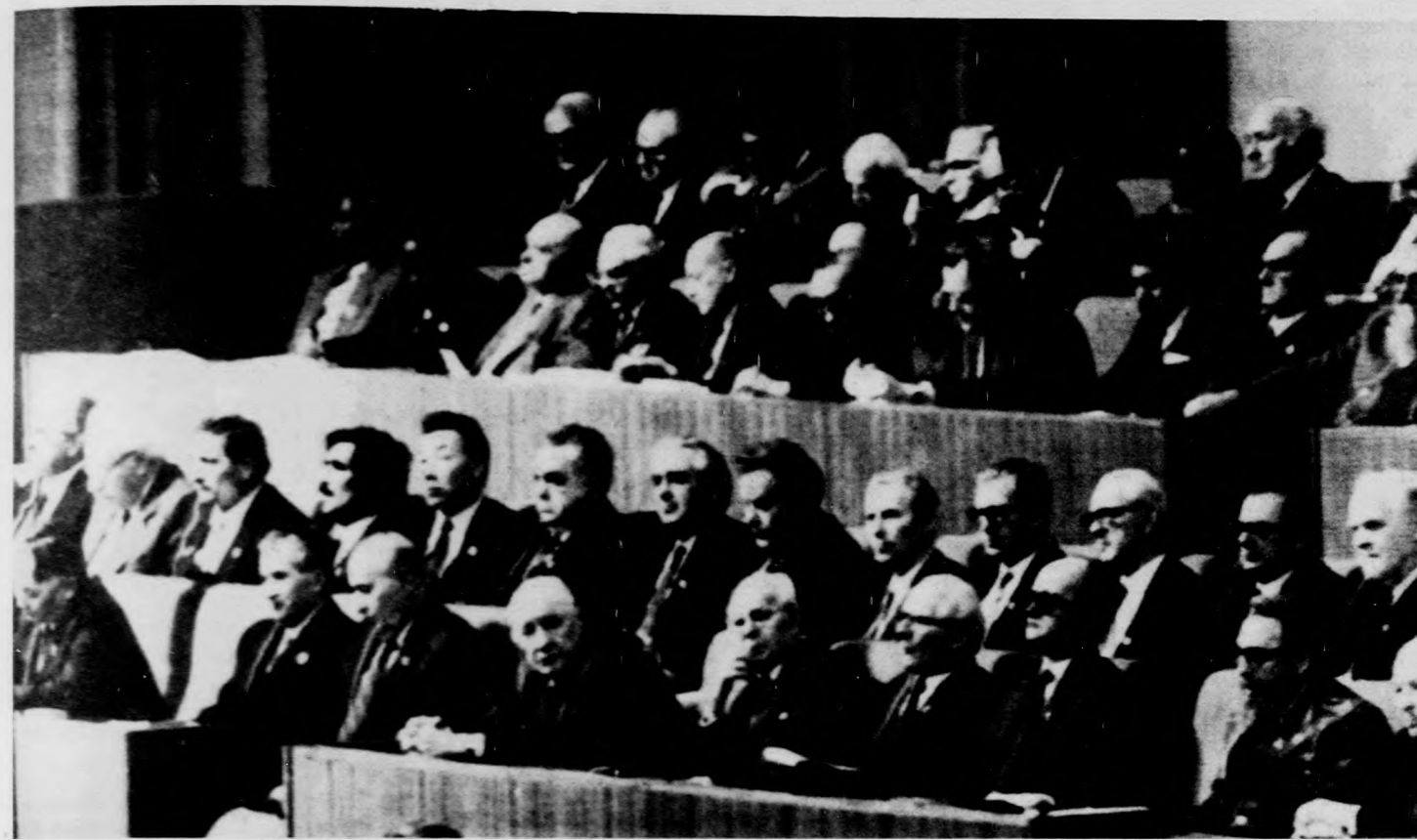
A külföldi delegációk vezetői a kongresszus elnökségében