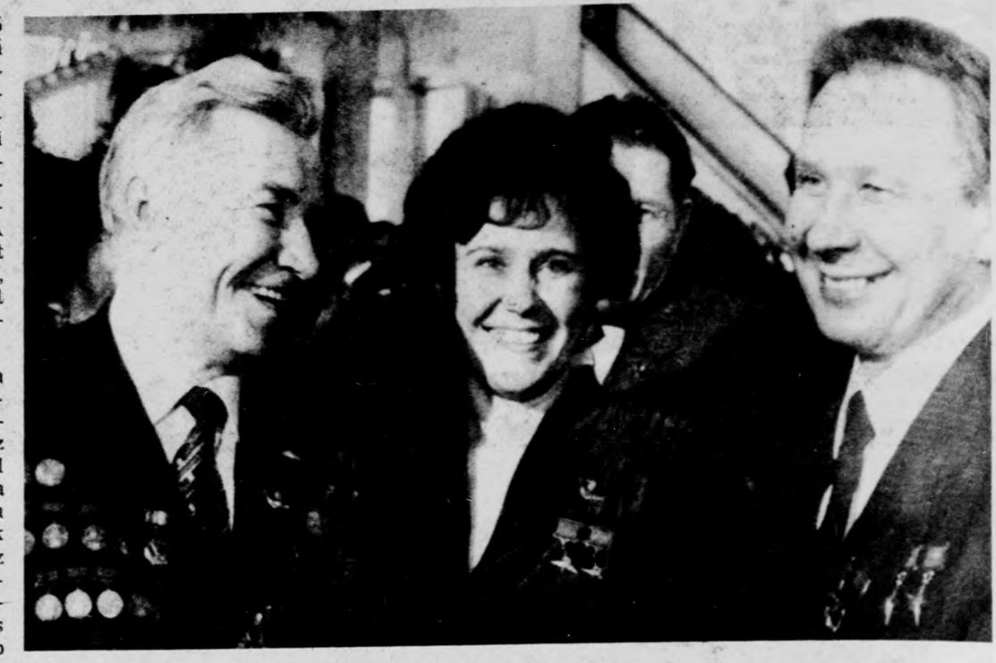
Küldöttek a tanácskozás szünetében

Mihail Szabardnya automatizálási és műszeripari miniszter arról számolt be a kongresszus nyilvánosságára előt, hogy a most lezárult 5 éves időszakban a szovjet számítógépipar termelése 40 százalékkal nőtt. A mostani 5 éves tervben az ágazat iránt megkülönböztetett állami érdeklődés nyilvánul meg, s ez reálissá teszi a tervezett 70 százalékos további termelésnövekedést.