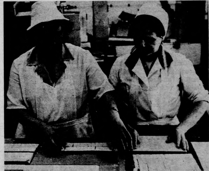
Csomagolás előtt a nápolyi

Az ez évi küzdelem még be sem fejeződött, de már megjelent a jövő évi felhívás, és ez gazdag, széles körű köznevelődési programot kínál az ismételtene bevezető és az először induló brigádoknak.