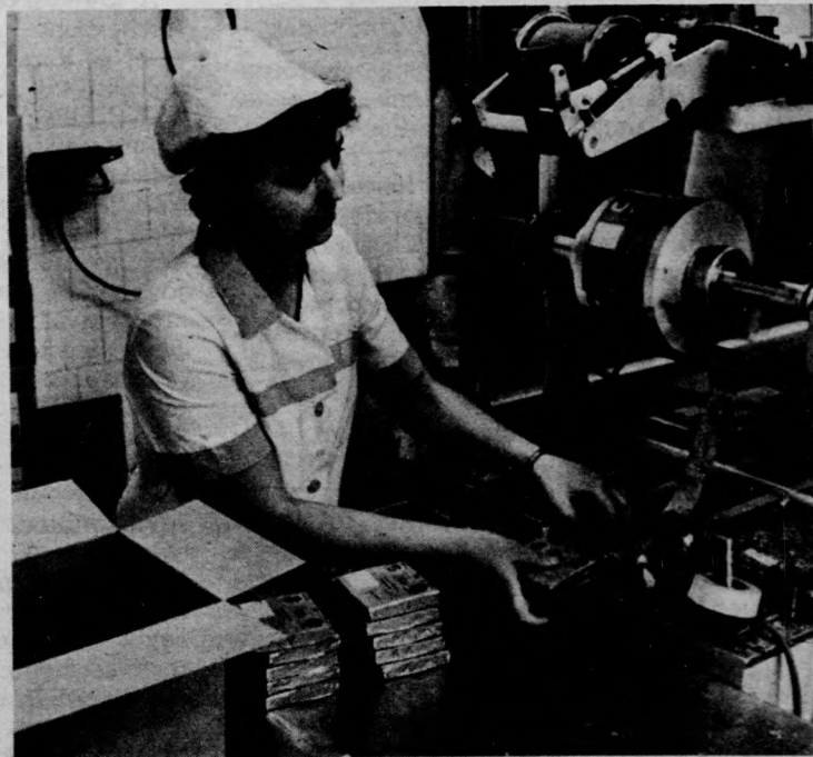
A francia csomagológép működés közben