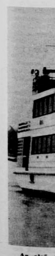
Az első S... ünnepélyessé