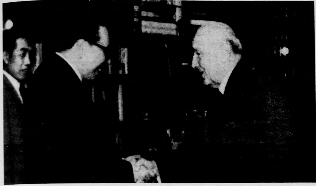
Kádár János fogadta Vu Hszüe-csien kínai külügyminisztert