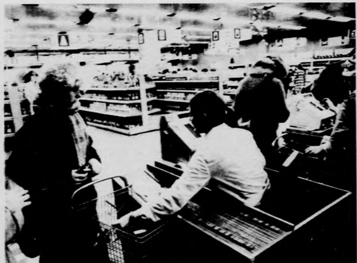
Nemrég átadott ABC-áruházOpolében

Mindéhez hozzátesszi: ha kissé drágábban is, időnként jegy nélkül kapható csirke. Az ellátást jótékonyan segíti az a rendelkezés, amely lehetővé tette a parasztnak a szabadpiaci értékesítést. Meg aztán, egy kis találeményességért a lengyel ember sem megy a szomszédokba. Egyre több a nagy befogadóképességű hűtőgépműlyhűtő a háztartásokban. A piacon vagy egyéb helyeken megvesz valaki tíz vagy tizenöt kiló húst, aztán egy darabig nincs gondja.