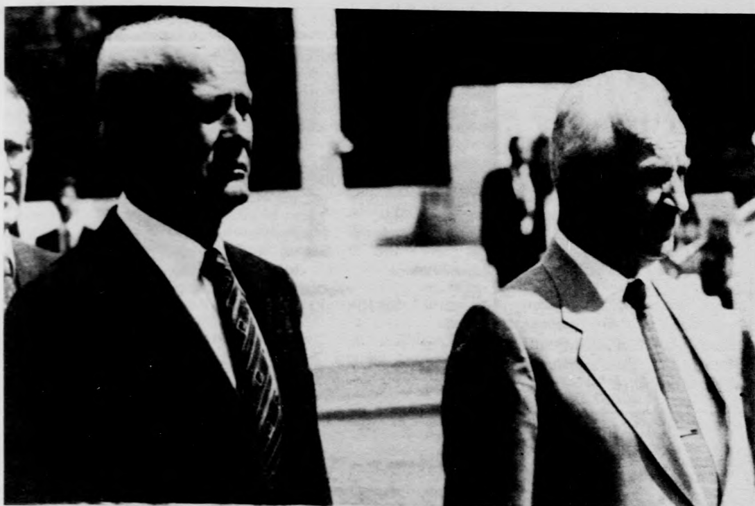
Losonczi Pál és Kenan Evren a Kossuth téri fogadtatáson

Losonczi Pálnak, a Magyar Népköztársaság Elnöki Tanácsa elnökének meghívására kedden hivatalos látogatásra hazánkba érkezett Kenan Evren, a Török Köztársaság elnöke.