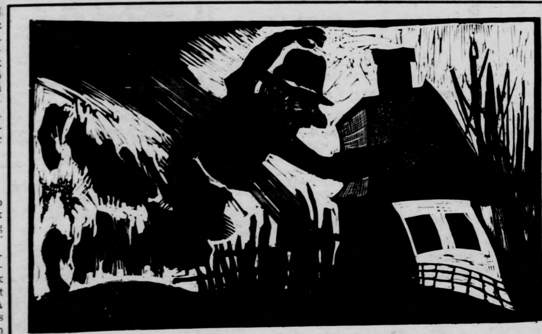
GONDA ZOLTÁN: A MÚLT ÁRNYÉKA (LINÓ)

Június 23-án kezdődött és július 1-ig tart a megyei néptánctábor Hajdúszórnán. A gyerekek részére hirdett táborban delalföldi, del-dunántúli, palóc és széki táncokkal ismerkednek meg a résztvevők.