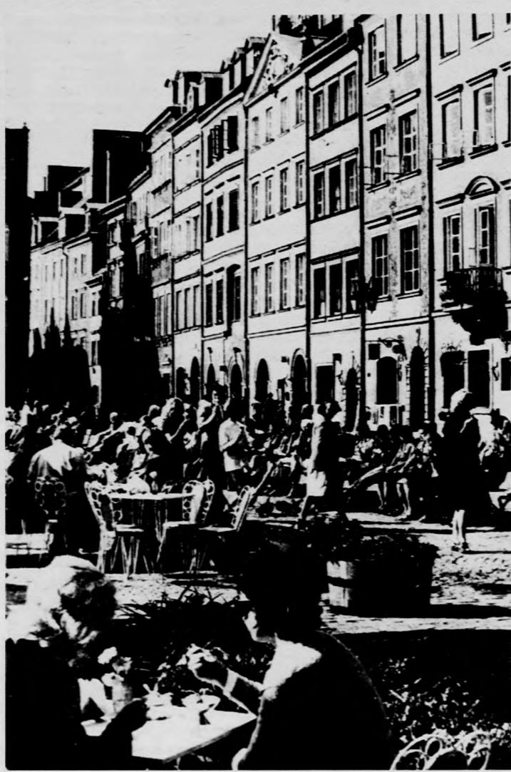
Kávézók a varsói Óváros piacterén

Még valami az első benyomásból: sehol annyi szép és annyira olcsó virág, mint Varsóban. A június első hetében kiváltképpen elszemtelenedő hazai virágmaffiákra gondolok másnap, amikor a hetvenhektáros Lazsenki parkban basabasabasa-felkiáltással egy mokusokat kézből etető fiatalasszony ezt mondja: a varsóiak kiváltképpen szeretik a virágot. A káprázatosan