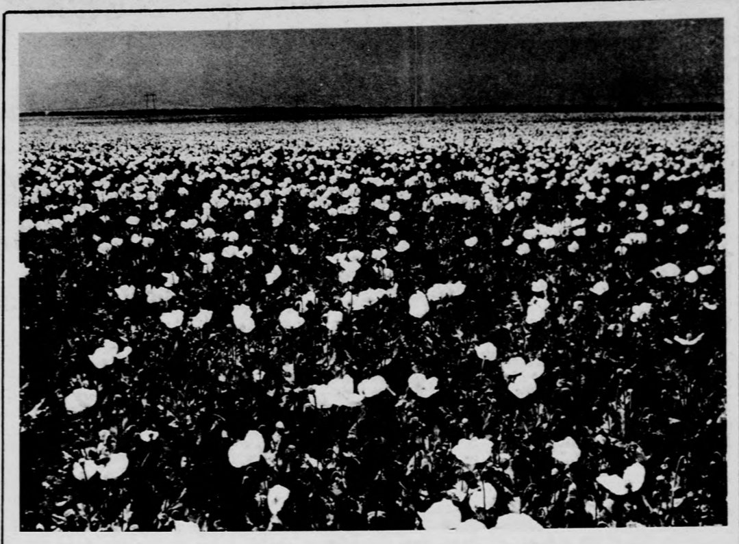
VIRÁGZIK A MÁK A BÖSZÖRMÉNYI HATÁRBAN