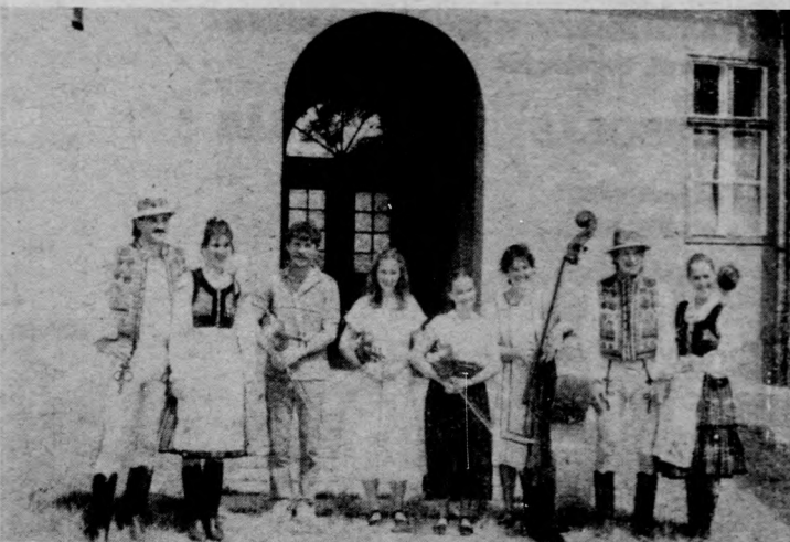
Ök utaztak a gochi fesztiválra. Középen a Hajdina együttes négy zenésze