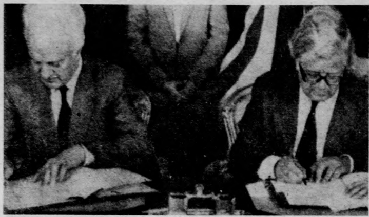
Eduard Sevardnadze szovjet (balról) és Sir Geoffrey Howe brit külügyminiszter fontos megállapodásokat írt alá Londonban. Sevardnadze szerdán elutazott a brit fővárosból (Telefotó — AP — MTI — KS)

Küszöbön áll a hat éve megszakadt szovjet-amerikai tárgyalások felújítása az atomfegyver-kísérletek átfogó betiltásáról — közölte Eduard Sevardnadze szovjet külügyminiszter hazautazása előtt szerdán a londoni szovjet nagykövetségen tartott sajtóértekezletén. A szovjet diplomácia vezetője összegezte kétnapos hivatalos látogatásának eredményeit, és kérdésekre válaszolt. Tárgyalási eredményeiről elégedetten nyilatkozott, s örömet fejezte ki, hogy a brit kormányfő és a külügyminiszter elfogadta a hivatalos moszkvai látogatásra szóló meghívást.