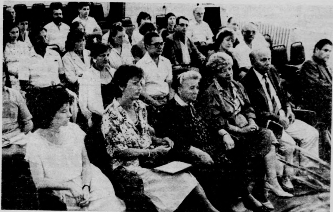
A tanfolyam résztvevői