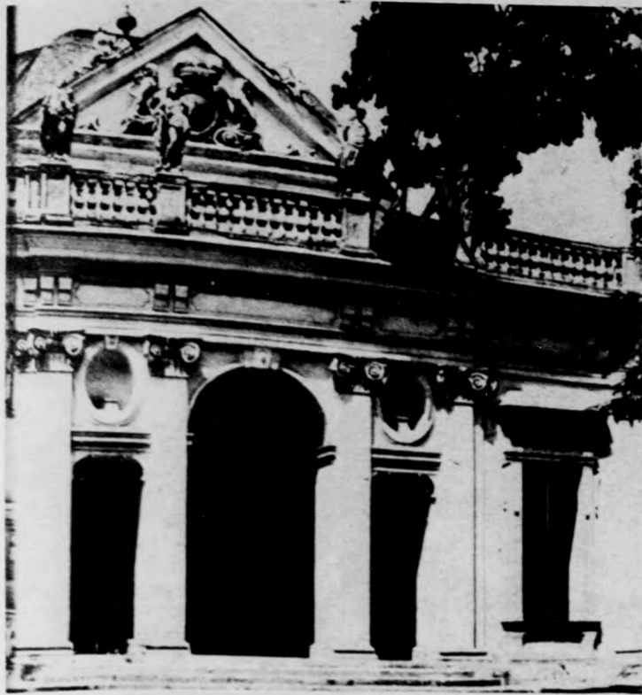
A volt Savoyai-kastély bejárata