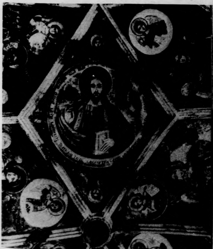
A görögkeleti szerb templom freskó részlete