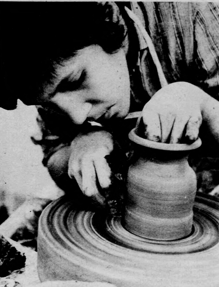
Korongozás — puha agyagból alakul a forma

A májusban alakult negyventagú öntevékeny csoportnak már voltak kiállításai, s a további sikerek érdekében alkotótábor terveznek a Hármashegyre.