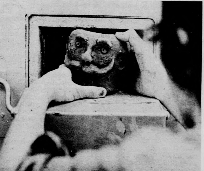
A képlékeny anyag a kemencében válik maradandóvá