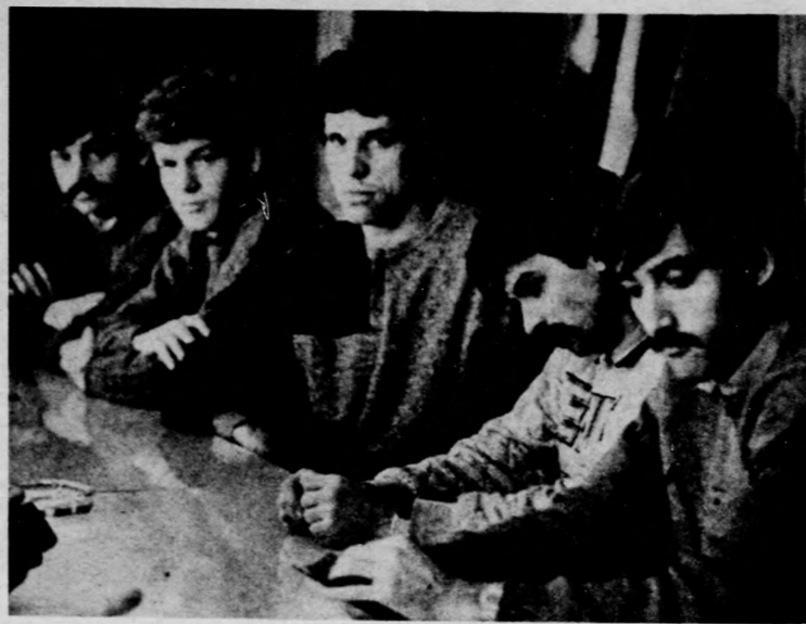
A DMVSC labdarugóinak egy csoportja a hétfői találkozó

Hétfőn délután sportorvosnál voltak a labdarugók, majd edzést tartottak. Kedden már két foglalkozást tartanak, az egyiket délelőtt 10 órától a szabadban, a másikat pedig 17 órától a teremben. Szerdán és csütörtökön csak délelőtt lesznek edzések, míg pénteken ismét két foglalkozást tartanak. Szombaton délelőtt is lesz edzés. Január 2-től 21-ig a labdarugócsapat szálláshelye Hajdúszo-