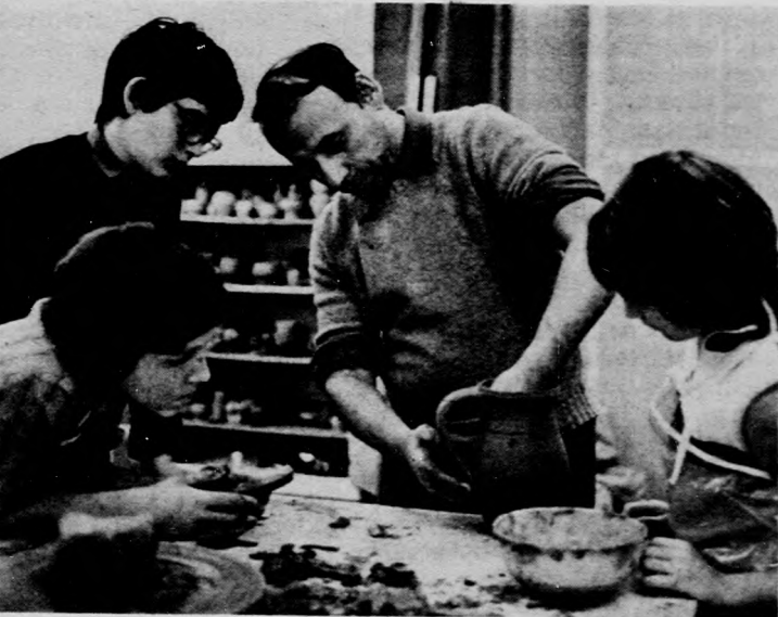
Fülezés, azaz: így kerül a köcsögre a fül