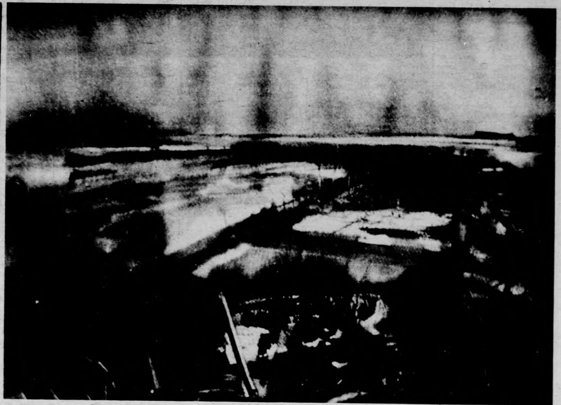
MADARÁSZ GYULA: OLVADÁS