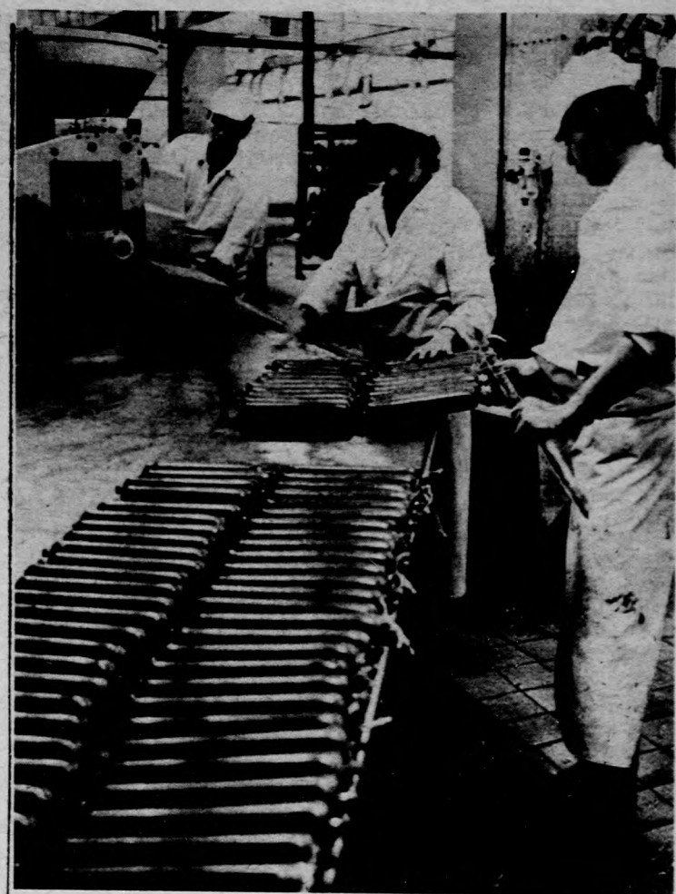
Budapestnek is szállítottak

Az ülésen elfogadták a végrehajtó bizottság 1987-88. évi munkatervét, továbbá megtárgyalták a többoldalú együttműködés folyó