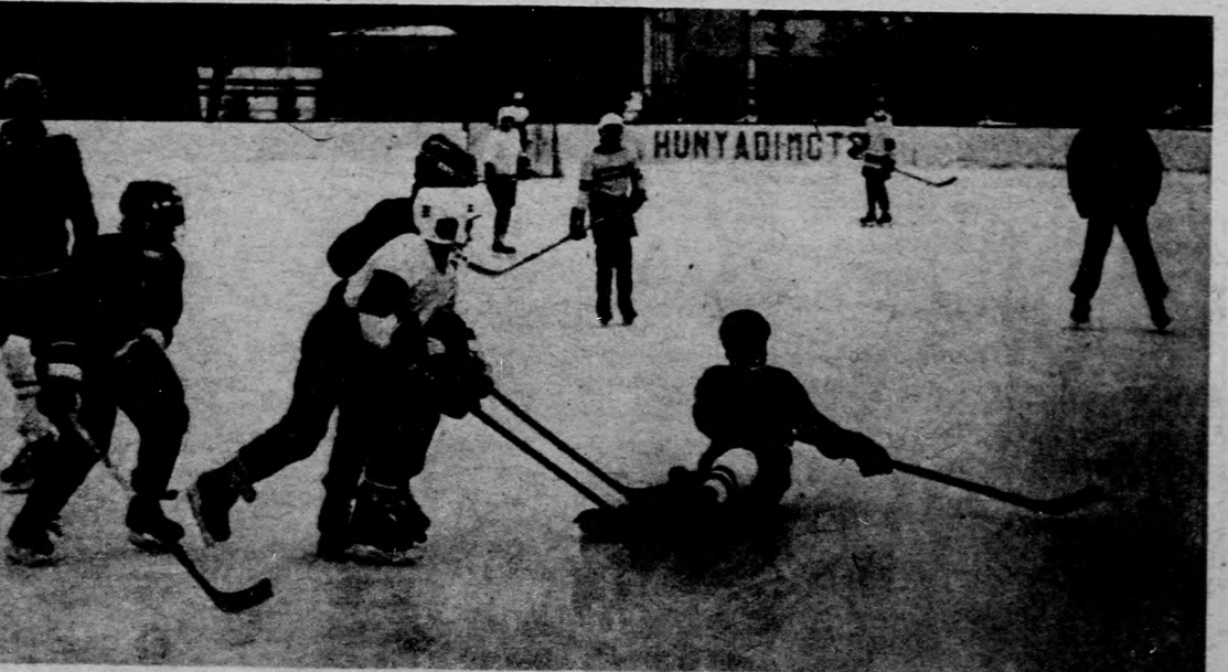
Az úttörők jégkorong-bajnoki mérkőzésén Csapóker—TK Gyakorló Általános Iskola 2-0

A holtidény csak vaklármá. Nyugodtan ezt mondhatjuk, hiszen január közepén is bőven rendeznek sporteseményeket Debrecen pályáin és termében. Elkezdődött a kézilabda Napló-kupa és városbajnokság, az általános iskolások jégkorongtornája, s más sportágakban is előtérbe kerültek a tizenévesek vagy annál fiatalabbak. Szekeres Tibor fotóriporter több helyszínen járt, ezúttal az ő válogatását közöljük.