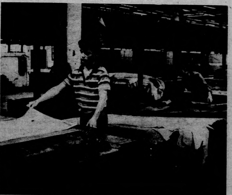
Előre biztosították az alapanyagot

A termelés folyamatosságát oly módon oldották meg, hogy előre biztosították az