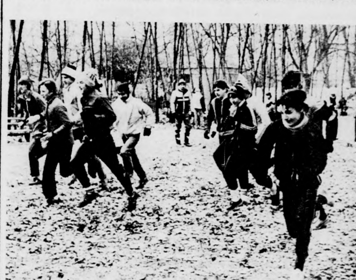
Rajtol a serdülők mezőnye