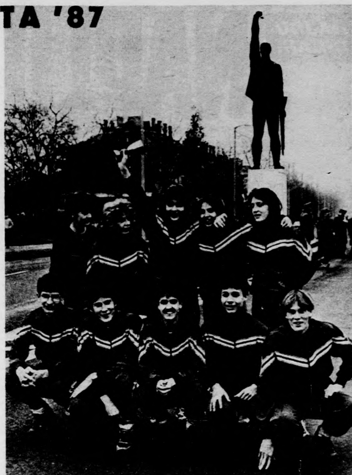
A Csokonai-gimnázium győztes váltója

A korábbi években csak debreceni középiskolák indították csapatukat, most azonban rajthoz álltak a hajdúböszörményi, a derecskei és a hajdúnánási diákok is. A tizenegy váltó minden tagjának három-négyes méteres távot kellett teljesítenie. A leghamarabb a Csokonai Vitéz Mihály Gimnázium váltója érkezett célba, idejük 8.45 perc. A továbbiak sorrendje: 2. Tóth Árpád Gimnázium, 3. Bethlen Gábor Közgazdasági Szakközépiskola, 4. Péchy Mihály Építőipari Szakközépiskola, 5. Fazekas Mihály Gimnázium, 6. Boeckai István Gimnázium (Hajdúböszörmény).