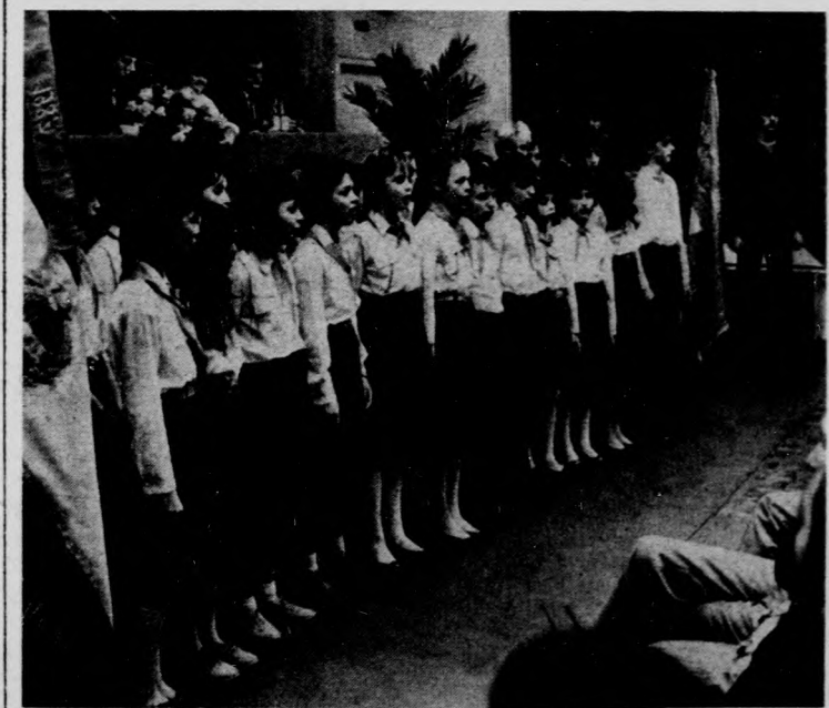
Az úttörők műsorral köszöntötték a hajdúszoboszlói nagygyűlés résztvevőit.

Az ünnepélyes megnyitón Kedves Tamás tagozati igazgató köszöntötte a megjelenteket, majd Králík János intézeti igazgató beszéde hangzott el a zenetanárképzés két évtizedéről. Ujjalussy József akadémikus, a Zeneakadémia rektora zenetanárképzésünk gondjairól tartott előadást. Délután csoportos konzultációkra, vitákra került sor, este pedig a pécsi, győri, miskolci, budapesti, szegedi és debreceni tagozat növendékei adták ünnepi hangversenyt.