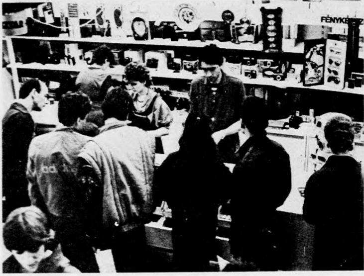
A fotócikek iránt is nagy az érdeklődés