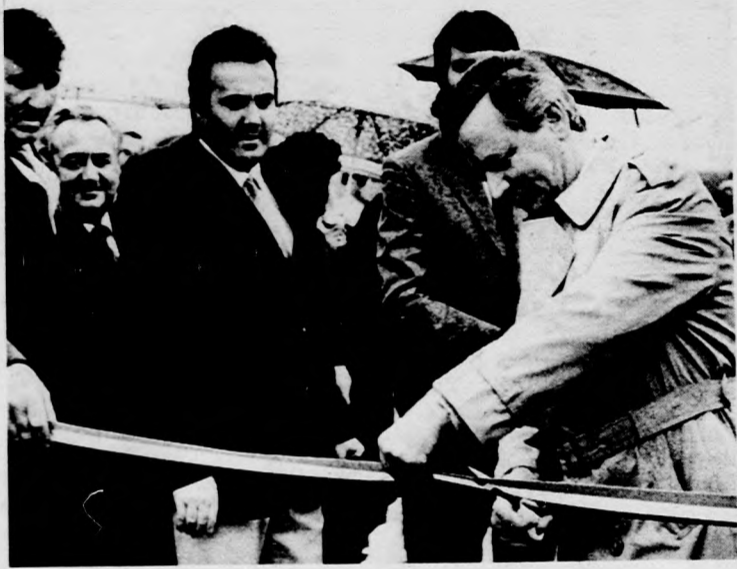
Szűrös Mátyas átadja a szabadidőközpontot

Szórádi Sándor beszédének elhangzása után Szűrös Mátyas, az MSZMP Központi Bizottságának titkára a szabadidőközpont bejárta-