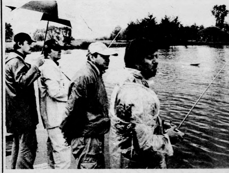
Az idő nem kedvezett a rádió-tvírányítású hajómodellezőknek szombaton. Az 1-es pályán az osztrák, a 2-esen a bolgár kettőst mindez láthatóan nem zavarta

Szombaton és vasárnap nemzetközi rádiótvírányítású hajómodellező-versenyt rendeztek a Vekerin-tavon, magyar, bolgár, csehszlovák, jugoszláv és osztrák résztvevőkkel. MHSZ debreceni modellezőklubja nyerte (Sólyom I., Kiss (osztrák) 61 kör (egy kör 350 m), I. B.undi) 200 körrel, 2. Orosháza 195, 3. Bp. modellezők 194. FSR siklóhajók: 1. Kiss I. FSR 6,5 kcm: 1. Kiss I. 1175, 2. Sólyom I. 925, 3. Szabó (MHSZ Debrecen) 64, 2. Pokorny (Zalaegerszeg) 175 ponttal.