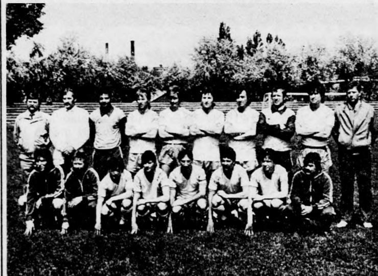
A D. Kinizsi csapata — a területi labdarúgó-bajnokság Tisza-csoportjának győztese

A területi labdarúgó-bajnokság Tisza-csoportjában a D. Kinizsi már szombaton, a 0-0-ra végződött H. Szabo SE-Balmazújváros mérkőzés után bajnoknak volt tekinthető — és készülhet az NB II-be jutásért kiírt osztályozóra.