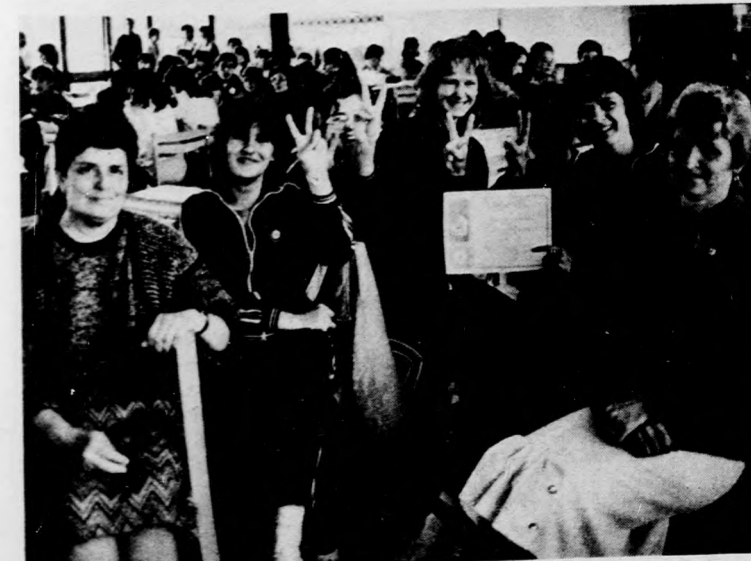
A Fazekas-gimnázium csapata a győzelem után

Valamennyi résztvevő oklevelet és ajándékot kapott, a három legjobban szereplő csapat pedig a csillibérci országos elsősegélynyújtó versenyen fogja majd képviselni megyénket.