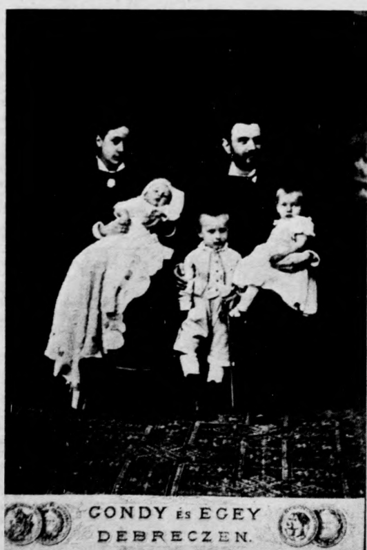
A Komlóssy család