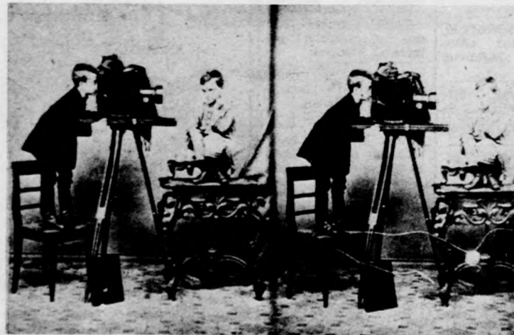
Mezey Lajos: Flaim a műteremben (1856)

Mint arról már hírt adtunk, érdekes kiállítást nyitottak meg a Déri Múzeumban. A családi fényképalbumokban található tájképeket, eseményfotókat láthatják az érdeklődők. A felvételek 1863–1918 között készültek. A fotók a korabeli debreceni mesterek „fényirányában” készültek. A legismertebb debreceni családok tagjainak képei mellett neves művészek fotói láthatók. A kiállítás augusztus 2-ig tekinthető meg.