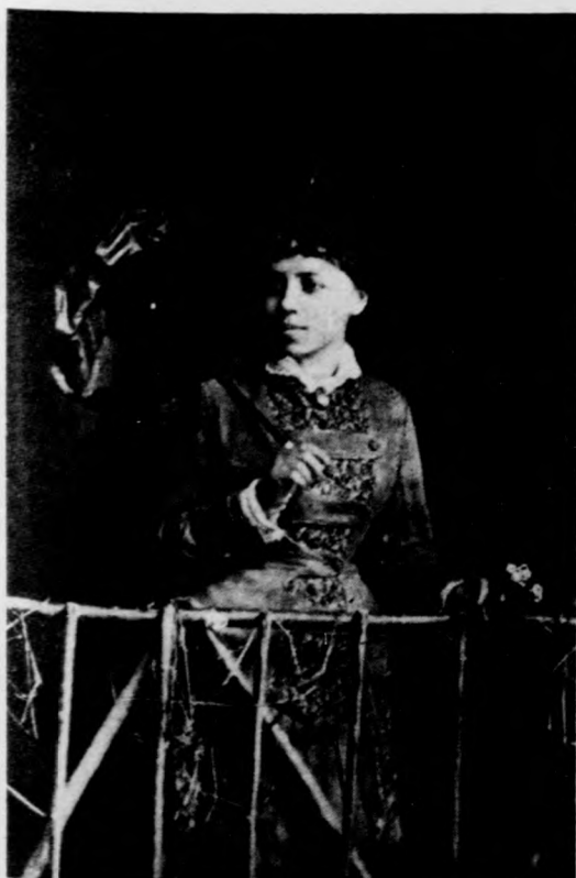
Sesztina Piroska (1890)