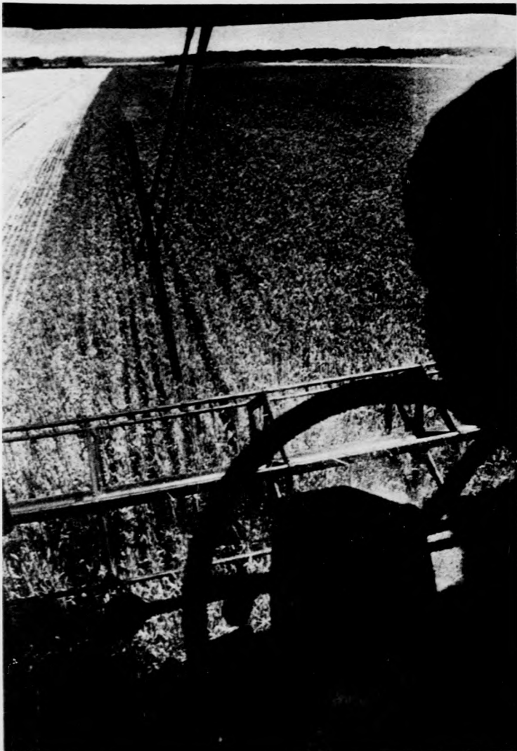
Búzatenger. A légkondicionált fülkében nem érezni a nyári forróságot