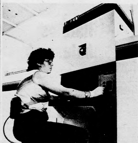
A kidolgozási folyamat egyenletes minőségét komputer segítségével biztosítják