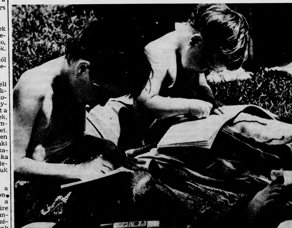
A szabad idő hasznos eltöltése — a strandon