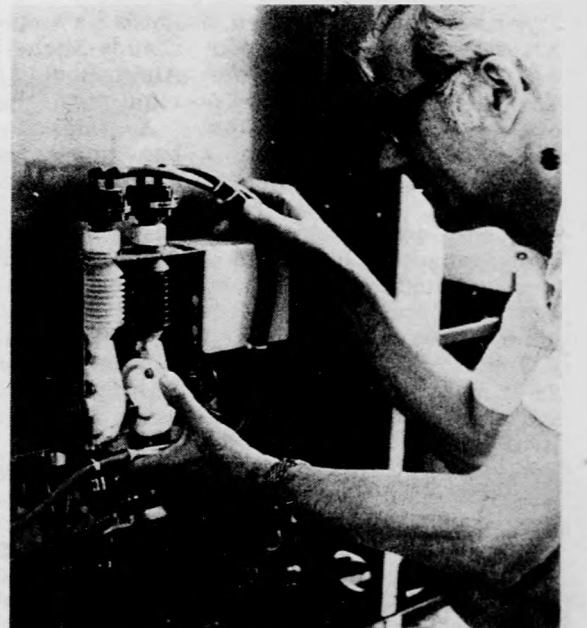
A papírhívó gép regeneráló szivattyújának beállítása

A kiszövetkezet vezetői elmondották, hogy a berendezés a vámmal együtt 10 millió 43 ezer forintba került, amelynek kilencven százalékát saját erőből teremtették elő, két műszakban fog dolgozni, de ha az igények indokolják, átternek a három műszakra, illetve a munkaszüneti napokon és ünnepnapokon történő üzemelésre is. Ilyen berendezés már működik Budapesten, a vidéki városokban ez a második expresszlabor. A berendezés igen jól fogja szolgálni például a vállalatok gyors reklámpropaganda-igényét. Beszerezték a szükséges ezüstvívianyterő készüléket, így ki tudják vonni az ezüstöt a kidolgozó oldatból, amit a pénzverdének fognak eladni. Mód nyílik a vegyszerek újrafelhasználására, ami egyúttal azt is jelenti, hogy eleget tesznek a környezetvédelmi előírásoknak.