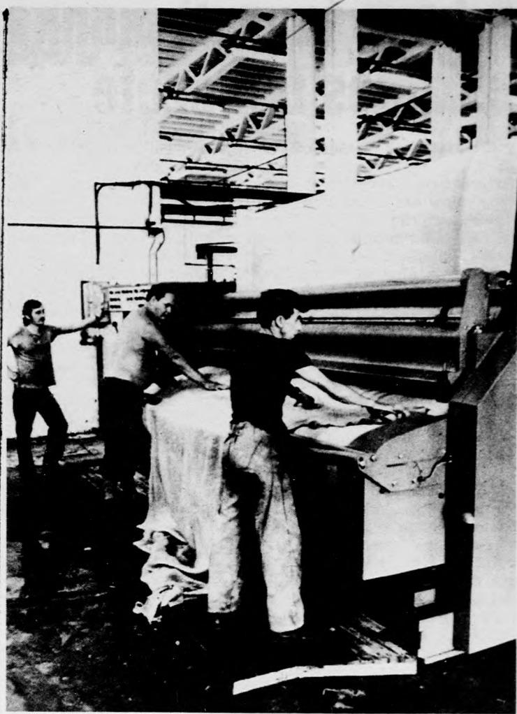
Már üzemel a víztelenítő prégés

A résztvevőket fogadta az észak-walesi megyei tanács elnöke is. A kórus Llangollenből Shrewsburybe utazott, s a Concert Orlid által rendezett fesztiválon adott nagy sikerű hangversenyt.