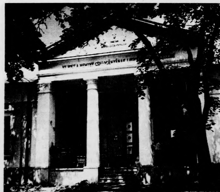
Blaha Lujza nyaralója Balatonfüreden