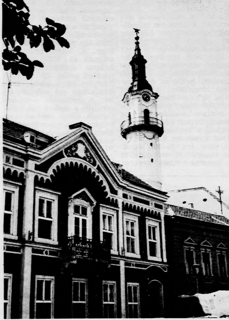
A közelmúltban felújított tűztorony Veszprémben