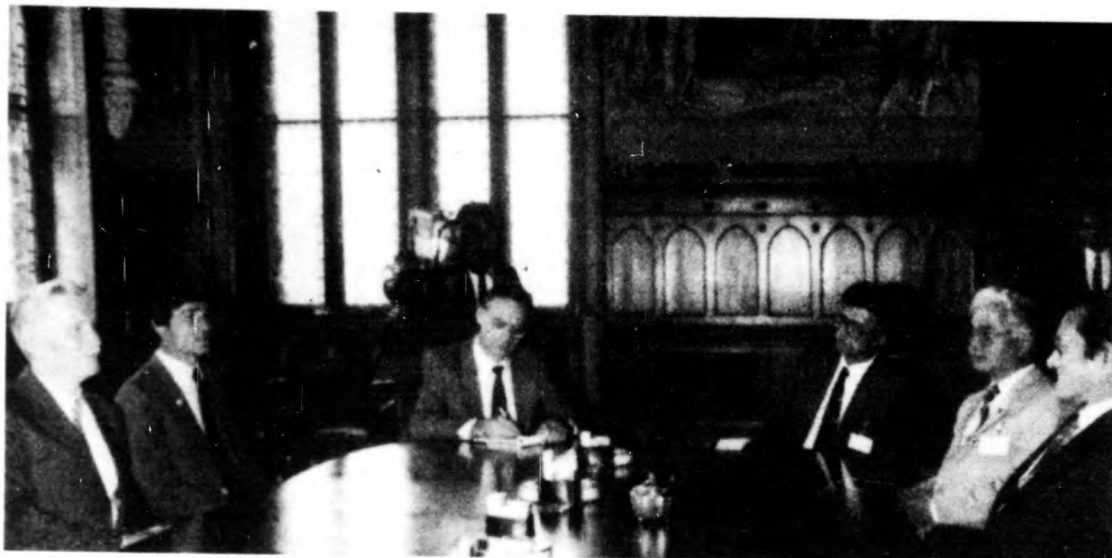
Lázár György, az MSZMP főtitkárhelyettese a Parlamentben fogadta dr. Mahathir Mohamad malaysiai miniszterelnököt