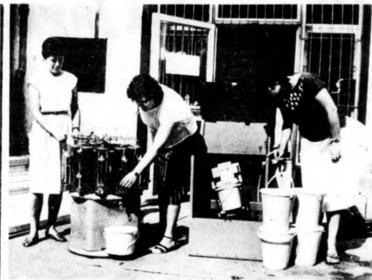
216 színárnyalatot „tud” a festékeverő automata