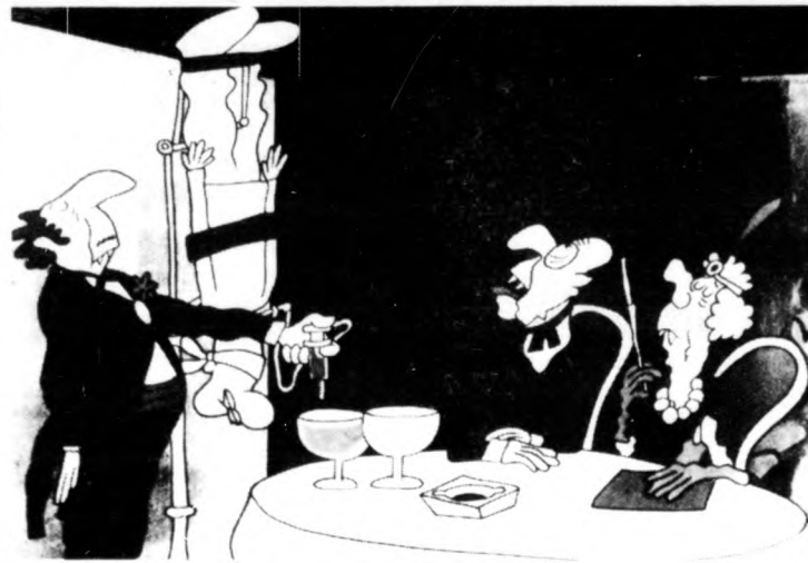
VÁMPÍROK HAVANNÁBAN Színes, szinkronizált kubai film • Rendezte: JUAN PADRON

A hajdúböszörményi kenyér a legjobbak közé tartozik. Remélhetőleg ezen az sem változtat semmit, hogy az 1970-ben felújított bővített kenyérgyár helyett újat, korszerűbbet kap a város. A 70 millió forintos beruházás révén a sütőüzemben nem kell majd zsákolni, kevesebb lesz a por, a szennyeződés. 16 óra alatt 12,6 tonna termelőképeségű üzem fogja ellátni Bősörményt és Bodát. A kivitelező, a megyei tanácsi építőipari vállalat ígérete szerint a beruházás 1983. december 31-ig elkészül. S addig? Hajdúnánás, Hajdú-