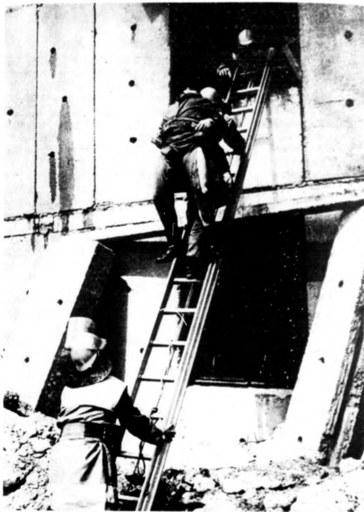
...és a tűzoltók

egyéni védőeszközök használatával a másodlagos — szennyező — hatások eredményesen kivédhetők.