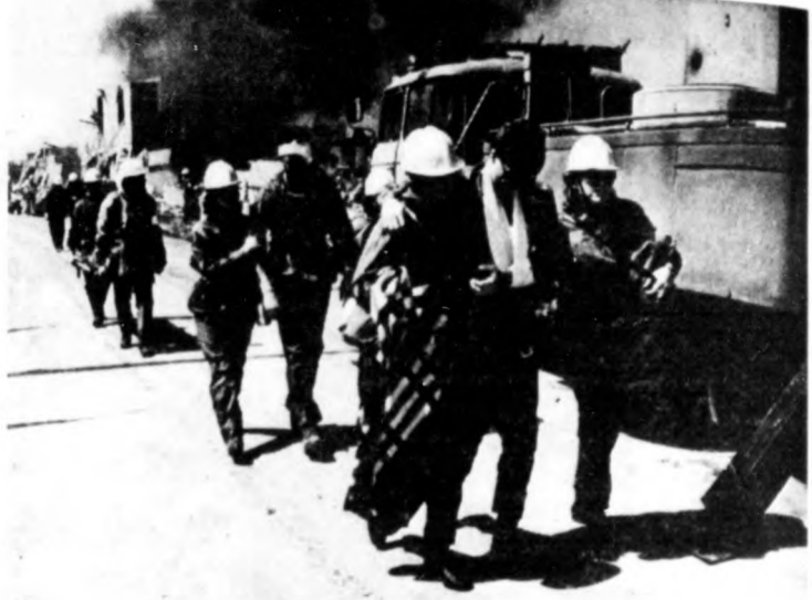
Akcióban az elsősegélynyújtók...

A lakóházak, lakások és közintézmények megelőző rbv-védelmi célokra — tartózkodásra, munkavégzésre — való előkészítése, a háborúra való felkészülés egyik fontos feladata. Az épületek nyílászáróinak szigetelésével, a levegő szűrésével, élelmiszer- és ivóvíz-tartalékok képzésével, és az