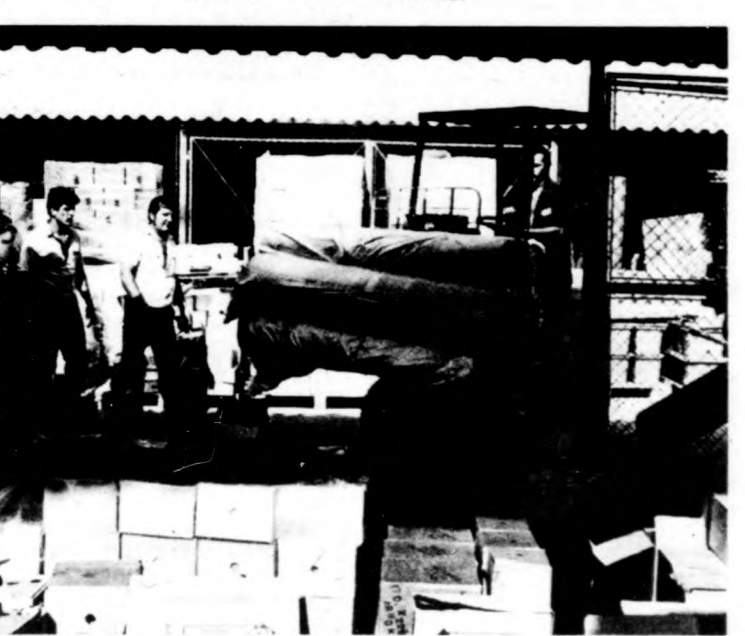
Olcso NDK-padlószőnyeg érkezik a Trapéz központi raktárába.