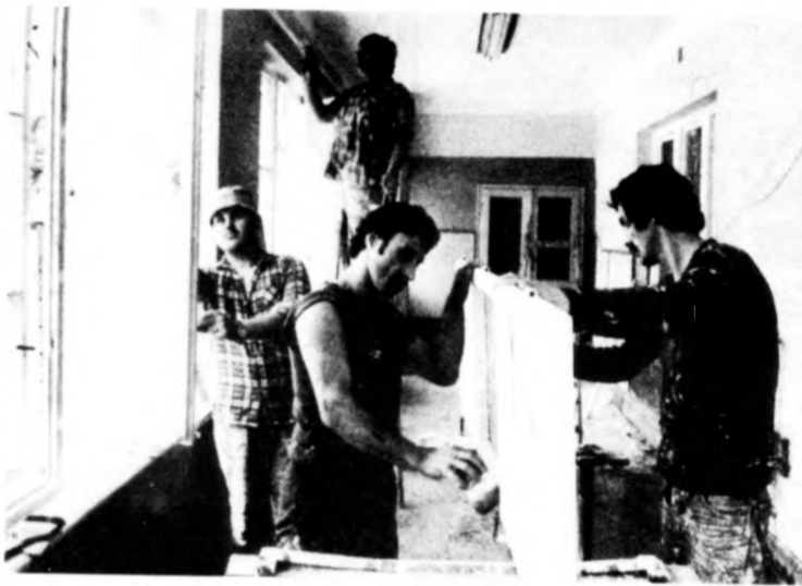
A Debreceni Ingatlankezelő és -közvetítő Vállalat szakemberei festik az ablakokat a Fűvészkerti Általános Iskola napközi otthonában

Az általános iskolákban s a középfokú oktatási intézmények legtöbbjében tegnap és tegnapelőtt kerítették sort a tanévnyitói ünnepségekre. Megyénkben mintegy 25 000 óvodás, 71 500 általános iskolás (ebből körülbelül 8000 elsős), 23 800 középiskolás indul reggelente az új tanévi munkájába. Debrecen hét gimnáziumában, tizenegy szakközépiskolájában, négy szakmunkásképző intézetében és két szakiskolájában mintegy 17 ezer diák tanul. Az általános iskolákban (ezeknek negyven a számuk a megyeszékhelyen) 27 ezer gyerek kezd meg a tanulást, köztük háromszáznyolcvan a kezdők.