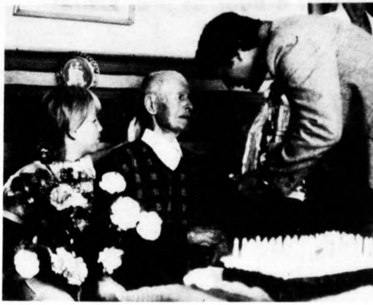
1987. AUGUSZTUS 31. HÉTFŐ ERIKA NAPJA A Nap két 6.00 — nyugszik 19.30 órákor

VÁRHATÓ IDŐJÁRÁS: Változóan felhős lesz az ég, szóróvályósan kisebb eső, fűtő zápor valószínű. Az északnyugati, északi szél többfelé megélénkül, néhol átmenetileg megerősödik. A legalacsonyabb éjszakai hőmérséklet 9 és 14, a legmagasabb nappali hőmérséklet hétfőn 20 és 25 fok között várható. (MTI)