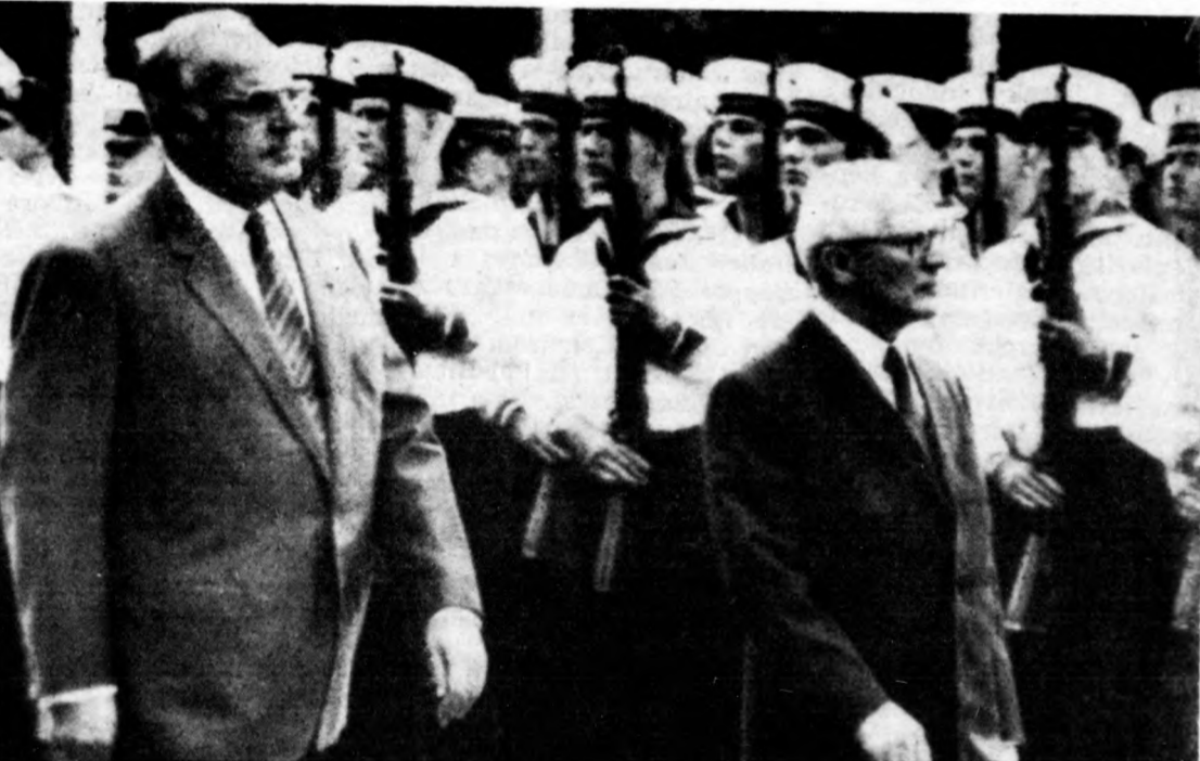
Az NDK első számú állami és pártvezetője Helmut Kohl nyugatnémet kancellár kíséretében elvonul a bonni kancellári hivatalnál felsorakozott díszalakulat előtt