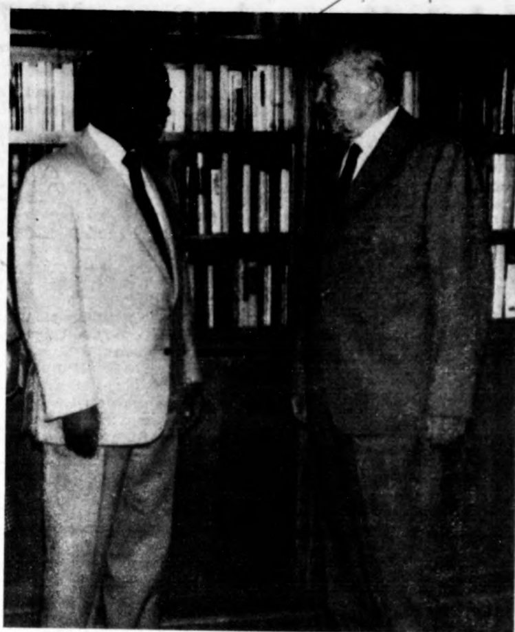
Kötetlen beszélgetés a tárgyalások előtt

Kádár János, a Magyar Szocialista Munkáspárt főtákkára hétfőn délelőtt a Központi Bizottság székében fogadta Oliver Tambót, a dél-afrikai felszabadítási mozgalom, az Afrikai Nemzeti Kongresszus (ANC) elnökét és kíséretét. A szívvel-lelkőrel találkozón véleményt cseréltek az elhúzódó dél-afrikai konfliktus