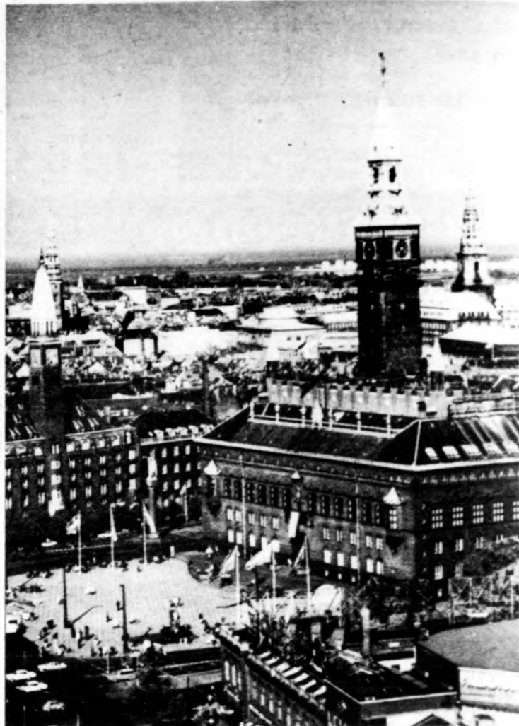
Koppenhága: a városháza épülete a belvárosban

Németh Károlynak, az Elnöki Tanács elnökének meghívására II. Margit, Dánia királynője a közeli napokban hivatalos látogatásra hazánkba érkezik. (MTI)