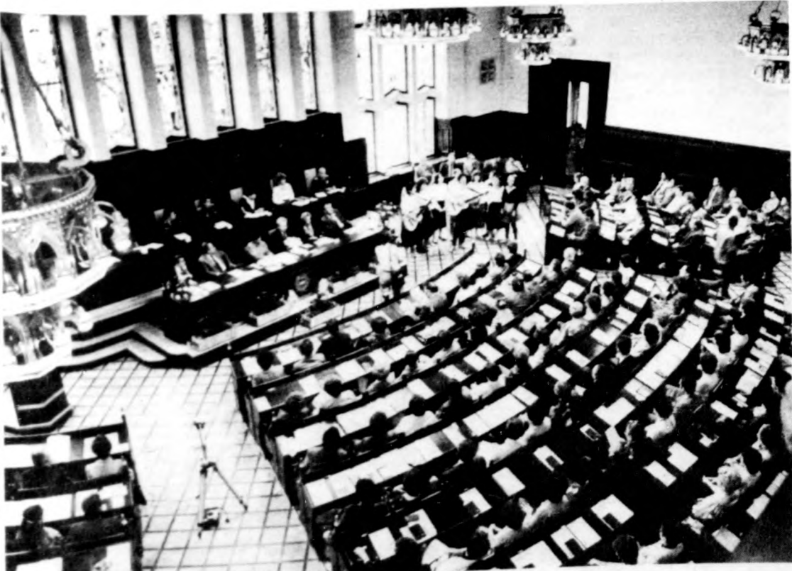
Az ünnepélyes megnyitó pillanata — az Ady Endre Gimnázium diákjainak műsora