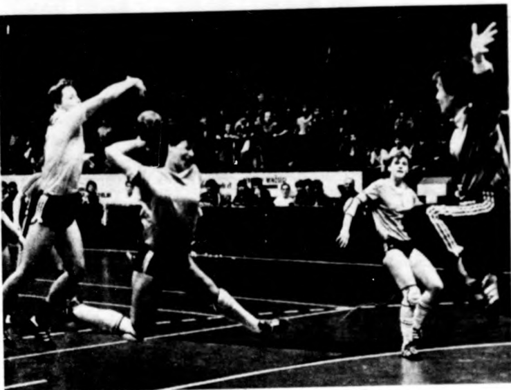
Medgyessyné kapura tör

Totóeredmények X,1,2, 1,X,1, X,2,1, X,2,X, 1,1,2.