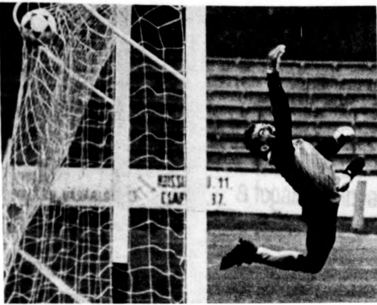
Ambrusch hiába nyújtózkodik, Melis lövése nyomán halóban a debreceniek egyenlítő gólya

Kevéssel a befejezés előtt Vancsa végigiramodott a pályán, sorra cselezte ki a Vasas-játékosokat, míg végül az utolsó ember, Mészoly kíméletlenül felvágta. Szabó B. sárga kártyát húzott elő, pedig piros jart volna, hisz szándékos szabálytalanságról volt szó. A megítelt szabadrugásból Melis mintegy húsz méterről alig-alig lőtt a kapu fölé. Az utolsó pillanatok sem zajlottak eseménytelenül. Zvara tört be a debreceni kapu elé, Nagy L. becsúszva szerelte. Szabadi 11-est reklamált és valószínűleg a bíró is megsértette, mivel a kiállítás sorsára jutott. A 93. percben a kék-sárga mezűk boldogan emeltek karjaikat a magasba, hisz itthon tartották a két bajnoki pontot.