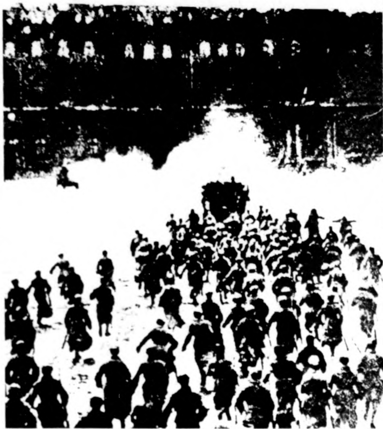
A munkások seregének, a Vörös Hadseregnek egyik alakulata Petrograd utcáin

A forradalom előkészítése során egyre növekedett a bolsevik párt ereje és összeforrottsága. Októberben a párttagok száma mintegy 350 ezerre nőtt, a párttagok 60 százaléka élvonalbeli munkás volt. A párt amelyet elszakíthatatlan kötelékek fűztek a tömegekhez, teljes harci készségben várta a soron következő döntő ütközetet.