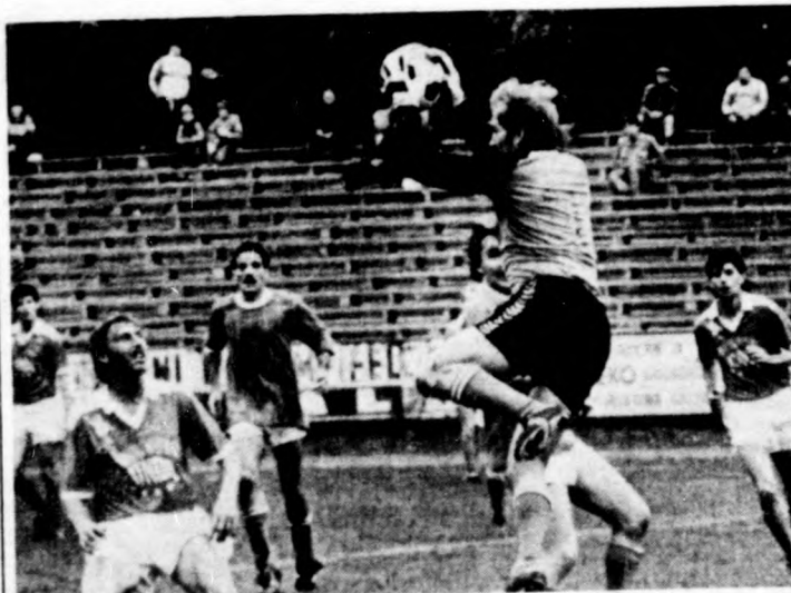
Kun biztos kézzel hárít (D. Kinizsi-Karcag 0-0)

A labdarúgó NB III Ti- le az elmúlt hét végén. sza-csoportjában a 11. for- Szombaton Debrecenben dúló mérkőzéseit játszották hiába volt a D. Kinizsi Rakamaz.