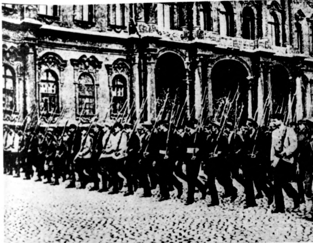
Roham a Téli Palota ellen