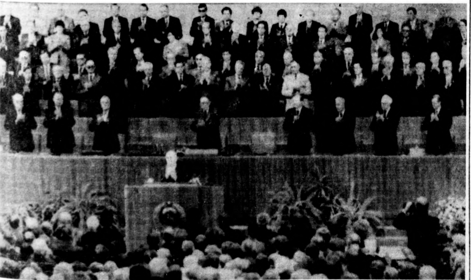
Az ülés elnöksége: a szónoki emelvényen Mihail Gorbacsov, beszédének megkezdése előtt.