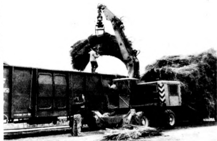
Egyeken a növénytermesztésben az egyik legjobban jövedelmező kultúra a kender