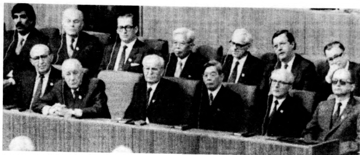
Szocialista országok párt- és állami vezetői az ünnepi ülés elnökségében. A képen az első sorban Kádár János, a második sorban; Németh Károly.

Nos, mire alapozzuk bizakodásunkat, azt a hitünket, hogy valóban lehetséges az átfogó biztonsági rendszer megteremtése? Érdemes egy kissé elidőzni ennél a kérdésnél. Megemlíkezzük forradalmunk 70. évfordulójáról, s figyelembe véve, hogy e forradalom nem győzött volna elméleti előkészítés nélkül, most, egy új világtörténelmi fordulóponthoz eljutottunk, a fordulóponthoz új elméletileg ismét kidolgozzuk a tartós béke megteremtésének távlatait. Az új gondolkodásmód segítségével lényegében megindokoltuk az átfogó nemzetközi biztonsági rendszer megteremtésének szükségességét és lehetőségét, a leszerelés feltételei között,