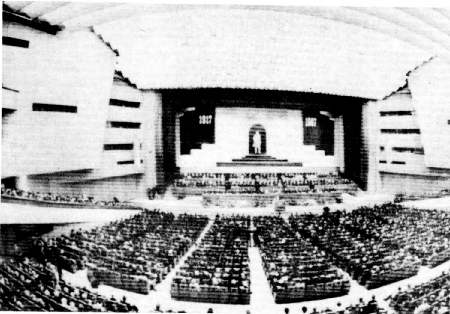
A Kreml kongresszusi palotájának ülésterme.

szágából szocialista Oroszország lesz”. Lenin nem tűzhatta es nem is tűzte azt a feladatot maga elé, hogy minden apró részletet átlátva megrajolja a jövőbeli társadalom képét. A társadalmi berendezkedés alapvetően új szintjére emelkedő ország képeinek a gépipar megteremtéséből, a széles körű szövetkeztetésből, a dolgozóknak az államirányításba való általános bevonásából, az államapparátusnak az „inkább kevesebbet, de jobban” elve alapján történő megszervezéséből, az egész nép kulturális fejlődéséből, a szabad nemzetek szövetségének „hazugságtól és rabságtól” mentes erősítéséből kellett kialakulnia.