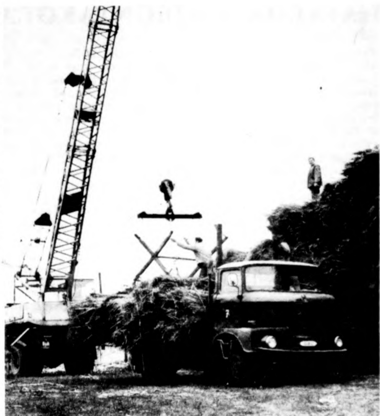
Tiszacsegeről, Tiszafüredről és Egykőről az idén összesen 3500-4000 tonna kender taktak bálákba

A részben hagyományos technológiával végzett betakarítás után október közepéig befejezték a kézi bedolgozást (a kévké kúpa állítását, majd az úgynevezett batyuzást is. A Kenderfonó- és -szövőipari Vállalat komádi gyáregységének értékesített kórotömeg egy része — csakúgy, mint az egykői tsz-ben ideiglenesen lerakott tiszacsegei és tiszafüredi termelőké — az elmúlt napokban vagonba került. A szövetkezet bérmentésben végzi a kocsik megrakását, amelyeknek tartalmát, amelyeknek tartalmát — eddig 1400 tonna — Romániába exportálják. November közepéig várhatóan további 1100 tonnát indítanak utnak a szomszédos országba. Ennek sikere azonban attól is függ, hogy a MÁV tud-e a külföldi partner is kielégítő műszaki állapotú kocsikat a szövetkezet rendelkezésére bocsátani.