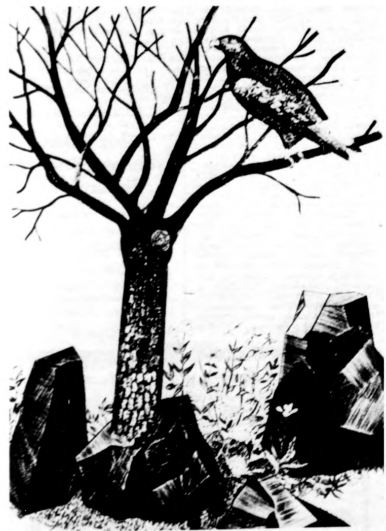
Szabó László: És alul a kövek