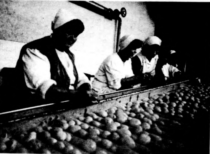
Válogatják a burgonyát

Hamarosan megkezdődik a disznóvágások szezonja, de a koracsónyi és szilveszteri ünnepek is rohamléptekkel közelednek. Milyen tehát most az országos kép és mire számíthatunk az elkövetkező hónapokban?