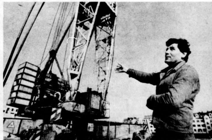
Ez a daru csak 22 méter magas