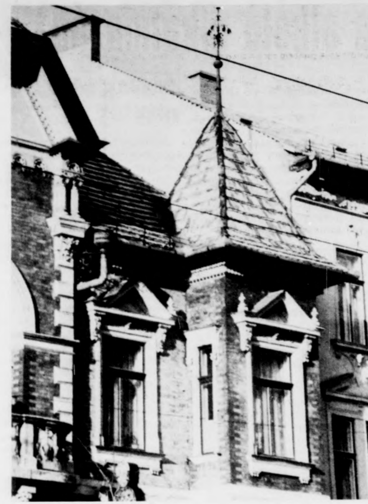
EZ IS DEBRECEN

a tavasz lerövidül, májusra szűkül. A nyár hosszabb, melegebb és aszályos lesz. A szeptember októbertől decemberig tart, az enyhe tél pedig januártól áprilisig, hó helyett esővel. A legtöbb csapadék tavasszal várható, árvízveszélyt is okozva. Mindez akkor következik be, ha a környezetszennyezés nem csökken, am a szakemberek nem túl bizakodóak e tekintetben. Megoldhatatlan feladat például belátható időn belül a széntüzelést környezetkímélő energiatermelésre átváltani, hogy csökkenjen a levegő széndioxid tartalma. Még a gépkocsi kipufogógázait sem sikerült megtisztítani. És egy-egy ország önmagában nem is tud eredményt elérni, hiszen a légkör nem lehet határokkal lezárni, a szennyezés mindenhol eljut, és évekig a levegőben marad. (A dinitrogén-oxid például száz évig megmarad.) Vagyis ha ma megszűnne a föld légkörének minden szennyezője, akkor is évekig tartana, amíg a javulást észlelni lehetne. désekre van szükség, mint a szulfát-egyezmény, amely a kénkibocsátás csökkentésére kötelezi a tagországokat, így hazánkat is. Nagy szükség lenne a freonokra is kiterjeszteni a tiltást, és minden lehetséges egyéb módon is hozzájárulni ahhoz, hogy kedvezően változzon a föld légköre, s vele együtt jövőnk éghajlata. Imre Erzsébet