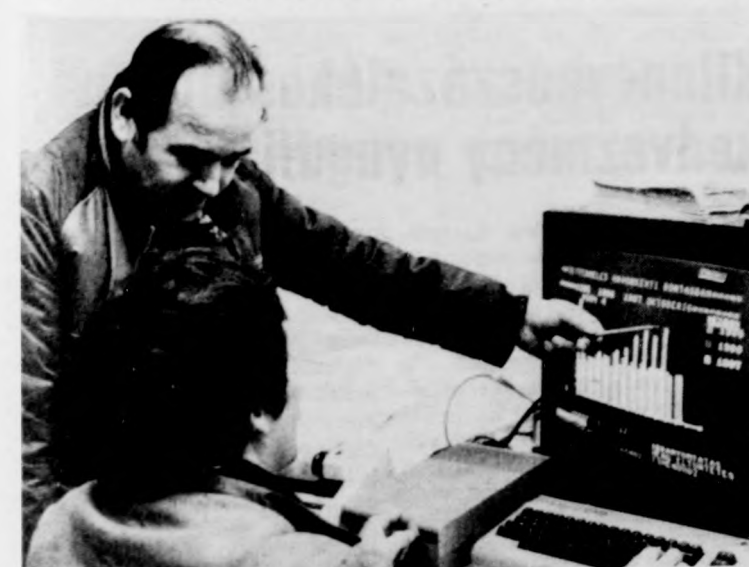
A számítógépes adatfeldolgozás a szakemberek munkáját könnyíti

bővül is a telep: a régienél kétszer nagyobb, 700 férőhelyes lesz, s ez a modern,