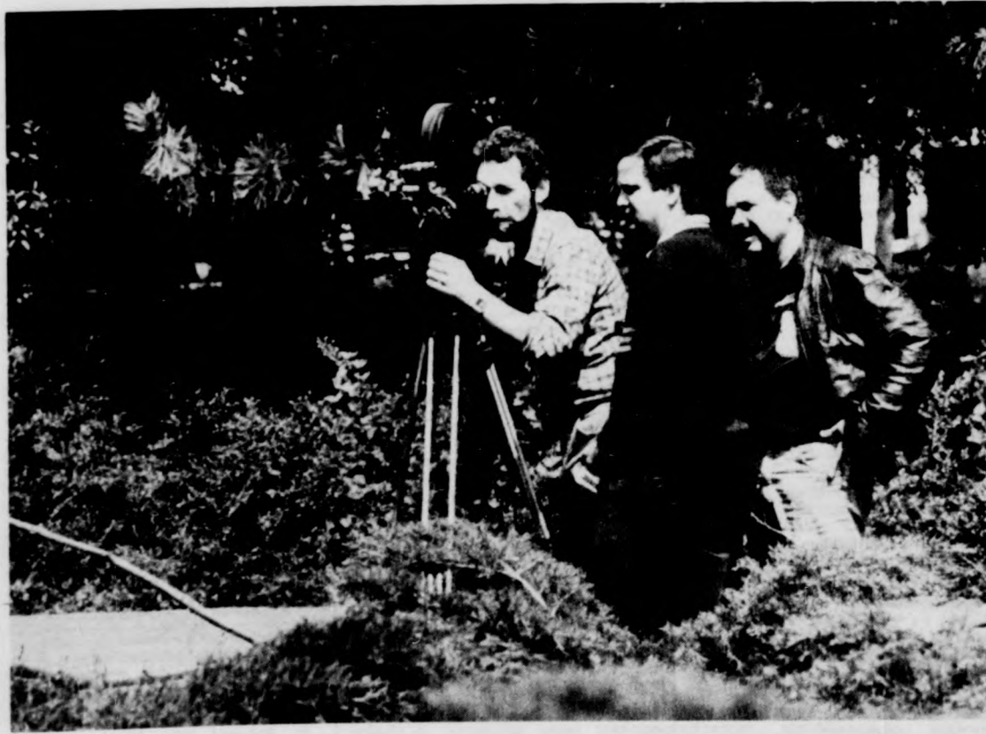
A nagyerdei szoborparkban dolgoznak a tévések

A műsor riportere Tóth Károly, szerkesztője Furkó Zoltán, operatőre Máriaassy Ferenc, rendezője Babiczky László.