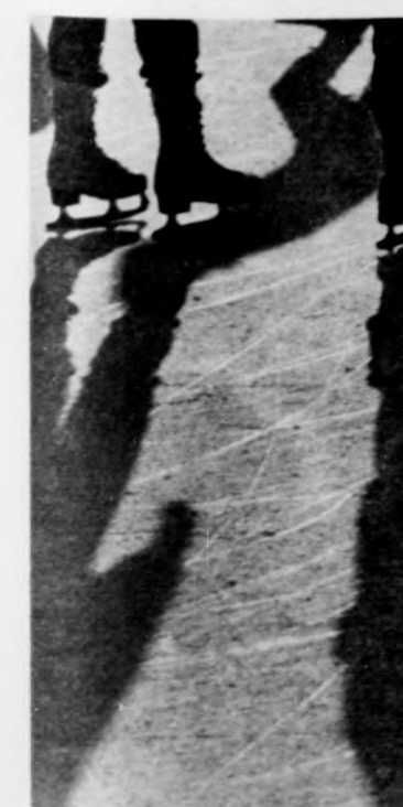
Karcolatok a szikrazó jégen