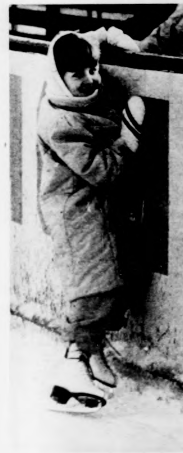
Az első lépések

gyakorlott ember húzza, kőti a lábára. A korcsolyázás tudományának elsajátítása sok-sok tréfás, sőt időnként fájdalmas epizóddal jár. Felvetelünk — a nagyerdei jégpályán készültek — mutatják a korcsolyával való első próbálkozást és a vidám siklást is. Szekeres Tibor kamerája megérintette a korcsolya, látta a jeges pillanatok