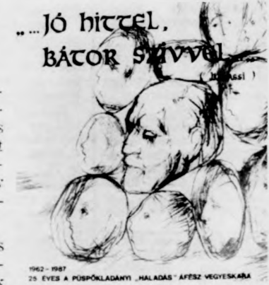
A hanglemez borítója

Négy nyelven(!), érthető szövegmondással, jónak mondható kiejtéssel énekel a kórus, ez nagyon sokat je-