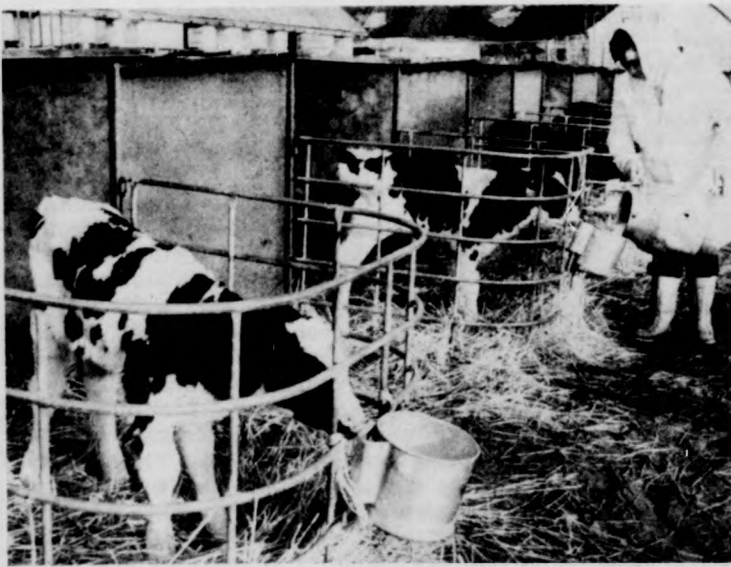
A ketreces, itatásos nevelés hatására ellenállóbbak a borjak és csökken a légúti megbetegedések száma is

kötetlen tartási mód bevezetésének köszönhető.