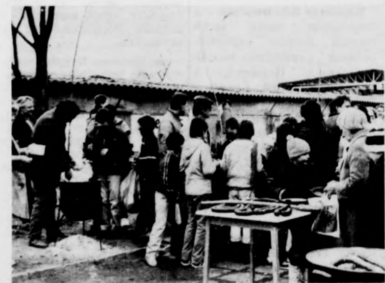
Tumultus a kóstolgatnivalók körül