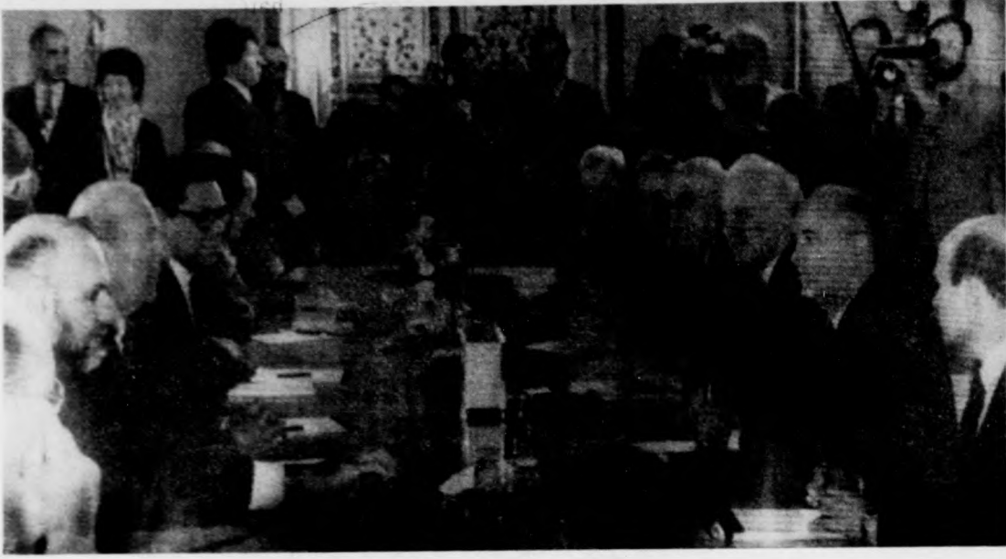
Mihail Gorbacsov, az SZKP KB főtitkára (jobbról a második) a Kremlben tárgyal George Shultz amerikai külügyminiszterrel (balról a harmadik)