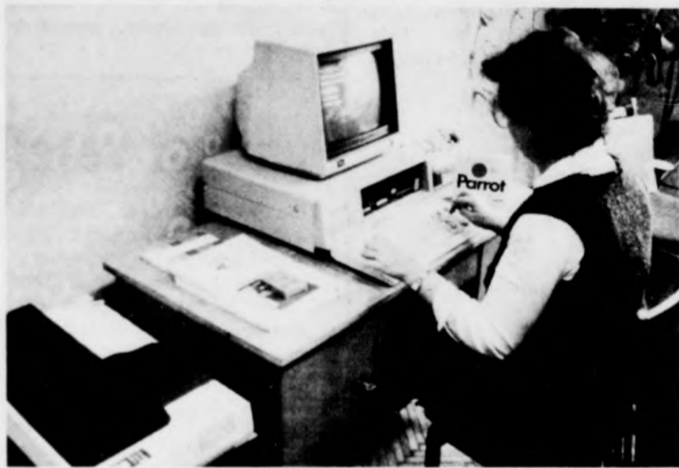
A számítógéptől elsősorban a versenyképességük javulását várják

Ezekből pedig itt is van elég, hiszen a Békés megyei Bucsától Balmazújvárosig elterülő 142 ezer hektáros területet sok „vizes” információval szolgál. A társulati törvény rendelkezése szerint ugyanis ez a 36 tagú társulás felelős a helyi jelleget és a közcélú csatornák