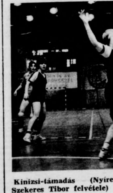
Kinizsi-támadás (Nyíregyháza-D. Kinizsi 17-16)

Kézilabda-városbajnokság Az elmúlt héten bonyo- lították le a debreceni város- bajnokság harmadik fordulóját a Városi sportsarnokban, a Kézilabdásportágban. Eredmények. 17-16 (7-8). Vezette Taizs, Zavacki. A szünet után a nyíregyházi tanítóképzősök lelkesebben játszottak, és ez döntőnek bizonyult. Ld.: Hegedűs 5, illetve Lukács 6. Férfiak. Balmazújváros-Haj- dúböszörmény 27-16 (14-9). Vezette Gacsályi, Nádasy. A játék képe alap- ján a gólkülönbség valós. Ld.: Török 9, Kordás 7, il- letve Szilágyi 5. — D. Medi- cinalabda-Nádudvari Vörös Csil- ág TSE 22-13 (9-5). Ve- zette Sebők, Tiba. Erdekes, színvonalas játék, az átló- vók közti tudáskülönbség döntött. Ld.: Hamza 6, Daj- ka 5, illetve Jakab 4.