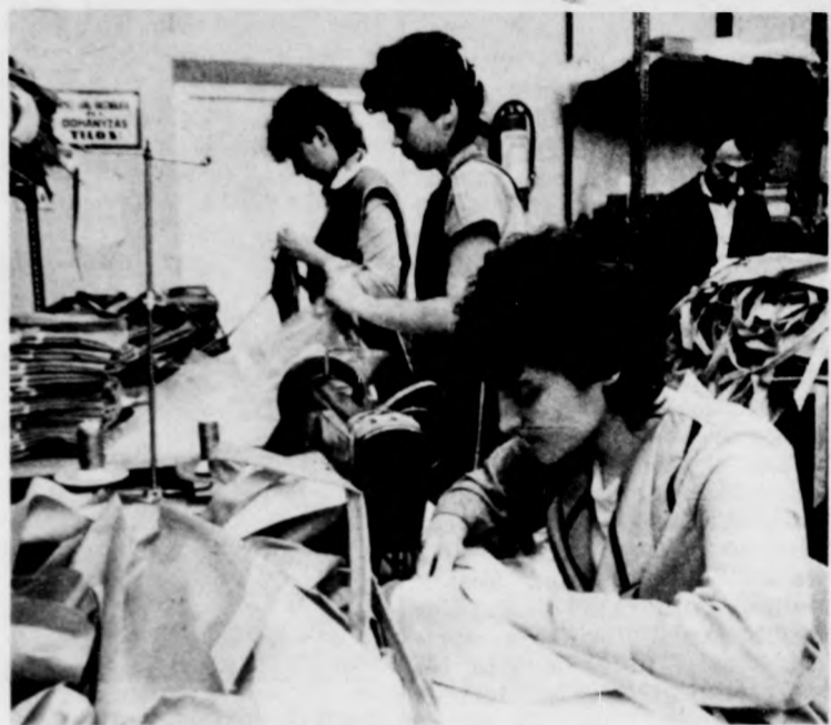
Amikor felépül az új üzem, újra klubhelyiség lesz ebből a zsúfolt műhelyből

Tizenkét évig dolgoztam egy AFESZ-üzletben, hat évig boltvezető-helyettesként — kezdi. — A sok állástól, cipekedéstől tönkrement a lábam, meg kellett operálni. Ezek után az üzletbe természetesen nem mehettem vissza, ám ülőmunkát nem tudtak biztosítani számomra. Két év fizetés nélküli szabadság után — amelyre orvosi javaslatra mentem — továbbra is csak álló munkát tudott volna adni az AFESZ, így alkalmi munkákat kellett vállalnom. Amikor híre ment,