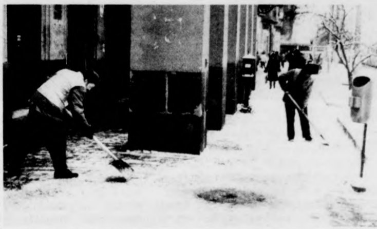
A Városgazdálkodási Vállalat dolgozói tisztították meg a járdákat

VASTAPS A GODSPELLNEK FILMNAPLÓ 5. oldal