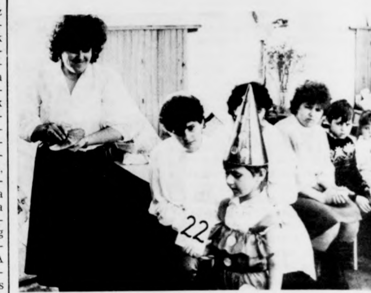
A zsűri előtt