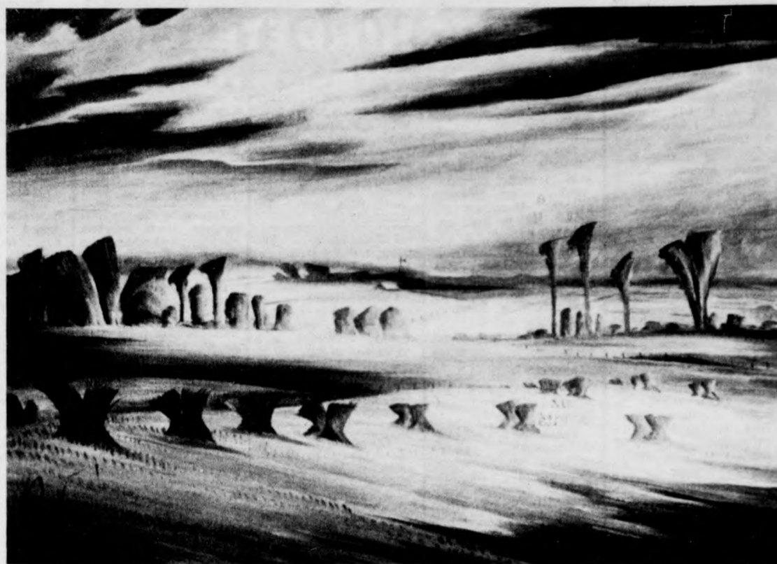
Kanada, a festők hazája című tárlat anyagából — Carl Schaefer: Mezők esti égbolttal