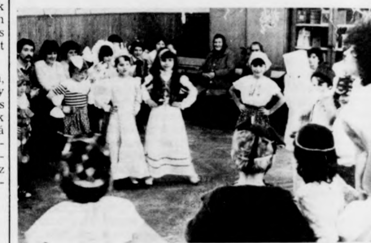
All a bál