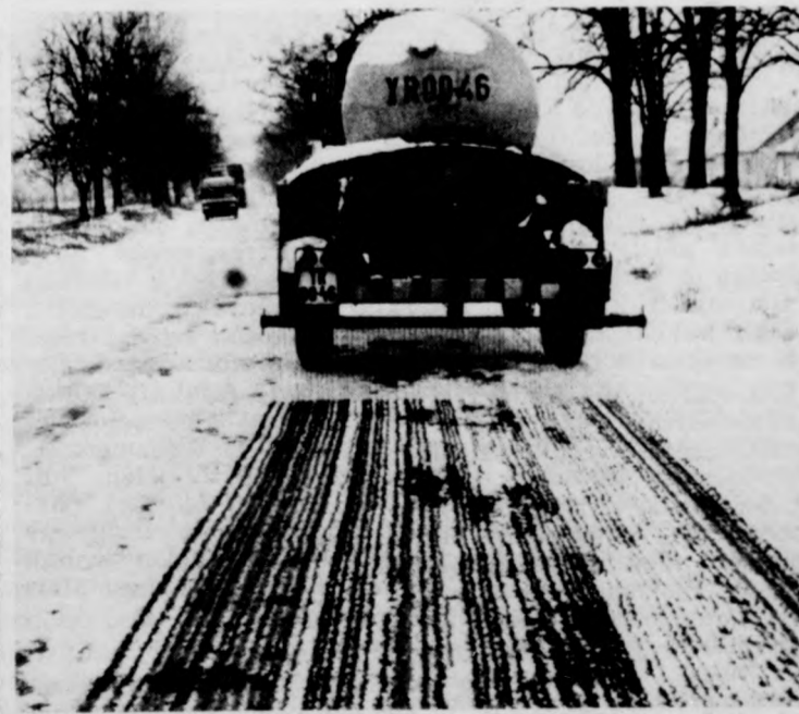
Az idén nyílt először alkalom, hogy kipróbálják az új környezetbarát vegyszert. A Nyiregyházi Közüli Igazgatóság gépei így végezték el az utak síkosságmentesítését