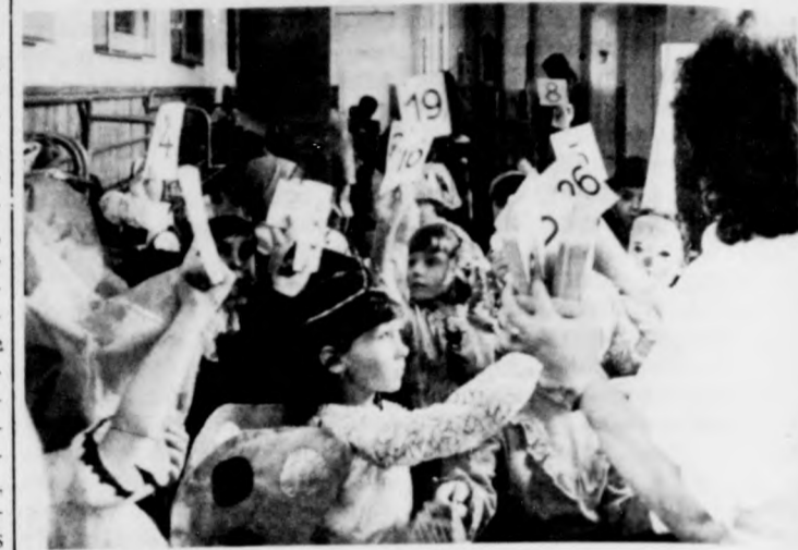
Rajtszámokat a magasba!

A farsang jegyében egymást érték az iskolai jelmezes versenyek és a maszkabálók. Felvételeink Debrecenben, az Április 4. Úti Általános Iskolában készültek.