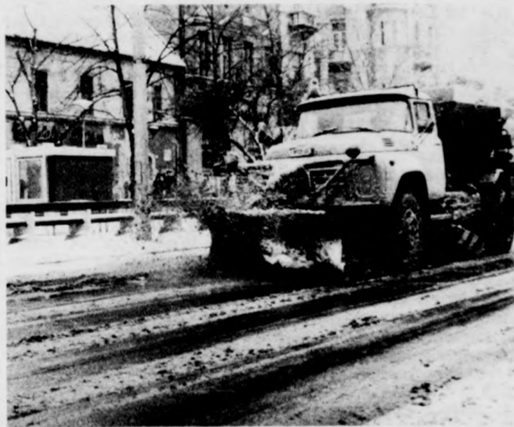
Dél körül már csak latyak borította a Vörös Hadsereg útját

És mit ígér a meteorológia? További havazást, sőt a hét végére hófúvást.