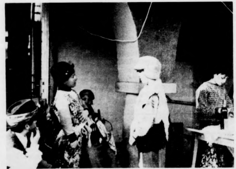
„Eljöttünk mi kántálni, kántálni...”