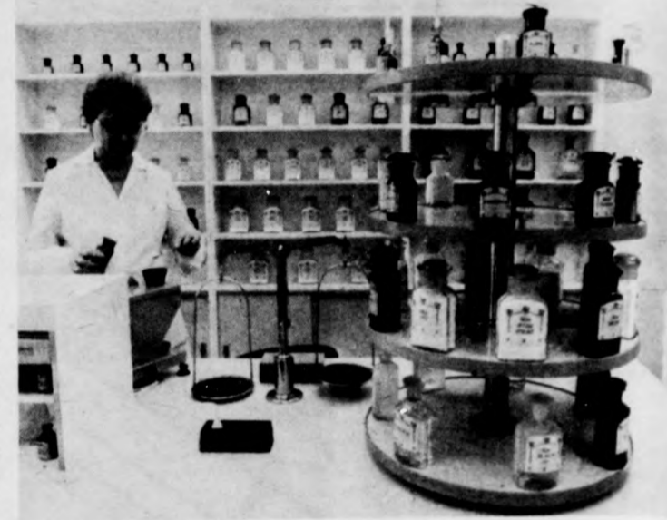
A korszerű laboratórium minden igényt kielégít

a jegyében épült meg a tócskerti lakónegyedben a március 1-jén megnyitott Földi patika. A lakótelep eddigi ideiglenes gyógyszertára egy korszerű, minden szakmai igényt kielégítő helyiségekkel, laboratóriu-