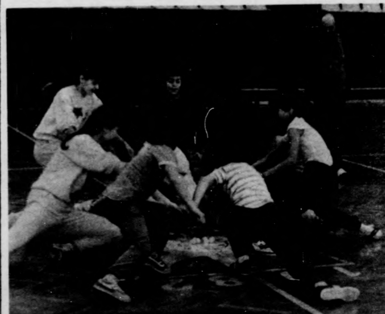
A gyerekeknek minél hamarabb össze kellett gyűjteniük a pingponglabdákat a parketta közepén