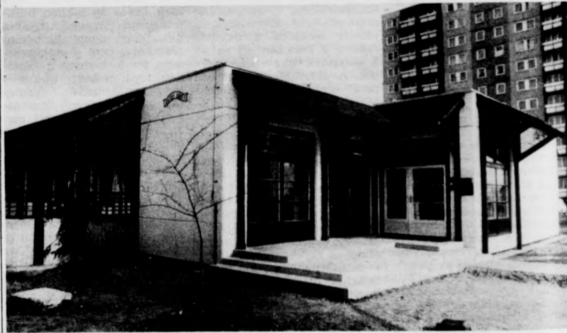
Újszerű homlokzat kialakítás