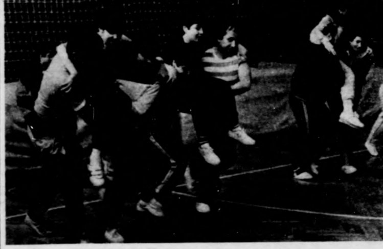
„Golya viszi a fiát” — ismert játékosvetélkedő

Bajnoki mérkőzésekben és tömegeseményekben ismét bővelkedett az elmúlt hét vége. Iklódy János fotóriporter fényképezőgéppel többek között felkereste a nagyerdői stadiont és az Oláh Gábor utcai sportcsarnokot is. A DMVSC labdarúgócsapata 2–2-es döntetlennel rajtolt a bajnokságban a Ferencváros ellen, míg az Oláh Gábor utcán a nemzetközi nőnap alkalmából játékos családi vetélkedőt tartottak.