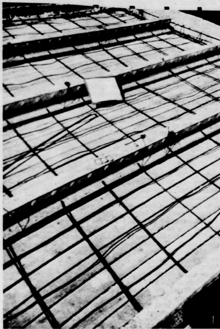
A gerendák közti tengelytávolság szabálytalanul nagy. A gerendák így túlterheltek. A szabályos köz 30—60 cm lehet

A felsorolt hibák közül a téglatalcás megoldást külön kiemelve véleményünk az, hogy nem képzelhető el a megfelelő tervezői művezetés és a kivitelezésért felelős műszaki szakember irá-