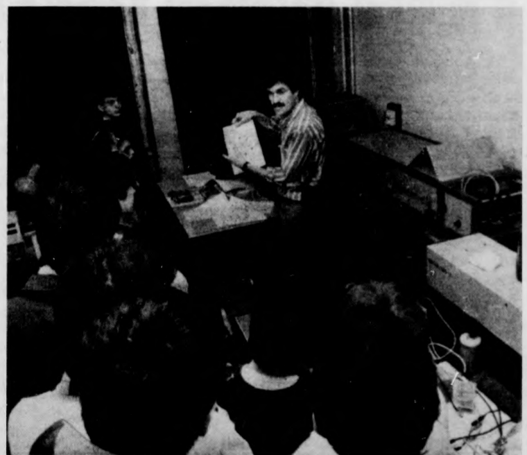
Lézerkísérlet — először csak papíron

A csaknem kétszáz érdeklődő diák az elméleti tömb egyik előadótérképében élő szóban ismerkedett meg azokkal a fizikai módszerekkel, amelyeket a DOTE-n részben alaputatások keretében, részben pedig a gyógyítás szolgálatában alkalmaznak. (Ne feledkezzünk el róla: az idén a fizika és a gyógyítás kapcsolata volt a rendezvénysorozat fő gondolata.) Később a hallgatóság kisebb csoportokra oszolva az intézet nyolc különböző laboratóriumában, munkaszobájában (a túlorázást szívesen vállaló DOTE-munkatársak irányításával) megismerkedhettek azokkal a műszerekkel, eljárásokkal, amelyekről közvetlen tapasztalatokat más módon nemigen szerezhetnének. Egyaránt sikert aratott a lézer, a számítógép, az elektronmikroszkóp és a többi eszköz, problémát csupán az okozott, hogy az egymást váltó csoportoknak minduntalan várakozniuk kellett — senki sem szívesen hagyta ott a csábító, talán a majdani hivatás választásához is némi inspirációt adó berendezéseket.