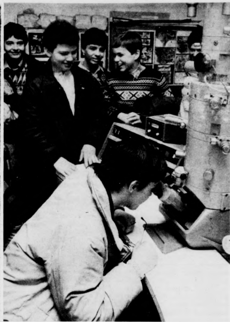
Mit mutat az elektronmikroszkóp?

valy 88 közbiztonsági önkéntes rendőri csoport végezte munkáját 935 taggal, és tíz közlekedési önkéntes csoport 88 fővel. A nyilvántartásból különböző okok (idős koruk, megromlott egészségi állapotuk, vállalt feladatok elhanyagolása stb.) miatt 102 nevet kellett törölni az elmúlt esztendőben, viszont 138 új önkéntes értett kedvet a kék karszalag viselésére. Újabban a kiválasztás is magasabb mérce szerint történik. Annak dacára sikerül ez, hogy a gazdasági élet egyre több területén inkább a jövedelemforrás kiszélesítésére törekednek az emberek, ez együtt jár szabadidejük csökkenésével. A huzamosabb ideje jó színvonalon végzett munka elismeréseként a Belügyminisztérium 169 önkéntes rendőrt tüntetett ki, tizenegyet részesített pénz- és tárgyjutalomban. A megyei főkapitányság vezetője tizenöt embert pénz- és tárgyjutalomban, három írásbeli dicséretben részesített. Ezen a tanácskozáson hirdették ki a tavalyi versenymozgalom eredményét. A benevezett csoportok közül az úgynevezett körzeti megbízotti alosztály 56. számú csoportja bizonyult a legjobbnak (egy évig övék lehet a vándorzászló), második lett a hajdúhadháztéglási 8. számú csoport, harmadik pedig a közlekedési alosztály úgynevezett vegyes 1. számú csoportja lett.