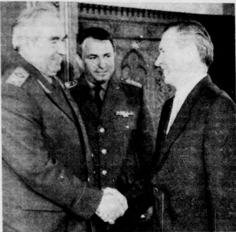
Viktor Kulikov és Grósz Károly találkozója

Grósz Károly, az MSZMP főtitkára, a Minisztertanács elnöke szerdán a Parlamentben fogadta Viktor Kulikort, a Szovjetunió marsallját, a Varsói Szerződés Tagállamai Egyesített Fegyveres Erői főparancsnokát. A szívélyes, elvtársi légkörű megbeszélésen részt vett Anatolij Griokov hadserégtábornok, az Egyesített Fegyveres Erők törzsfőnöke és Fedot Krievda hadserégtábornok, az Egyesített Fegyveres Erők főparancsnokának magyarországi képviselője, valamint Fejtő György, az MSZMP KB titkára és Kárpáti Ferenc vezérrezredes, honvédelmi miniszter.