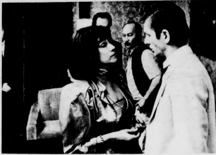
Vong asszony kincsei

Kedves Vince, jobb lett volna, ha ez a kézirat a Lángé (vagy még inkább: a Lángé) marad. Vagy hogy finomabban — és stilszerűbben — mondjam: jobb lenne, ha egy óra múlva itt se volna.