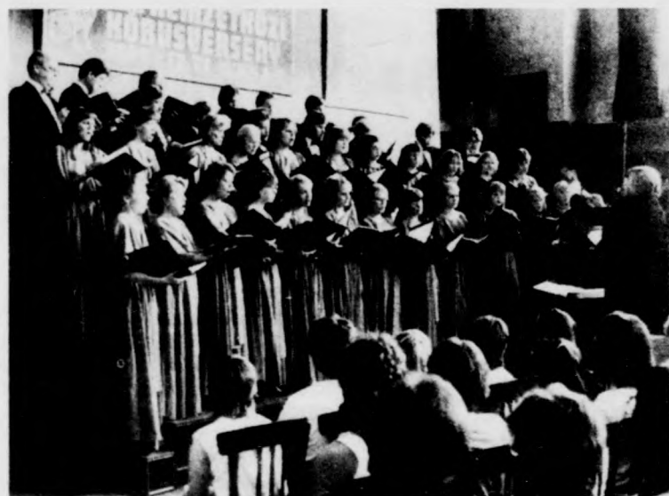
A Jywaskylän Studiokuoro a döntőben

Tegnap reggel a gyermekkarok döntőjével foly-