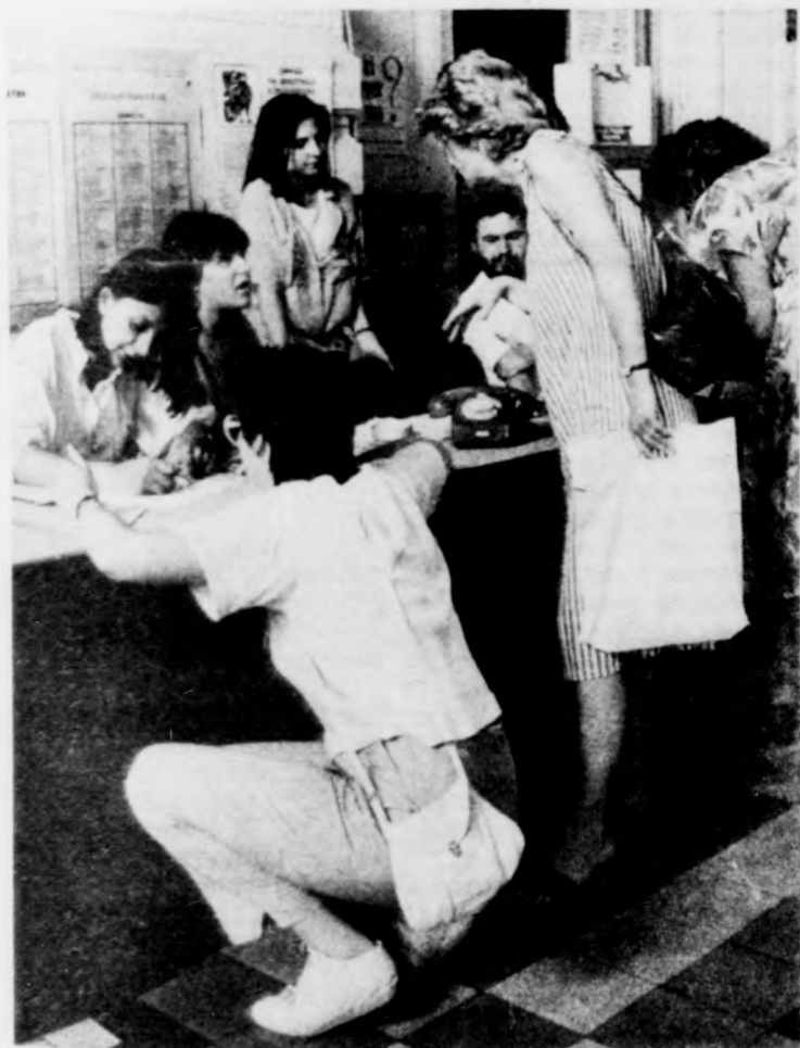
Nagy forgalom az információsoknál