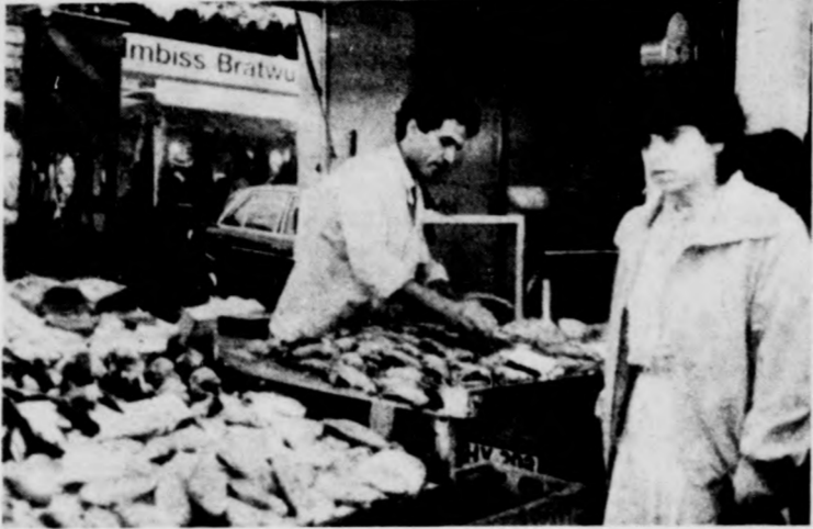
Egy nyugodt árú a halpiacon

Egyszerre egy fifikás vásárló — csak a vice kedvéért — két szatyor banánt csak azért vett meg jó pénzért, hogy a lépcsőkre állva „háta tamadja” ugyanazt a tömeget. S miközben antikrisztusi kacajjal ordítja: „az enyemét egyétek” — a két „banántűz” közé szorult tömeg nem is tudja, melyik jövevénye felé forduljon. De a két szatyor mennyiség