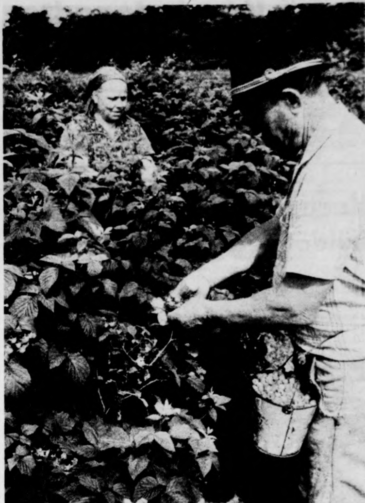
A szövetkezet 35 hektáros ültetvényét közösen művelik a tagok

A program ma reggel 9-kor folklórbemutatókkal folytatódik a Kossuth Lajos Tudományegyetem aulájában.