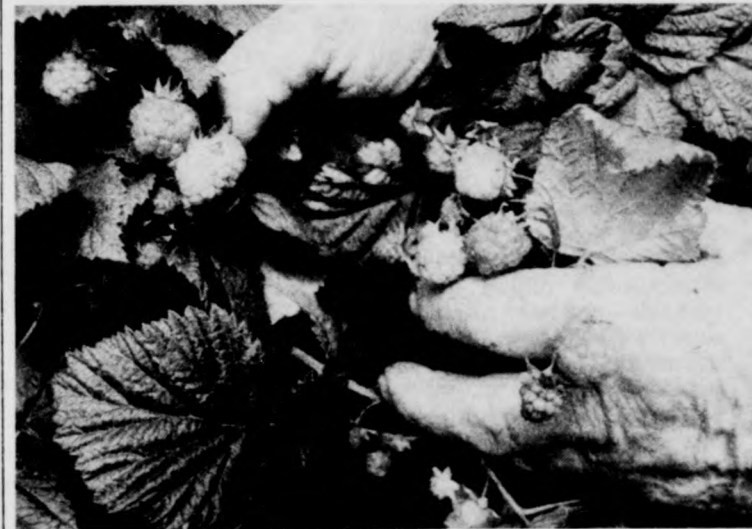
Egyszerre van bimbó, virág és érett gyümölcs is a bokrokon