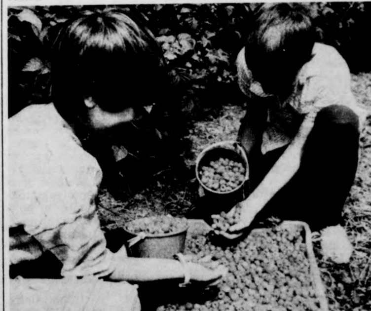
A szüret a gyerekeknek sem rossz mulatság