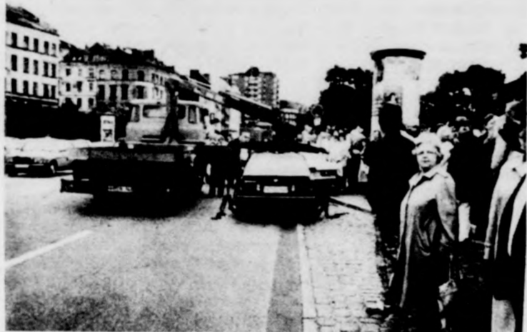
Igy jár, aki rossz helyen parkol Hamburgban

A szabad polgárok városának lakói azokban a napokban, mikor ott jártam, a labdarúgó Európa-bajnoksággal elfoglaltak. Kettőzött lelkesedéssel szurkoltak csapatuknak, hiszen az egyik elődöntő helyszínének Hamburg volt kijelölve. De nagyon szorítottak azért is, hogy Anglia el ne jussan az előfőnléba, hiszen a helyiek rettegtek az angol szurkolók vandalizmusától. Már utólag tudtam meg — hiszen a négy nap azért gyorsan elteltek — hogy az angol szurkolók csapatuk dicstelen szereplése miatt már nem juthattak el Hamburgba. Ott voltak azonban a hazai szurkolók, akik a Hollandiától elszenvedett vereség után „feledtetni” tudták az angol drukkerék távollétét.