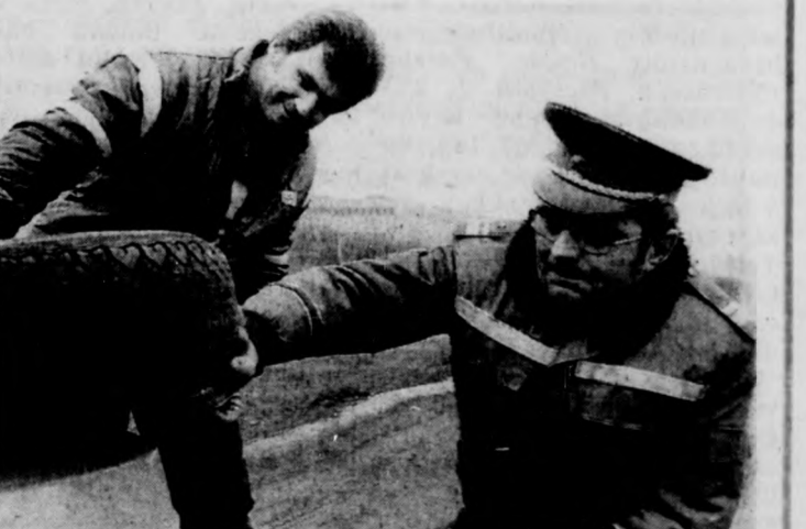
A pótkerék futófelületét is tüzetesen megvizsgálták

Az Országos Rendőr-főkapitányság felhívása értelmében február 17-én hasonló, fokozott közúti ellenőrzésre kerül sor Hajdú-Bihar megyében is.