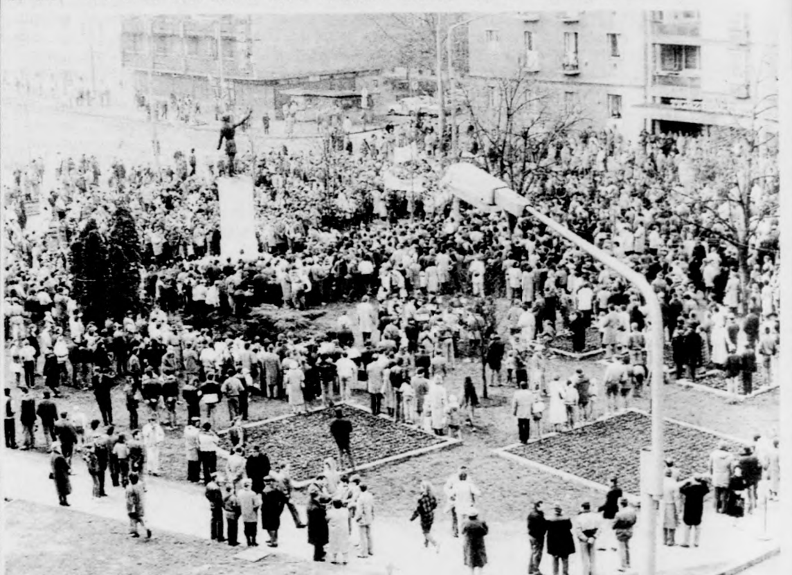
1848-ra emlékeznek a Petőfi-szobor előtt

Koszorúzási ünnepséget rendeztek a Honvédtelom- ben és a Nagyandor-em- lekműnél is.