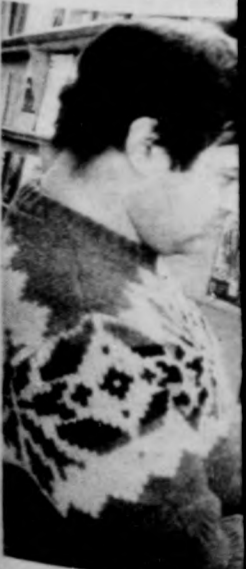
Kilencvenféle nap érdeklődők a hír

Kiderülhet a programhirdetések a Kólcsey Művel pont médiatára sen gazdag. A tiz liméteres filmek bot számlálnak a ban (ezek zömbe ismeretterjesztő dokumentum- és mek közép- és ál kolásoknak). Fejl