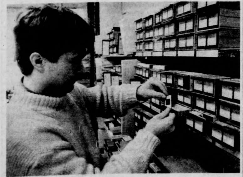
Videokazetták, diák, tizenhat milliméteres kisfilmek, hangkazetták, hangszalagok kínálják magukat a médiatárban