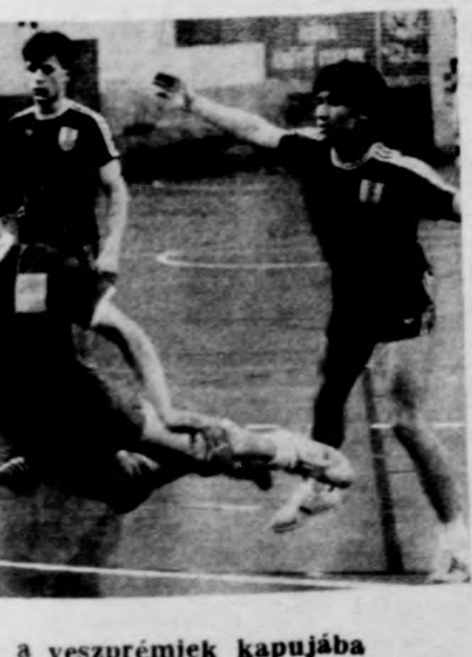
DSI beállása gólt dob a veszprémiek kapujába