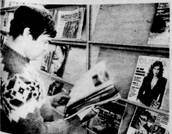
Kilenvenféle napi- és hetilap között válogathatnak az érdeklődők a hírlapolvasóban

Sokaknak kedvenc időtöltési helye a hírlapolvasó, amelyet az intézmény a debreceni városi könyvtárral közösen „üzemeltet”. Kilenvenfajta napi-és hetilap, folyóirat, magazin jár ide, természetesen a reformújságírás organumai (a Reform, a Hítel, a Kapu stb.) is megtalálhatók itt.