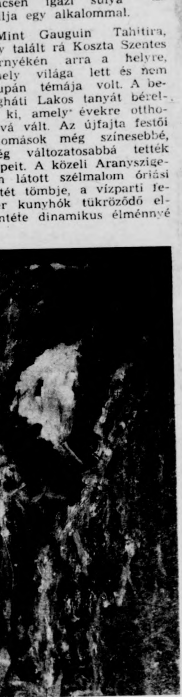
Kosztá József: Kukoricatörés